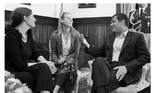
El mandatario reiteró a la madre de Assange que su Gobierno sabrá adoptar una decisión soberana.

En los primeros siete meses del 2012 también hubo cientos de atentados y amenazas de muerte contra profesionales de la información, secuestros, disparos contra periodistas, bombas en hogares y medios, detenciones arbitrarias de reporteros y corresponsales extranjeros, palizas, cierres de radioemisoras locales, llamados telefónicos intimidatorios para disuadir la cobertura de conflictos sociales, etcétera. Asimismo, resulta notoria la impunidad y el desinterés de los gobiernos por medidas de protección. (SE)