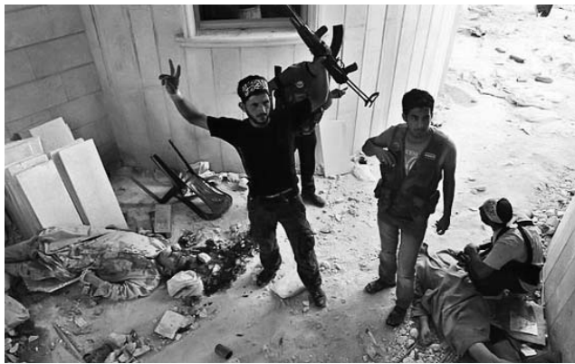
Al parecer la ejecución se llevó a cabo en el patio de un colegio de la ciudad de Aleppo.

La Cancillería siria envió comunicados al Consejo de Seguridad de la ONU y al secretario general de este organismo, Ban Ki-moon, denunciando que los sublevados están utilizando a los civiles en Aleppo como escudos humanos, y matando a cualquiera que