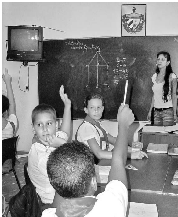
La prioridad está en la educación primaria, por ser la base del sistema de enseñanza.

Lograr el 100 % de la cobertura docente en todos los niveles educativos constituye una máxima para septiembre próximo