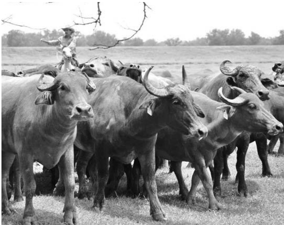
En la Estévez Ruz existen hoy mejores condiciones para fomentar la cría del búfalo.

"En el macho sí empezamos desde la categoría de añojo, y después de 24 meses ya es un toro cebado. Las ganancias se anuncian solas cuando usted analiza que un macho vacuno llega a 420 kilos en 36 meses, mientras un búfalo logra 480 en 25 o 26",