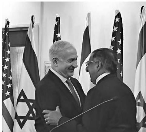
Panetta garantizó a cada uno de los dirigentes israelíes con los que se reunió que Irán no desarrollará el arma nuclear.

Panetta se refirió a la República Islámica como una amenaza por su programa nuclear —sobre el cual Occidente insiste