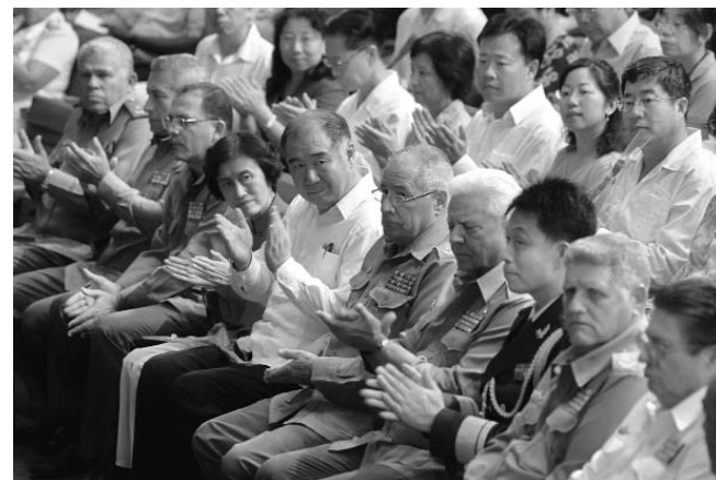
Cuba celebró el aniversario de fundación del Ejército chino en la Sala Universal de las FAR.

La cooperación estratégica bilateral se ha mantenido al más alto nivel —dijo—, lo cual