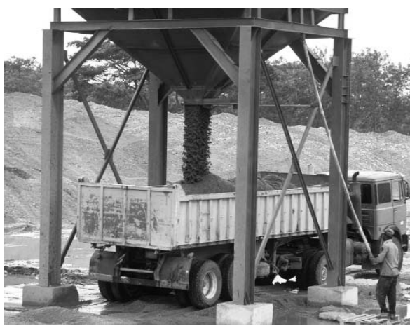
La producción de Algaba, con alto contenido de sílice, es muy demandada para los hormigones especiales.

Con anterioridad la UEB Canteras también había recuperado la arenera Algaba, en Trinidad, industria que pro-