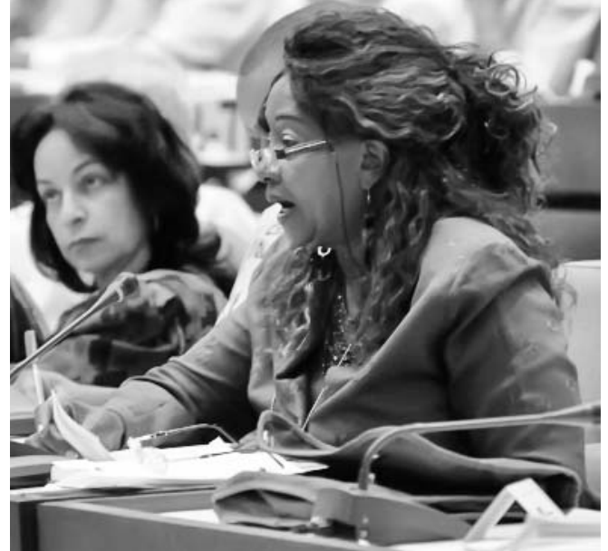
Hubo numerosas intervenciones sobre la rendición de cuentas del MINSAP.

Esto ha permitido que un mayor número de pacientes encuentren solución a sus problemas de salud en los propios consultorios, a partir de la permanencia del médico y la