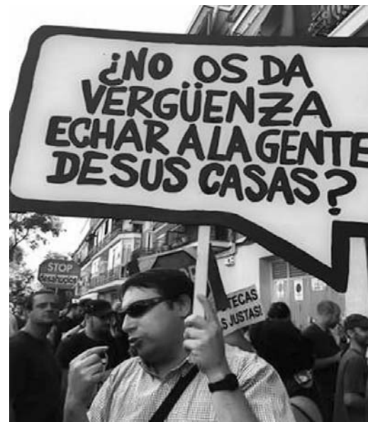
En el primer trimestre del año, los tribunales españoles han ordenado 46 559 desalojos.

El Gobierno conservador de Rajoy pende de un hilo, y el menor soplo de Bruselas o los mercados podría llevarlo al precipicio,