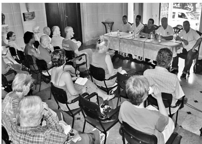
Talleres sobre temas de interés para los miembros de la 23 Caravana de Pastores por la Paz.