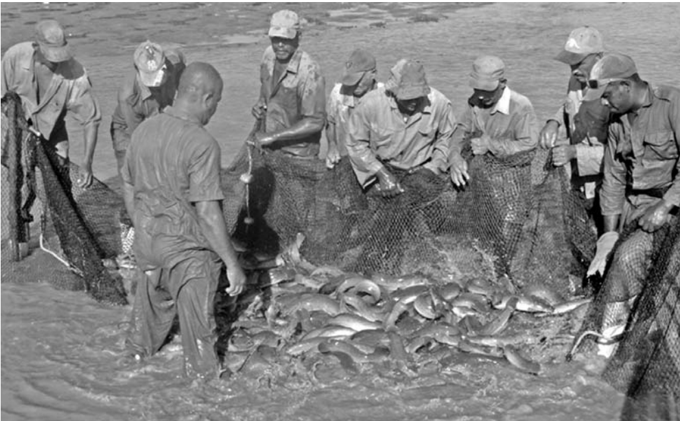
Más de 280 toneladas de pescado, mayormente de claria, produjo Aleviceba en el primer semestre.