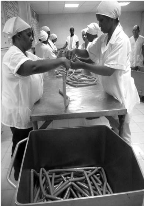
La elaboración de embutidos, nueva línea productiva de la industria.

De la producción total conseguida, 285 toneladas las aporta el primero de esos colectivos y 279 el segundo, con una diferencia mínima a favor de Aleviceba, que sobrecumple su plan en 12 % y planifica