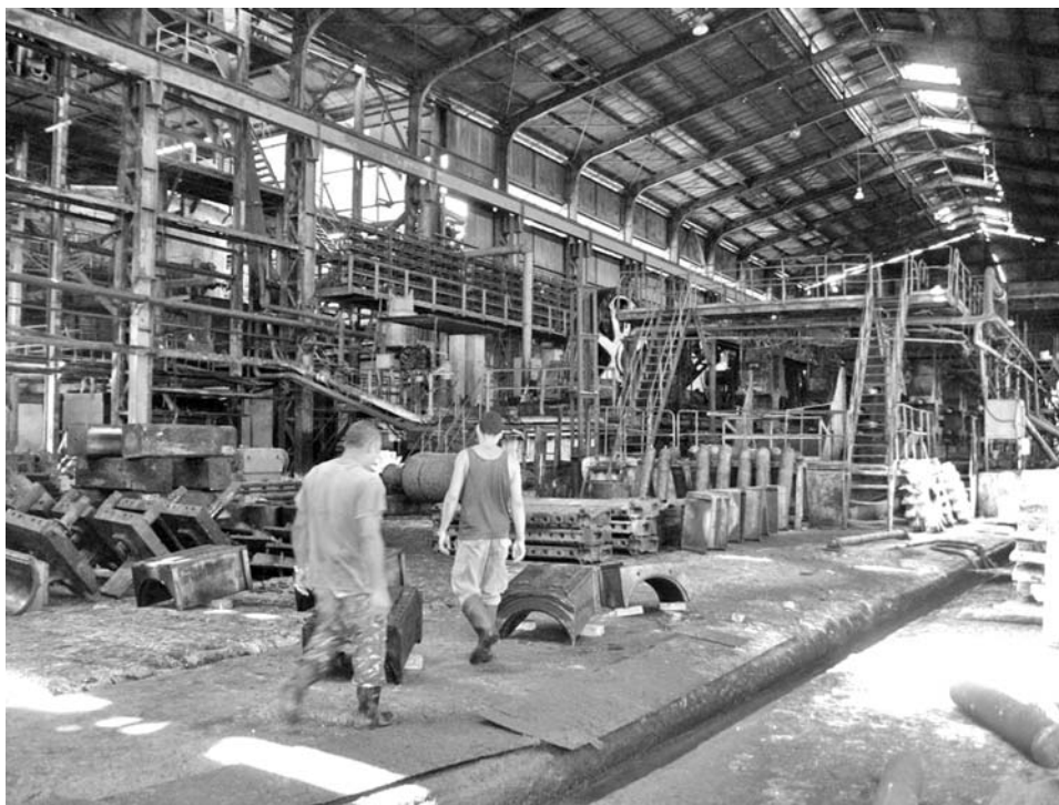
El Mario Muñoz arrancó con un mes de atraso, y ya en zafra la industria nunca trabajó con estabilidad.

experiencia de los operadores en puestos clave.