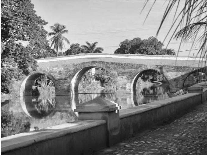
El proyecto ingeniero sobre el Yayabo resultó para su época una monumental obra de marcado estilo románico.

Vitloch adelantó que de conjunto con espe-