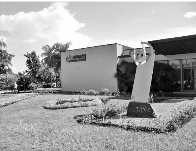
El Laboratorio Antidoping, una prestigiosa institución que analizó todas las muestras de los cubanos.

En aras de respetar las reglas de una institución tan prestigiosa (solo existen 33 en el mundo) Montes de Oca aclaró que las muestras llegan al Laboratorio con un código numérico, nosotros no sabemos de dónde provienen, esa