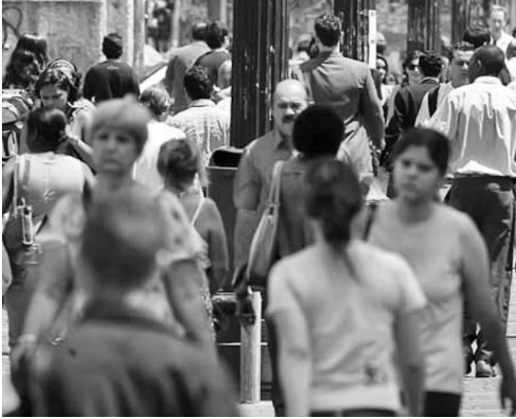
El crecimiento de la población mundial, a la vez que ofrece nuevas oportunidades, nos obliga a repensar el hoy.

Otro tema medular lo constituye el hecho de que el incremento demográfico es directamente proporcional con la necesidad de producir más alimentos. Empero,