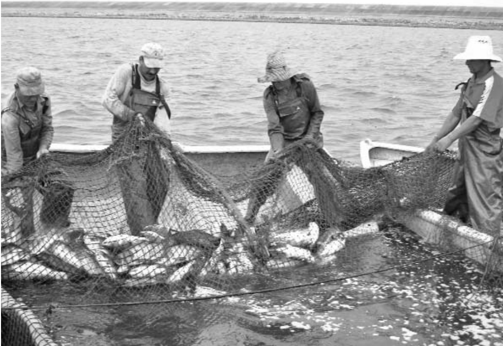
Mucho oficio y experiencia exige el llamado sistema chino para lograr una buena captura.

Ese ha sido, quizás, uno de los factores que han llevado a la zona de pesca