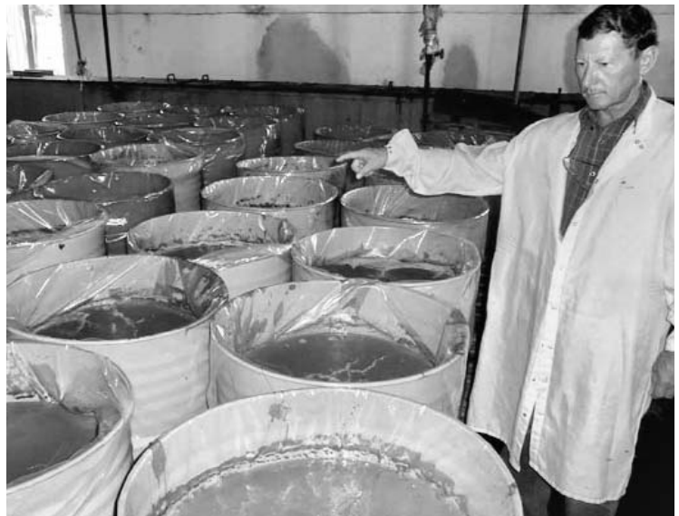
El sobrecumplimiento del plan en más de 700 toneladas ha obligado a buscar alternativas para seguir envasando materia prima.

Paralelamente, ante la magnitud de la cosecha, ha sido preciso enviar alrededor de 200 toneladas de fruta fresca a las industrias de otros territorios, al tiempo que se incrementó la entrega a los mer-