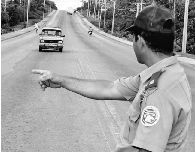
En el verano aumentan las medidas de control del tránsito.

Otra acción que impulsan en más de 80 tramos —considerados entre los de mayor peligrosidad— es la recogida