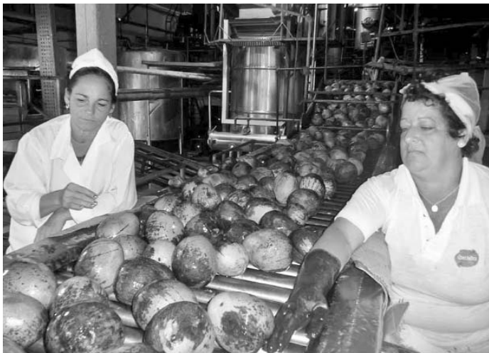
Aunque ya alcanzó la cifra planificada, La Conchita continúa moliendo, con el propósito de seguir respaldando la producción de alimentos.

Sin embargo, las condiciones de una industria con un equipamiento maltrecho, que hoy se encuentra al tope de sus posibilidades, obligan a pensar en soluciones a mediano plazo, que eviten malograr los esfuerzos y recursos invertidos en el desarrollo de la producción de frutales.