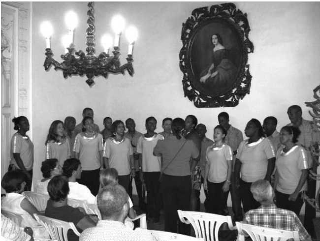
El Coro de Camagüey interpreta conocidos poemas de Nicolás Guillén.