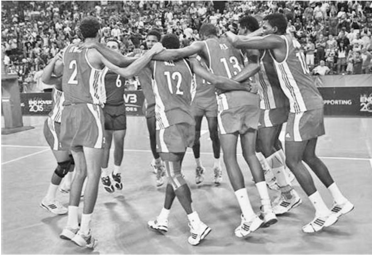
Desde el 2005 un equipo nuestro no ganaba una medalla en la Liga Mundial.