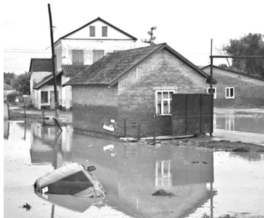
En la zona de Kuban más de 24 mil personas fueron afectadas por las intensas lluvias.

En la zona de Kuban, en la cuenca del río