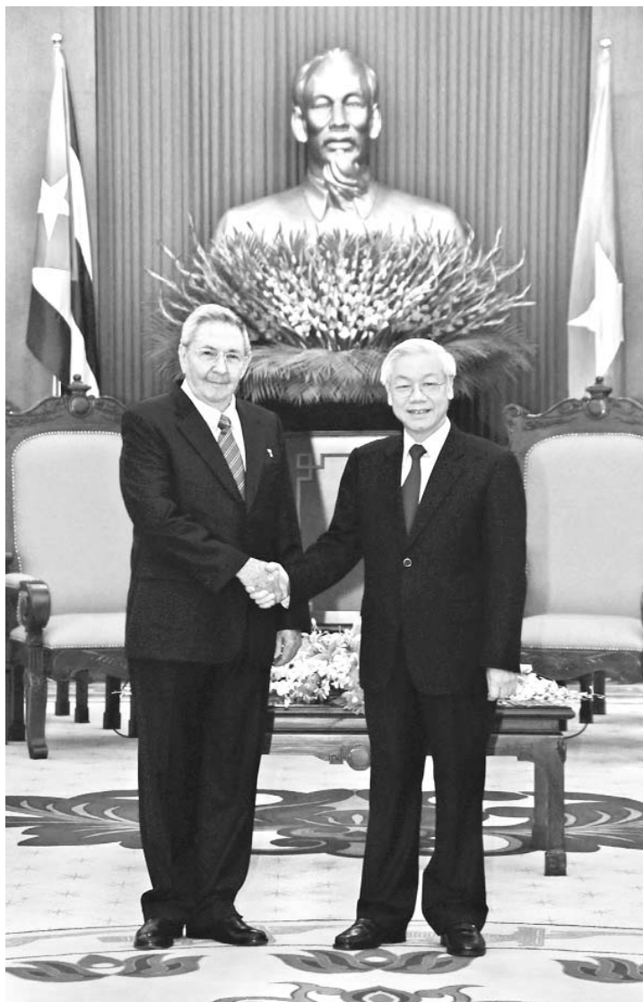
Raúl y el Secretario General del Partido Comunista de Vietnam, Nguyen Phu Trong.

Hoy lunes, el Presidente cubano y la delegación que lo acompaña —integrada por Ricardo Cabrisas Ruiz, vicepresidente del Consejo de Ministros, y el canciller Bruno Rodríguez Parrilla—, rendirán tributo a los héroes y mártires vietnamitas, especialmente a Ho Chi Minh en el mausoleo erigido en su honor e intercambiarán con el compañero Nguyen Sinh Hung, Presidente de la Asamblea Nacional.