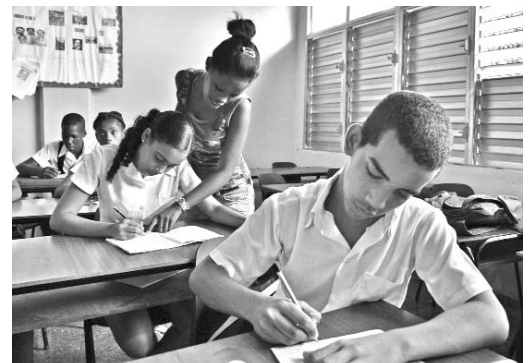
En La Habana se proyecta para el próximo curso una mayor presencia de estudiantes en las especialidades agropecuarias, de la construcción y del transporte.

Según Falcón Suárez, el nuevo curso pone en marcha por primera vez en La Habana las