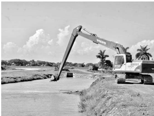
Trabajos de dragado en el Canal Principal Número Uno, en Sur del Jíbaro.

A lo largo de los casi 45 kilómetros de trazado del Magistral se reportaron ocho afectaciones, la mayor de ellas provocada por el desbordamiento de la Laguna de Boquerones, que impactó ambos taludes y provocó la inundación total de la zona, incluida la cercana estación de alevinaje.