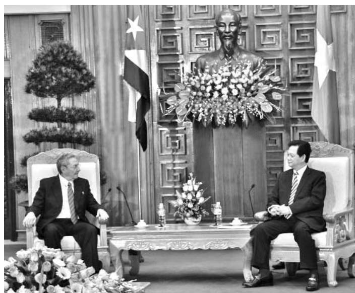
Con el Primer Ministro Nguyen Tan Dung.