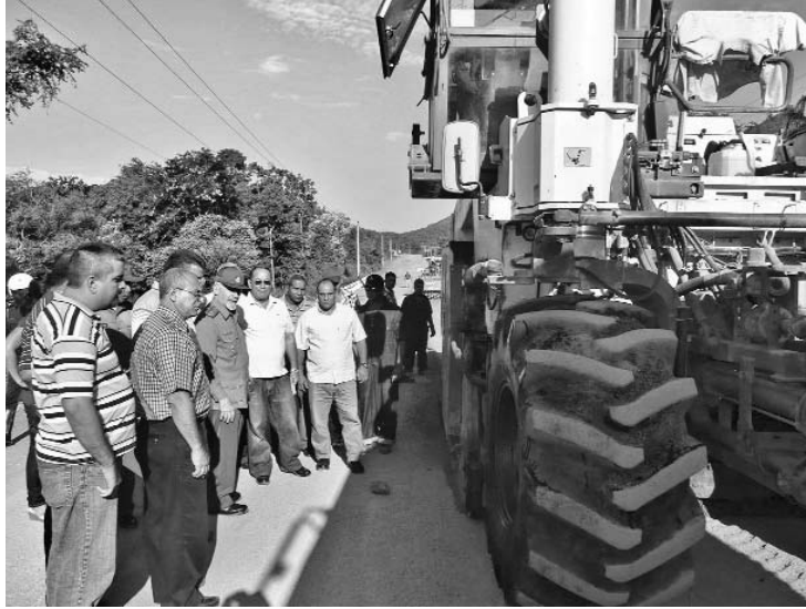
Con los recursos asegurados, la moderna máquina podría reciclar 7 kilómetros de terraplén en 24 días.

Única de su tipo en el país y valorada en dos millones de dólares, la máquina puede alistar 7 kilómetros de terraplén en 24 días, de ahí que se orientó asegurar todos los recursos materiales y técnicos que en esta etapa le permitan adelantar el vial hasta Chivirico, poblado cabecera del municipio santiaguero de Guamá, y luego hasta Pílon.