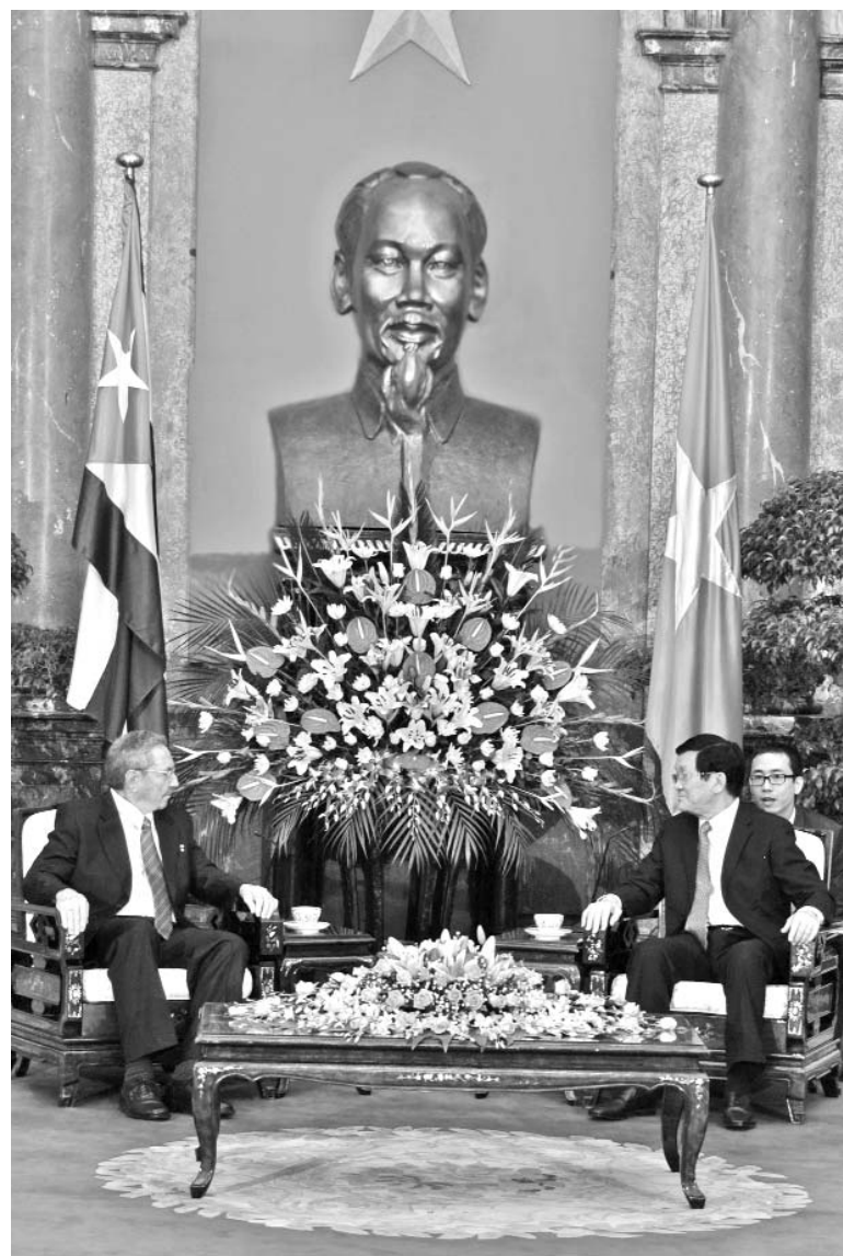
El encuentro entre Raúl y el Presidente de Vietnam, Troung Tan Sang.