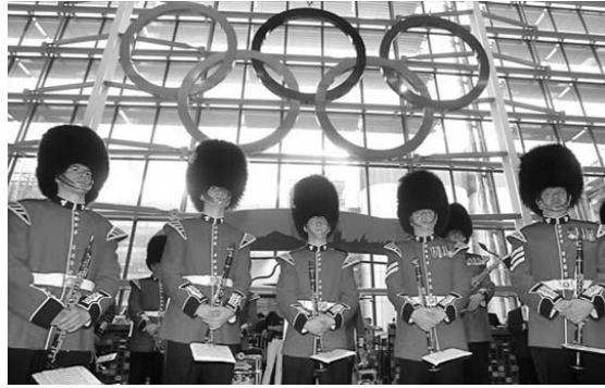
Los aros olímpicos dan la bienvenida a los viajeros en el aeropuerto londinense de Heathrow.

La apertura del evento lanzará un mensaje ecologista sobre la recuperación de un terreno envenenado por la industria, donde, después de un tratamiento de lavado, se construyeron obras como el Parque Olímpico, al este de la capital. La campana que marcará el inicio de esa noche inaugural lleva grabada una cita extraída de la mencionada obra de Shakespeare: