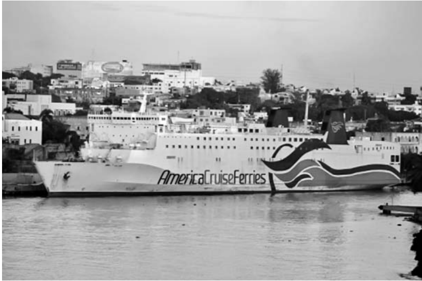
El gobierno de EE.UU. ha prohibido a sus nacionales viajar a Cuba durante más de medio siglo.

Lo interesante es que la vieja campaña de difamación contra Cuba en medios gubernamentales y corporativos estadounidenses sigue presente y hasta parece intensificarse ahora, matizada por el propósito de des-