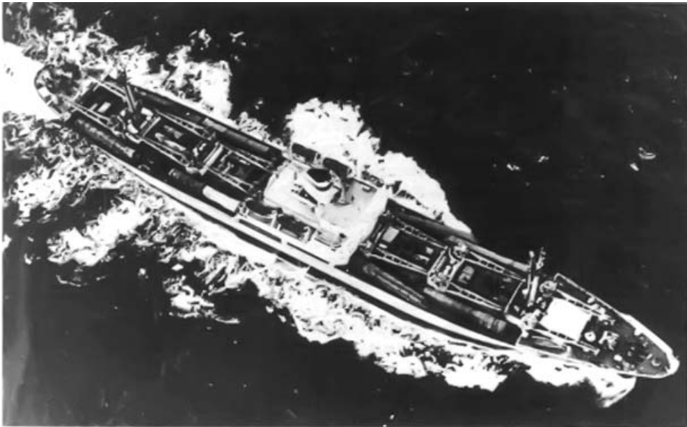
Un ataque a los barcos debía ser interpretado como una agresión a la Unión Soviética.

Este día llegó al puerto de Mariel la motonave Poltava, la que trasladó a Cuba los primeros elementos del regimiento coheteril estratégico que sería emplazado en la región de Candelaria-San Cristóbal, provincia de Pinar del Río, en la parte occidental de la Isla, incluyendo ocho cohetes de com-