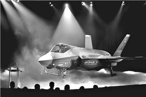
El nuevo F-35 Joint Strike Fighter es una de las estrellas del arsenal estadounidense.

PL indica que los 774 mil 549 millones de euros que adeuda hoy la nación ibérica son el monto más alto de toda la serie histórica, que comenzó en 1995, a pesar de que no se incluye el impacto del préstamo de 100 mil millones de euros solicitado recientemente al Eurogrupo.