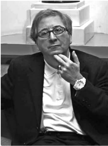
El poeta español Luis Antonio de Villena con- firmó su participación en el Coloquio.

Villena (Madrid, 1951) cuenta con una obra poética de reconocidos méritos, ja- lonada por títulos como El viaje a Bi- zancio (1976), Huir del invierno (1981), Celebración del libertino (1998), Las