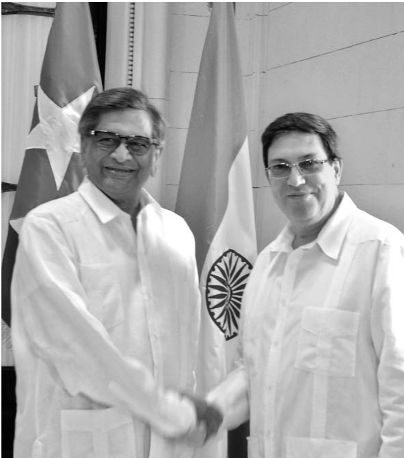
El Canciller indio envió un mensaje al pueblo cubano y sus dirigentes en nombre de su Gobierno.