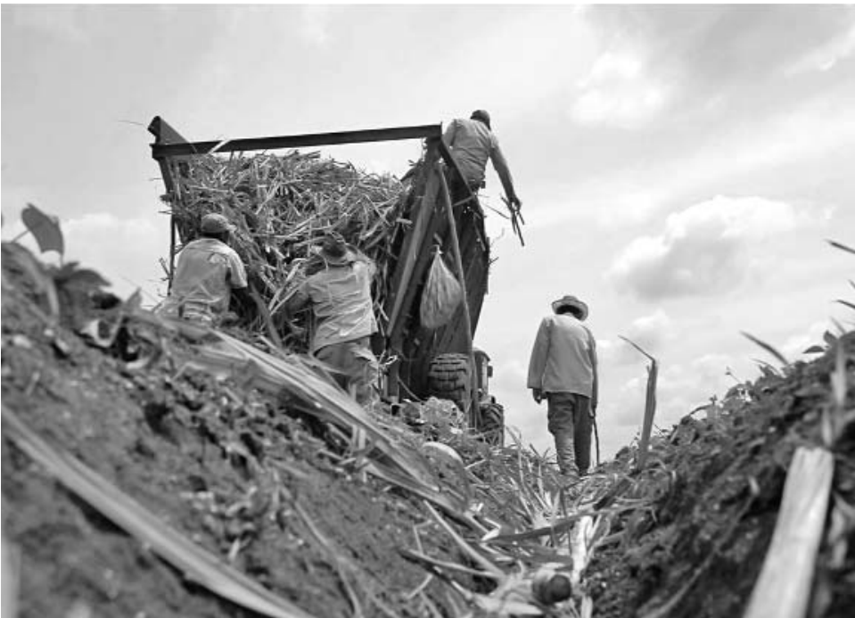
Sancti Spíritus logró sembrar en el llamado periodo seco unas 600 hectáreas de caña, cifra sin precedentes en los últimos quince años.

La incorporación a finales del 2011 de equipos móviles con sistemas enrolladores, alimentados con