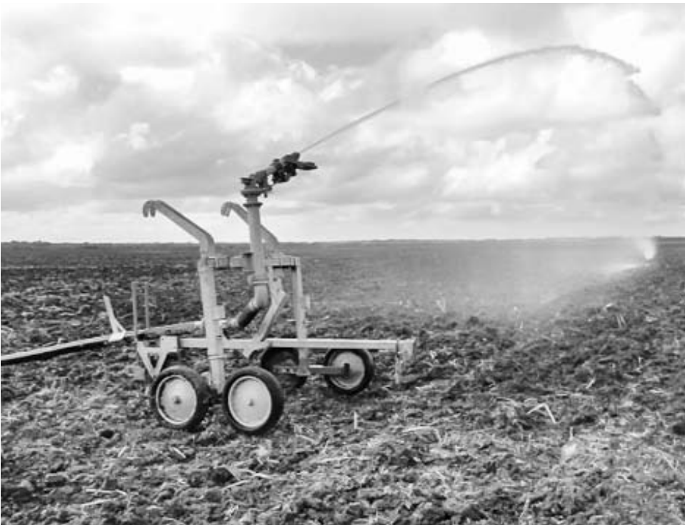
El empleo de sistemas de riego móviles permitió la apertura de frentes de trabajo en Las Vegas y Cantarrana.

diésel, por fortuna ha comenzado a cambiar una parte de esa historia, particularmente en la zona sur, donde en esta etapa se plantaron cerca de 600 hectáreas, la mayor cifra de los últimos tres lustros en el territorio.