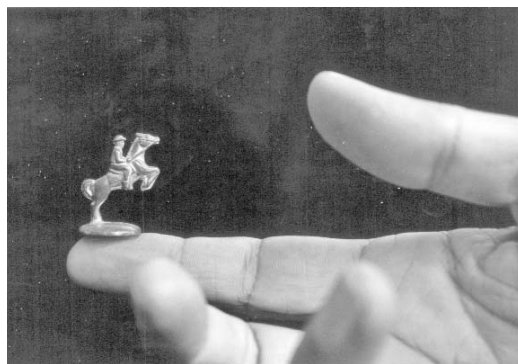
Mambrú se fue a la guerra, fotografía de Alicia Leal.

Dejo tres nombres aparte porque lo que exhiben puede tomarse como puntos de inflexión ascendentes en sus poéticas. Lesbia Vent Dumois, siguiendo la línea inédita que nos des-