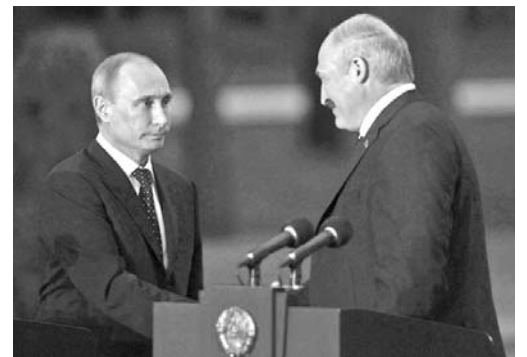
En su primera gira internacional, el mandatario ruso visitará, además, Alemania y Francia.