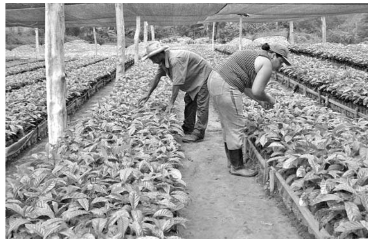
Los injertos se practican por ahora solo en el vivero tecnificado de la Cooperativa Congreso Campesino en Armas.

El cruzamiento posibilitará la expansión geográfica de la