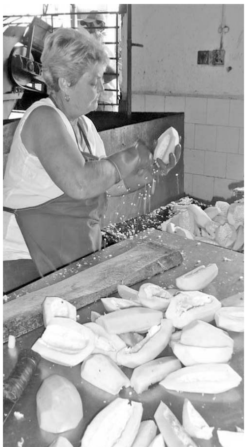
Organismos como la Agricultura deben atender todavía sus cuentas por pagar.

En cuanto a las cuentas por pagar, estas suman 261,7 millones, disminuyendo en más de 24 millones respecto al año anterior, no obstante existen 45,7 millones en las cuentas vencidas, de lo