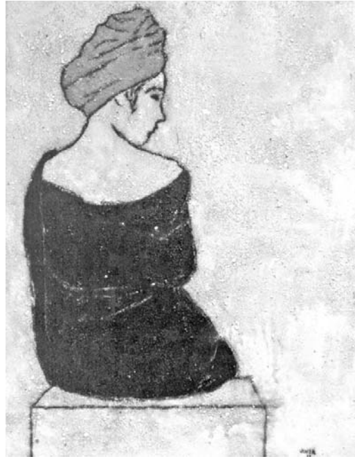
Mujer de turbante rojo, de Joel Jover.

El más veterano es el maestro Adigio Benítez (1924), que exhibe un lienzo pletórico de frescura. Y luego, en sucesivas variaciones de expresiones particulares, se despliega todo el