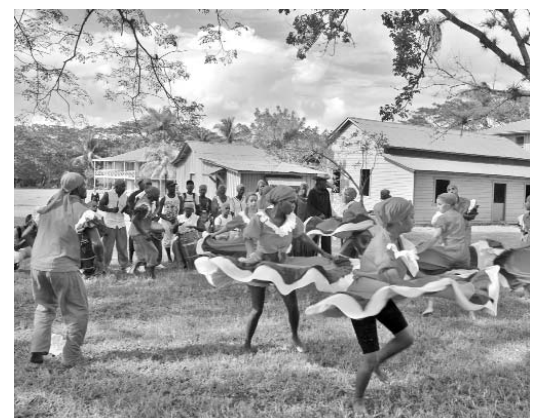
En Cueto conservan con especial interés las tradiciones culturales. En la foto, el grupo Renovación Haitiana.