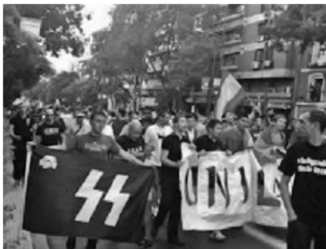
Manifestación Neonazi en las calles de Madrid hace menos de una semana.

En la década de los noventa, pandillas de jóvenes volvieron a resucitar el fantasma neo-nazi en Alemania, que dirigió su frustración contra los inmigrantes. Mas Alemania no era el único país en el que proliferaron el nacionalismo y el racismo. Los hooligans ingleses y rusos, vándalos de los