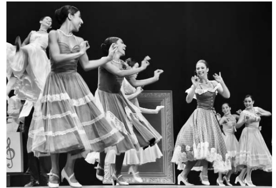
El Ballet Litz Alfonso estará presente en los espectáculos de premiación en el teatro Karl Marx.

En ambas veladas se darán a conocer los premios a las mejores realizaciones de la discografía cubana durante el último año en las 36 categorías convocadas, y se otorgará el Gran Premio al