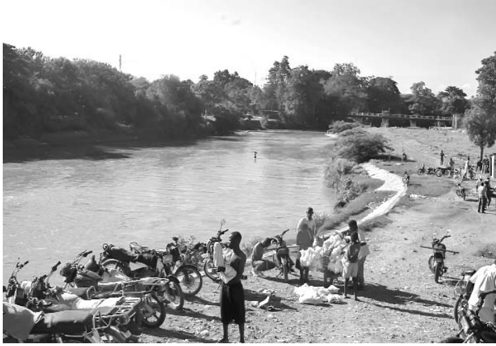
Pese a ser una importante fuente de alimentación para los sistemas de riego, el Masacre es actualmente un territorio de desperdicios y escombros.