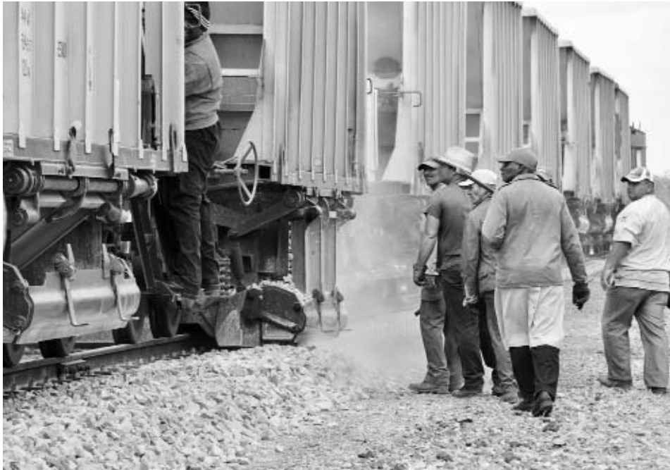
Trabajadores ferroviarios ejecutan labores de reparación capital.

Por otra parte, en el 2011 fueron restablecidas líneas e importantes ramales de distintas provincias del país, entre los que sobresale el ramal de Yaguasita en Mariel, provincia de Artemisa. Igualmente se pusieron a funcionar varios servicios ferroviarios destinados a la transportación de pasajeros.