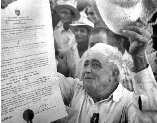
La alegría al recibir el título de propiedad.

En aquellas circunstancias, fue el justo y merecido premio a quienes habían participado en las batallas por la independencia, aportado sus mejores hijos a la causa, y contribuido a asentar las bases de aquel ejército liberador que ponía fin a la explotación.