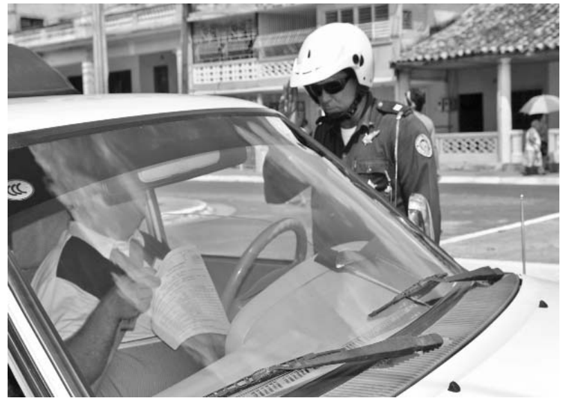
En el trimestre enero-marzo en Pinar del Río se realizaron 8 517 notificaciones y se retiraron 141 licencias de conducción.

En el trimestre enero-marzo se realizaron 8 517 notificaciones y se retiraron 141 licencias de conducción. Durante la etapa también se multaron 864 conductores de vehículos de tracción animal, fundamentalmente, por circular en el horario comprendido entre el anochecer y el amanecer sin algún dispositivo lumínico o reflectante que indicara su presencia en la vía. Esta in-