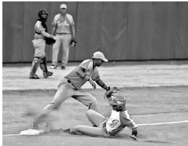
Los Tigres han jugado casi perfecto a la defensa en esta semifinal contra Granma.