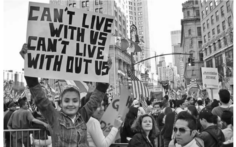
"No pueden vivir con nosotros, no pueden vivir sin nosotros", destaca una inmigrante en Estados Unidos.

Según algunos analistas, Olmert no abandonó el