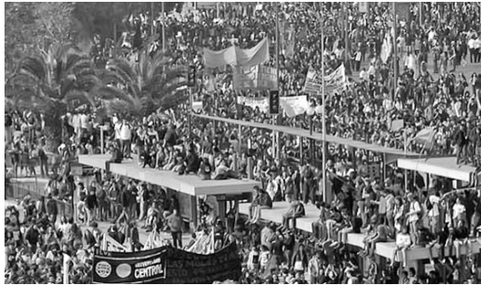
La marcha en Santiago reunió a entre 80 y 100 mil personas.

SANTIAGO DE CHILE, 16 de mayo.—Decenas de miles de estudiantes marcharon hoy por el centro de Santiago, en reclamo de una completa reforma al sistema educativo chileno, uno de los más caros y desiguales del planeta como herencia de la dictadura de Augusto Pinochet, que redujo a menos de la mitad el aporte público y fomentó la inclusión de los privados.