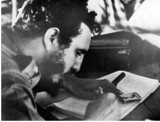
Fidel firma la Ley en La Plata.

La Ley consagró el principio de que la tierra es de quien la trabaja y benefició de un tirón a 100 mil productores pequeños. Siendo tan justa y necesaria, histórica, moral, social y económicamente, que incluso incrementaría el mercado interno, fue sin embargo fuertemente combatida por la oligarquía nacional y el imperialismo norteamericano. Es que una y otra tenían intereses comunes; cualquier medida destinada a