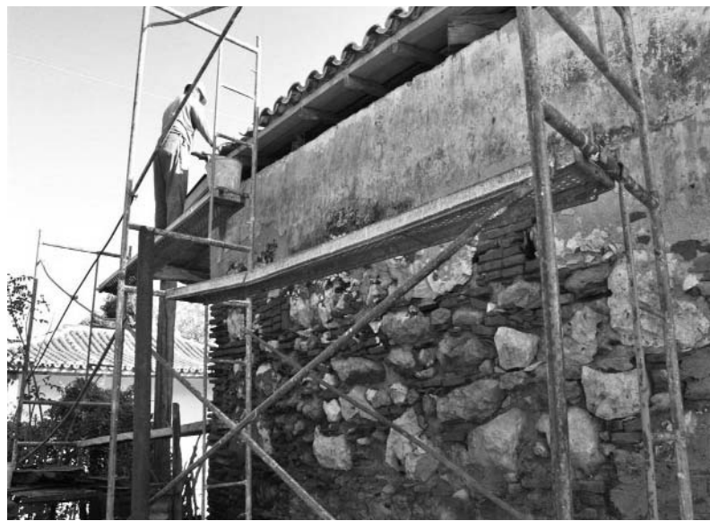
Paredes de mampuesto, propias de este tipo de edificación.