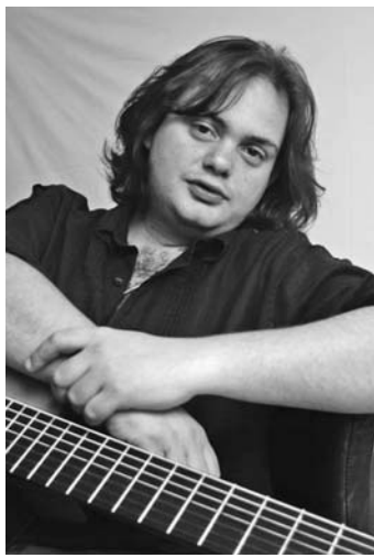
Yamandú Costa (Brasil).