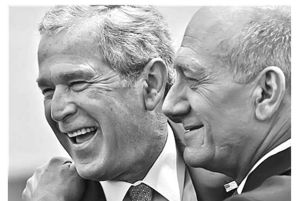
Una de las tantas visitas de Olmert a la Casa Blanca.

Muchos están molestos con Obama, pues llegó a la Casa Blanca con la promesa de una necesaria reforma migratoria que no acaba de concretarse. Sin embargo, no parece que los republicanos tengan algo mejor que ofrecer. Y es que no importa quién ocupe el Despacho Oval. Una cosa es la cáscara, y otra el huevo. Los problemas sistémicos no se resuelven con medidas coyunturales.