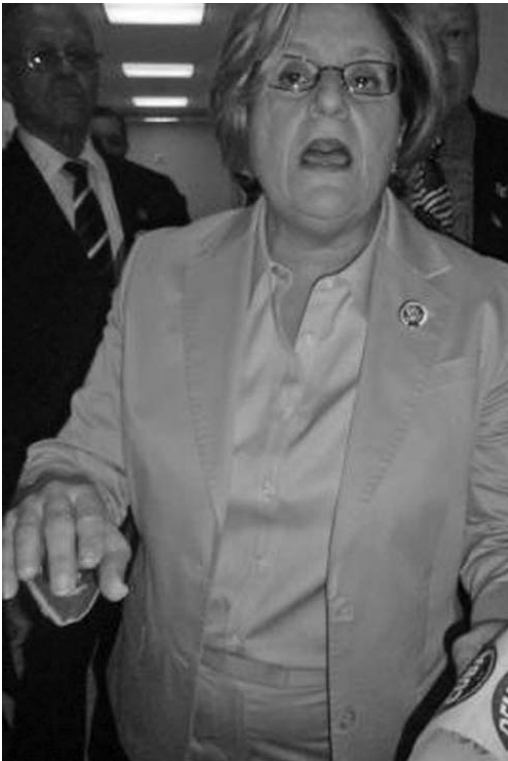
La relación de la bruja del Capitolio con la mafia terrorista cubanoamericana “la condena” a callarse la boca.

En cuanto a la presidenta del Comité de Relaciones Exteriores del Congreso de Estados Unidos, Ileana Ros-Lehtinen, eminencia del Partido Republicano en la Cámara de Representantes, su relación sulfurosa con la mafia terrorista cubanoamericana la condena a callarse la boca.