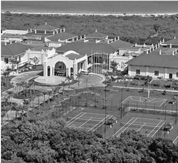
En Ensenachos, uno de los hoteles de Cayo Santa María.

La XXXII Feria Internacional de Turismo (FITCUBA 2012) tendrá lugar desde el próximo martes 8, y por primera vez su sede será Cayo Santa María, al norte de la central provincia de Villa Clara. Ese destino turístico, considerado el más joven en Cuba, acogerá a funcionarios del ramo, turoperadores, agentes de viajes, prensa especializada y a representantes de líneas aéreas, de asociaciones y organizaciones afines, entre otros, según el Ministerio del Turismo (MIN-TUR).