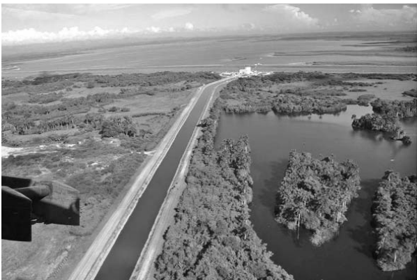
A pesar de las lluvias de los últimos días, la presa Zaza se mantiene al 23 % de su capacidad.

rimientos ocurridos solo significaron la incorporación de unos 23 millones de metros cúbicos a los embalses, lo que los mantiene en un estado desfavorable al iniciarse el quinto mes del año.