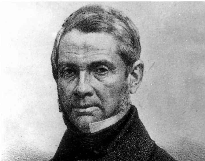
JOSÉ ANTONIO SACO