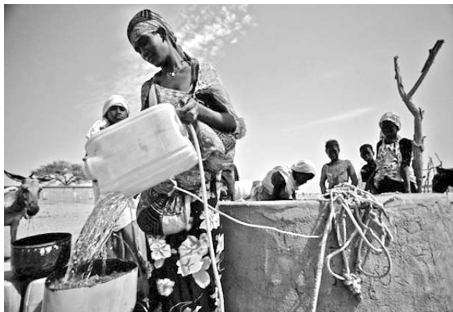
El hambre y la sequía en el Sahel africano han cobrado la vida de alrededor de 100 mil hombres, mujeres y niños desde abril del 2011.

El mundo necesita un sacudón. Así lo clamaron millones en todo el orbe durante las celebraciones del Primero de Mayo. Los que sobran no son los seres humanos, sino la avaricia, el desmedido consumo, el individualismo feroz, el absoluto reino del capital. Hace falta una carga universal contra los bribones.