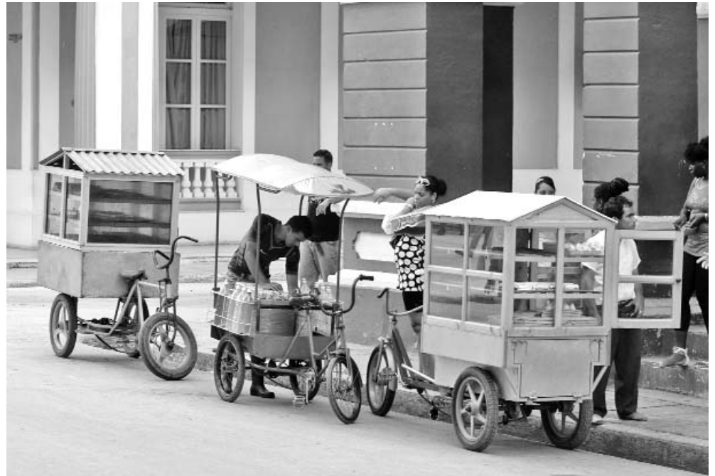
Los vendedores ambulantes constituyen el mayor número de trabajadores por cuenta propia con licencias sanitarias, por lo que es imprescindible incrementar las acciones de capacitación dirigidas a este grupo.

Los inspectores sanitarios estatales, junto a los coordinadores de programas de alimentos en los centros provinciales, también han recibido preparación. La especialista afirma que el país cuenta con personal especializado suficiente. "Tenemos más de 2 000 inspectores sanita-