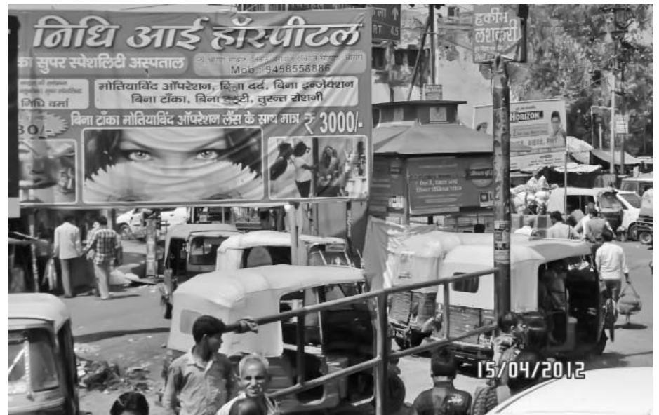
Vehículos llamados tuk-tuc en constante movimiento por los callejones comerciales de Nueva Delhi.