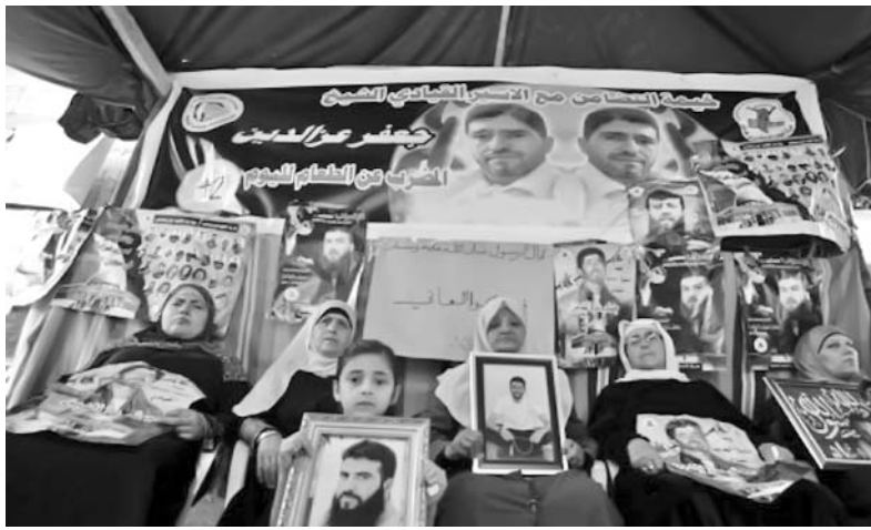
Palestinos muestran fotos de parientes presos en Israel.