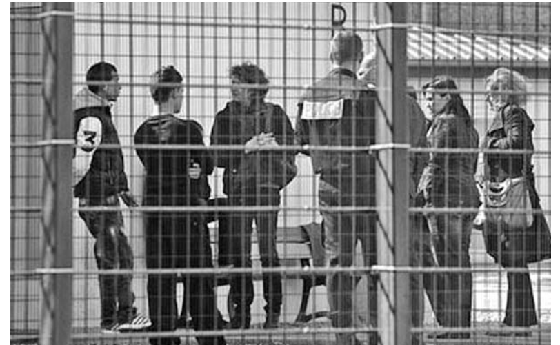
Visita de parlamentarios europeos al centro de detención de inmigrantes de Lingolsheim, cerca de Estrasburgo.