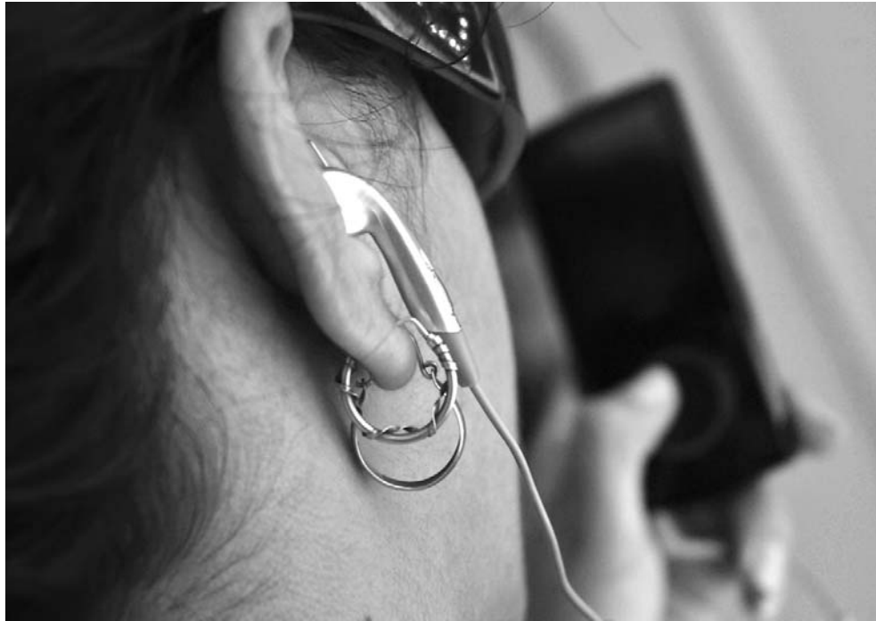
El uso frecuente de dispositivos para reproducir música mediante audífonos puede afectar la audición cuando se escucha en volúmenes muy altos o por más de una hora.

brilla por su ausencia, pero tampoco queremos que el ruido del otro nos moleste. Es una realidad que el número de quejas por esta causa ha aumentado con el paso de los años, mientras que no ha ocurrido así en lo que respecta a la conciencia ciudadana sobre la necesidad de evitar este flagelo.