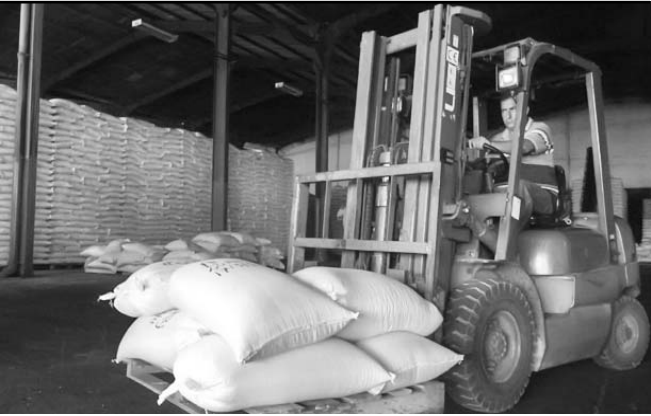
La producción de frijoles con destino al MINCIN ya superó la demanda de la provincia para la distribución normada y el consumo social.

“Esta es una práctica que existió siempre entre nuestros campesinos, con el propósito de obtener alimentos para su autoabastecimiento y al mismo tiempo mejorar los suelos, pero, sin respaldo de recursos, los rendimientos estuvieron muy por debajo de lo que ahora,