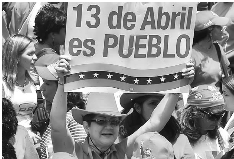
El pueblo, el verdadero héroe de abril.

Algo muy sintomático: los cientos de miles de personas que participaron entusiastas en la marcha del 11 de abril, sin excepción se