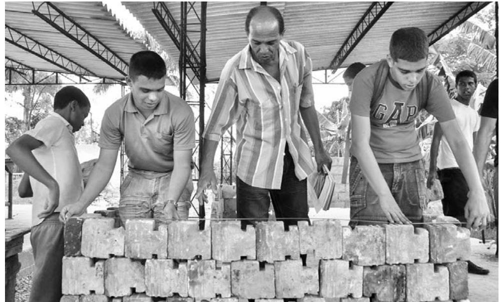
Con la guía de los instructores, los futuros albañiles aprenden a levantar bloques y ladrillos, tirar fino, entre otras acciones prácticas fundamentales.

Para ello, el Ministerio de Educación ga-