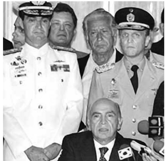
El rostro del golpismo.

3. La estrategia del golpe y la secuencia de hechos prevista, fueron diseñadas por los autores como piezas de un reloj suizo. ¿Acaso podían haber hecho esos planes los conspiradores venezolanos, sin los expertos