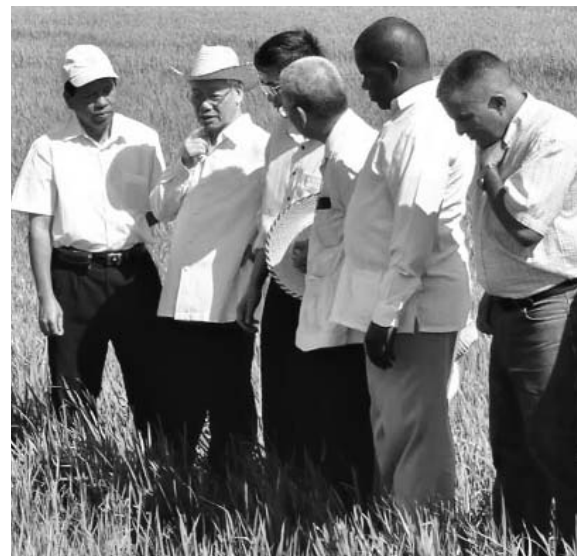
En el diálogo con campesinos y especialistas en Pinar del Río, Nguyen Phu Trong insistió en la importancia de mantener la disciplina tecnológica.

El dirigente vietnamita entregó una donación de 5 000 toneladas de arroz a Cuba en un acto de solidaridad que tuvo como escenario el capitalino Muelle Hai Phong,