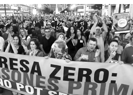
Como siempre, "los perdedores" serán los más pobres.

Frente a ello, refiere, "las políticas gubernamentales pueden ayudar a prevenir las contracciones prolonga-