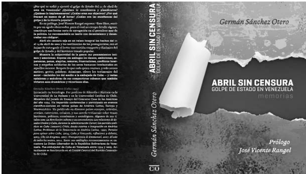
Cubierta del libro que será presentado hoy en Caracas.