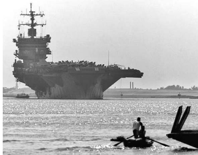
El portaviones nuclear USS Enterprise.

Por su parte, el ministro iraní de Asuntos Exteriores, Ali Akbar Salehi, advirtió que su país no aceptará la imposición de "condiciones" por parte de las grandes potencias mundiales antes de la reanudación de las negociaciones sobre su programa nuclear.