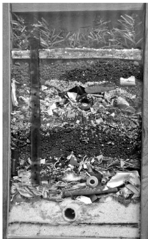
La imagen muestra la disposición de las capas del nuevo relleno sanitario, una de sus peculiaridades. De abajo hacia arriba: capa de arcilla, geomembrana, sistema de recolección de lixiviados, capas de desecho y relleno, sistema de desgasificación.

A ello se une la autorización para remotorizar 30 camiones de volteo y reparar otros 50; así como el reordenamiento para el