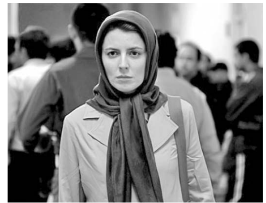
Leila Hatami, protagonista de Una separación .

llevar hasta el final sus macabros propósitos.