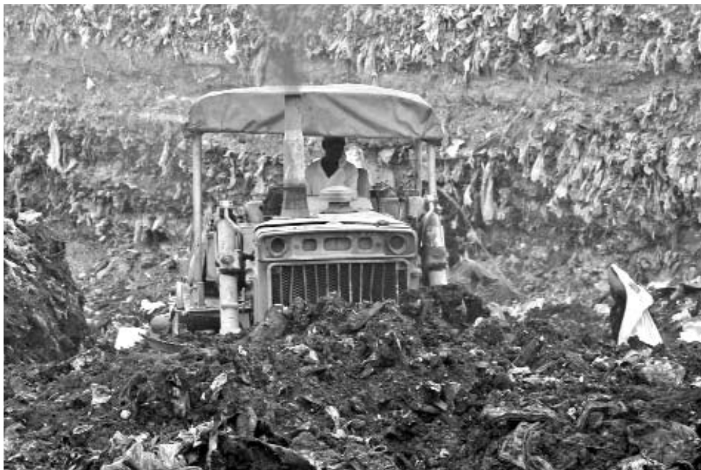
La excavación de trincheras en las áreas ya utilizadas de los vertederos contribuye a prolongar su vida útil.

En el 2004 nuestro país inició un proyecto con la Agencia de Cooperación Internacional de Japón (JICA), como parte del cual se diagnosticaron entonces las principales problemáticas medioambientales derivadas del