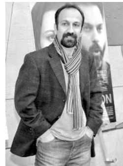
Asghar Farhadi, uno de los más importantes cineastas iraníes.

El sabor de las cerezas , del reconocido realizador Abbas Kiarostami es otra de las perlas de la selección. Galardonada en 2009 con los premios al mejor director en el Festival de Berlín y a la Mejor Película en el Festival de Tribeca, la cinta resultó un acontecimiento cinematográfico cuando tuvo su estreno, y aborda la sorprendente historia de un hombre decidido a suicidarse que busca ayuda para