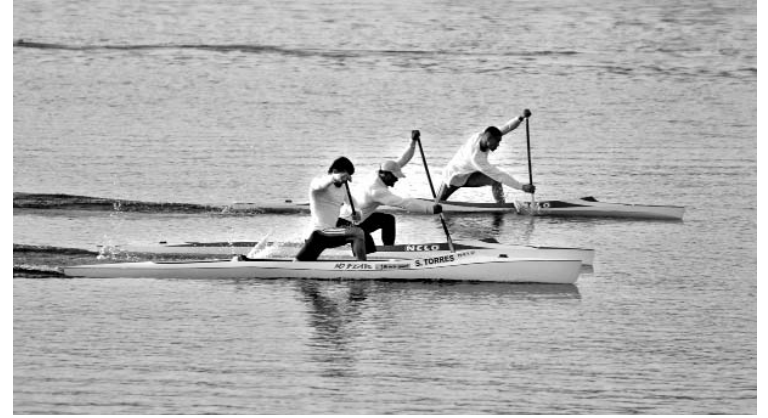
La rivalidad entre consagrados y noveles contribuye a la buena salud de la canoa cubana.

En el K-1 García hizo valer la resistencia, su principal virtud, para imponerse con 3:32.23 minutos, inferior al 3:34.32 del santiaguero Reinier Torres, su principal rival de casa, y el