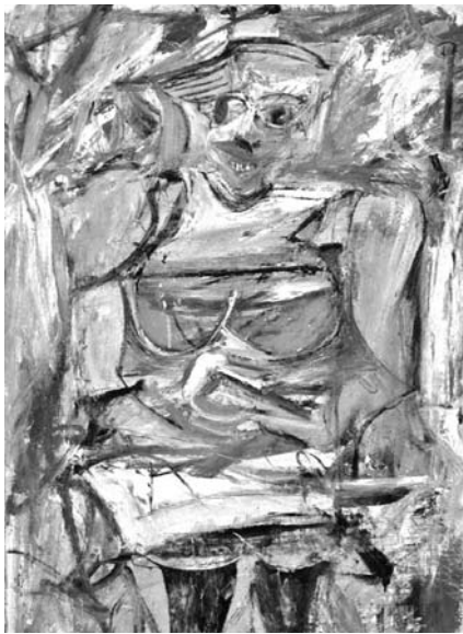
Woman V , pintura de Willem de Kooning (1904-1997), artista norteamericano de origen holandés.