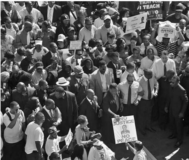
El caso Martin desató una ola de movilizaciones de la comunidad negra estadounidense.

En tanto, el padre de la víctima, Tracy Martin, señaló: “Nuestro hijo no merecía morir.