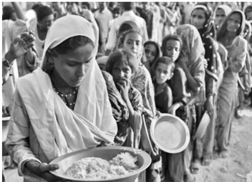
(Tomado de Rebelión)

Acumulativamente, estos cambios —a lo largo del tiempo— apenas triplicaron la productividad de la tierra, aunque requirieron bastante menos personas ocupadas. Una evolución tan lenta hizo que hubiera desfases importantes entre oferta y demanda de alimentos. La crisis más seria —aunque de ninguna manera la única— se produjo en el siglo XIV, donde el hambre y luego las pestes asociadas redujeron la población europea en un 50 %, llevándola a los niveles del siglo X.