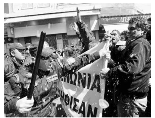
La policía arremetió contra manifestantes que protestaban contra los recortes del Gobierno.

Las medidas, que incluyen grandes recortes a sueldos y pensiones, han ayudado a sumir la economía