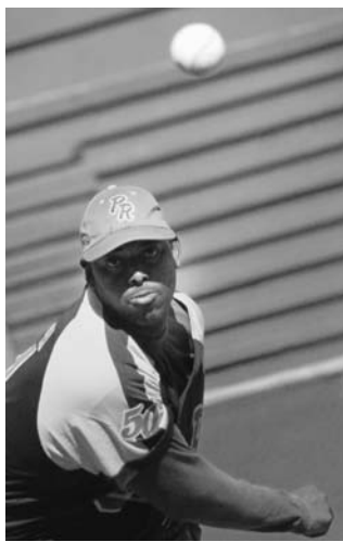
Casanova dejó a las Avispas en blanco.

Por último, los Ganaderos agramontinos superaron a los Metros en el primer juego de una subserie que ha sido trasladada para el Severino Méndez, de Bauta. Menos una, todas las carreras fueron producto de jonrones, el de Alexander Ayala para clavar la puntilla en el noveno. Vicyohandri permitió tres sucias en siete entradas. A partir de hoy no habrá transmisiones televisivas de la 51 Serie, las que se reanudarán el viernes.