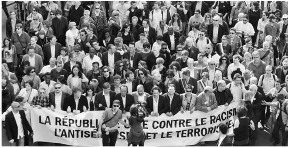
La mayor manifestación tuvo lugar en la capital.

Un sismo se sintió en la región centro sur de Chile con una magnitud preliminar de 7,2, según el Servicio Geológico de Estados Unidos. La Oficina Nacional de Emergencia dispuso una evacuación preventiva en las zonas costeras y no han informado de víctimas ni daños por el momento, aunque en muchas ciudades se vivieron escenas de pánico. El epicentro se ubicó frente a las costas del Maule, a 32 kilómetros al noroeste de Talca. (AP)