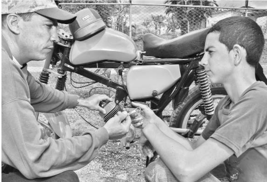
Un padre atento al desarrollo docente de su hijo.