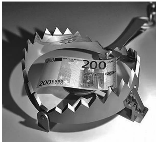
Los nuevos recortes, lejos de evitar, podrían agravar la recesión que se aproxima.

Durante el pleno del Congreso en el que se aprobó el techo de gasto para los Presupuestos Generales del Estado, Montoro aseguró que la nueva reducción se llevará a cabo a través de "renuncias a proyectos de gastos" e "instrumentos fiscales equilibrados", informó El País.