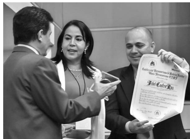
El Ministro de Salud Pública recibió el reconocimiento otorgado a Fidel, por la creación del programa del médico y la enfermera de la familia.

Ubicada en uno de los tramos más antiguos del ferrocarril cubano (Sancti Spíritus-Tunas de Zaza), la estación de Guasimal fue construida originalmente hacia 1864, incendiada por fuerzas mambisas hacia 1868, reconstruida años más tarde y hacia 1920 reformada con la estructura que tuvo hasta hoy.