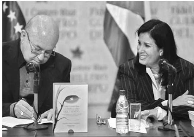
Katiuska Blanco y Miguel Barnet durante la presentación del libro.

También el vicepresidente agradeció al pueblo cubano, especialmente a Raúl y a Fidel, por cuidar “muy bien” del presidente venezolano, Hugo Chávez, quien se encuentra recuperándose satisfactoriamente de una intervención quirúrgica en la Isla antillana.