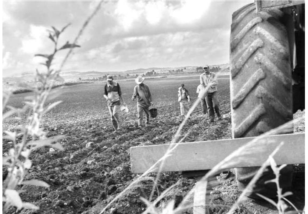
La CCS dedica unas 30 caballerías al cultivo del frijol.

Los ciclos son de 90 días. Es preciso sembrar religiosamente en septiembre, de