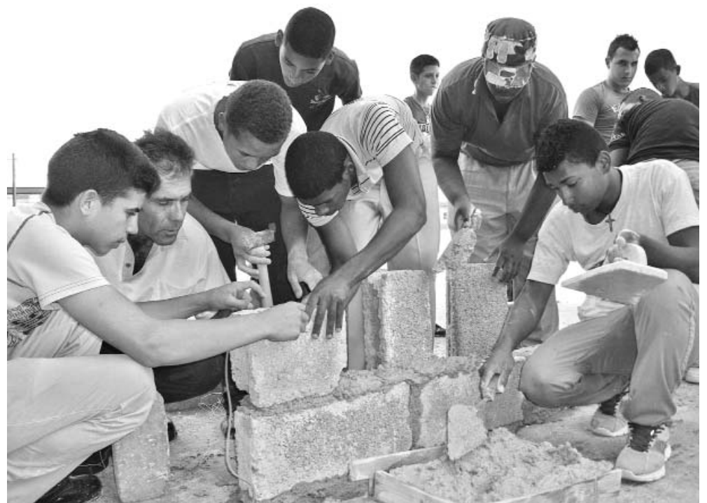
Los estudiantes de Obrero Calificado en Albañilería, durante sus prácticas en el taller polivalente del centro.