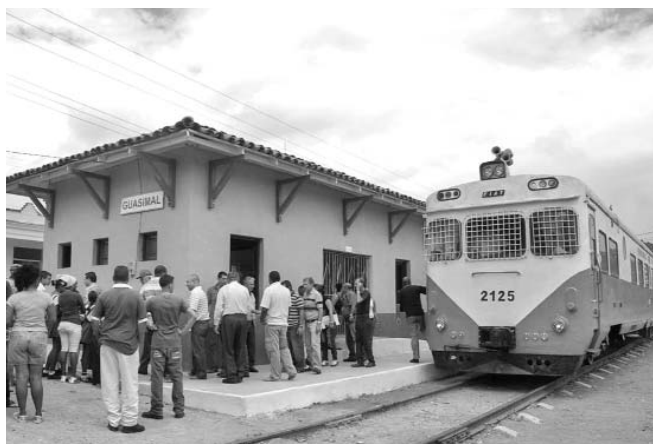
En Guasimal los trabajos fueron asumidos por la Empresa Constructora del Poder Popular y por el grupo VIAMAC, del MITRANS.

La reapertura de Guasimal, convertida la víspera en