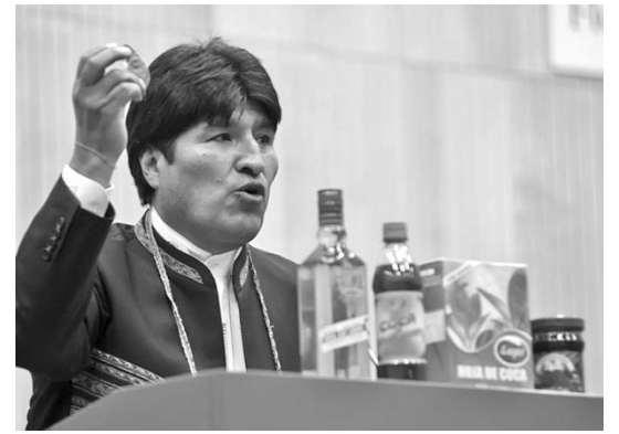
El mandatario destacó el uso de esta planta con fines medicinales y para producir refrescos, mermeladas, té y licor.

Según PL, el incidente del domingo desató otra jornada de protestas antiestadounidenses en la República islámica, un mes después de las violentas