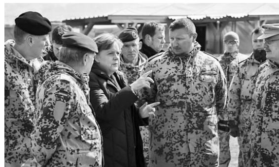
Merkel de visita en Afganistán.

WASHINGTON, 12 de marzo.—El Pentágono puso hoy a todas sus bases militares en Afganistán en situación de máxima alerta, después de que grupos talibanes prometieran vengarse por la matanza de 17 civiles en la provincia de Kandahar, a manos de un sargento norteamericano, indica El País.