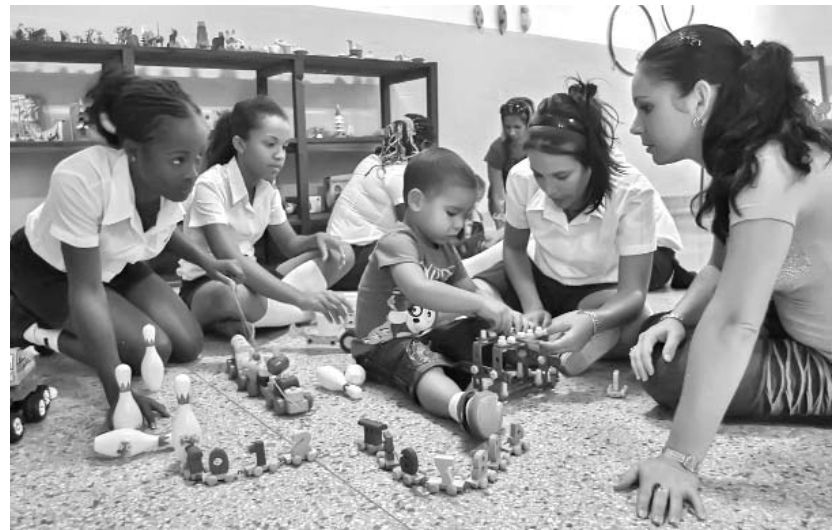
Los estudiantes aprenden a dirigir y orientar el juego como actividad esencial en la etapa preescolar.