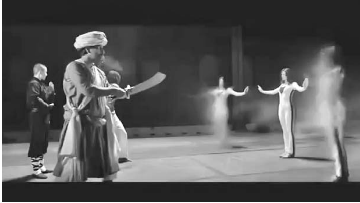
En el video una mujer blanca, que representa a Europa, calma a enemigos externos.