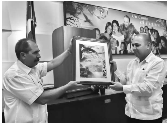
El ministro Roberto Morales recibe el diploma conferido a Fidel.