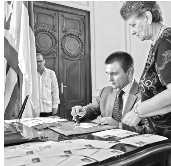
El viceministro de Relaciones Exteriores de Ucrania, Pavlo Klimkin, cancela el sello que reproduce una imagen publicada en Granma el 30 de marzo de 1990.

El diplomático cubano agregó que no hay mejor símbolo para presentar la cancelación de este sello que la his-