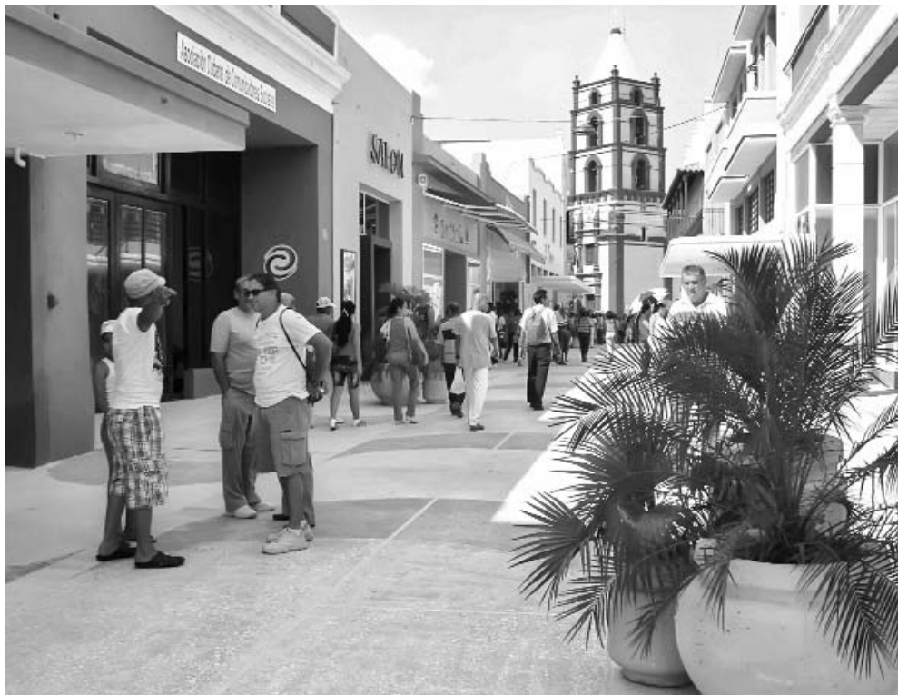
El Paseo de la Calle Maceo demostró cuánto puede hacerse cuando se unen voluntades en un propósito común.

Tenemos deudas importantes, como la Casa Natal de El Mayor, la Casa Quinta Amalia Simoni y el Museo Provincial. No puede hablarse de una acción integral si esa ruta no está