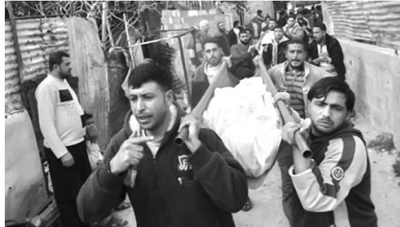
Israel ha matado al menos 25 palestinos desde el viernes.