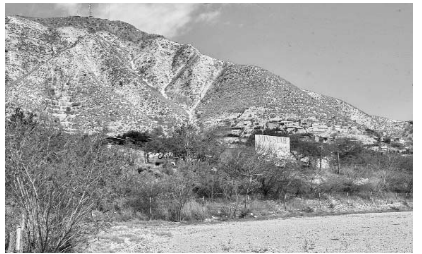
Las reservas forestales haitianas desaparecen a una tasa de 15 millones a 20 millones de árboles por año.

AMELIA DUARTE DE LA ROSA, enviada especial