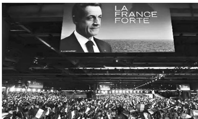
En el acto proselitista, Sarkozy amenazó con retirar al país de los acuerdos Schengen, sobre la libre circulación en la UE.

Para Pierre Moscovici, director de campaña de Hollande, los propósitos de Sarkozy son más bien dignos de "un primer ministro británico conserva-