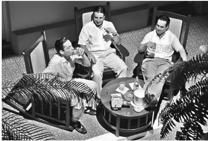
La ciudad perdida: cine perdido.

Mejor aproximación a una verdad descontaminada obtendría el actor cubano-norteamericano sumando hechos incontrastables como estos: en el mismísimo Miami no fueron pocos los que vieron La ciudad perdida como una vergüenza artística y a la crítica no le quedó más remedio que (en términos diversos) hacerla añicos. Solo los terroristas y sus adláteres tuvieron palabras de encomio en esa ciudad y ya se podrá imaginar atendiendo a qué factores. La crítica norteamericana y mundial, en su totalidad, la hizo papillas y prestigiosos festivales del mundo se negaron a exhibirla alegando que,