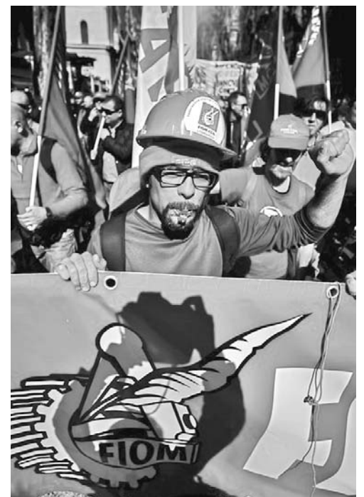
Manifestantes del sindicato de la metalurgia.

Reyes expresó la solidaridad de Cuba con el pueblo libio y demandó que se respete plenamente el ejercicio de su derecho a la independencia y la libre determinación, a la soberanía sobre sus recursos naturales y a la integridad de su territorio. (PL)