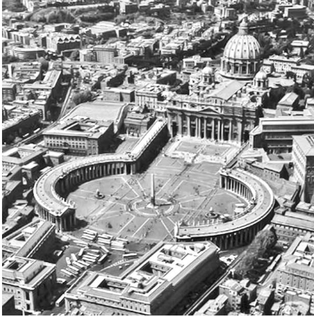
Plaza de san Pedro, en el Vaticano.

El Estado de la Ciudad del Vaticano surgió en 1929, tras la firma del Tratado de Letrán entre la Santa Sede y el entonces Reino de Italia, que en 1870 había conquistado los Estados Pontificios,