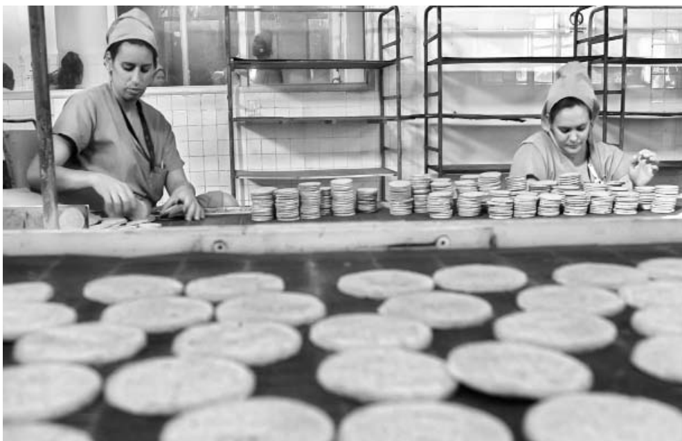
Las galletas fortalecidas de trigo Aurora son acogidas con agrado por la población.