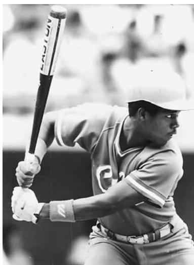
Omar Linares, el primer jonronero líder de bateo.

Se trata, por supuesto, de dos peloteros extraclase. Entre los 15 primeros de mejor promedio al bate en la presente contien-