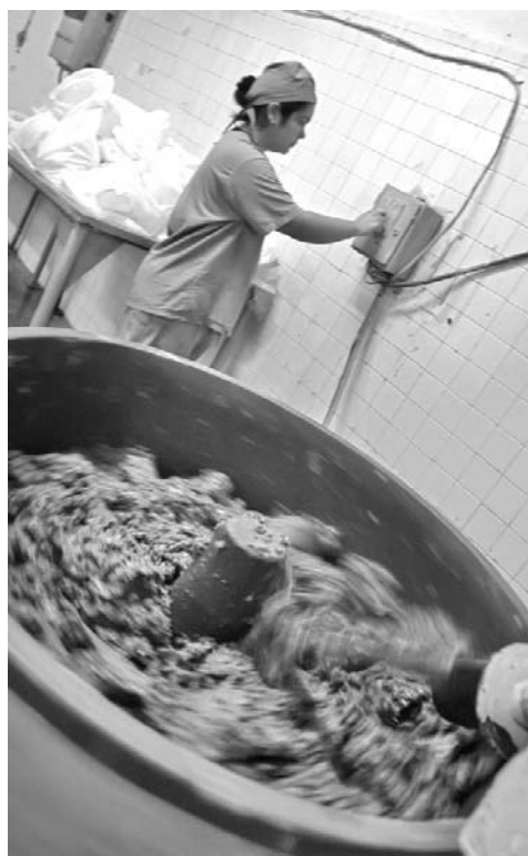
En el centro también se elaboran productos cárnicos que venden a varios organismos de la capital.