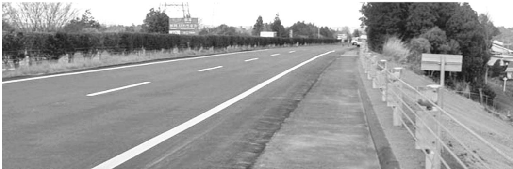
En poco tiempo los japoneses lograron remozar 300 kilómetros de la autopista Tokohu, que conecta a Tokio con las zonas dañadas.