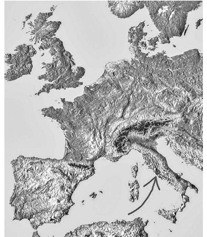
La flecha indica la ubicación del Vaticano dentro de Italia.

También forma parte de varias organizaciones internacionales, tales como el Organismo Internacional de Energía Atómica (OIEA), la Organización para la Seguridad y la Cooperación en Europa