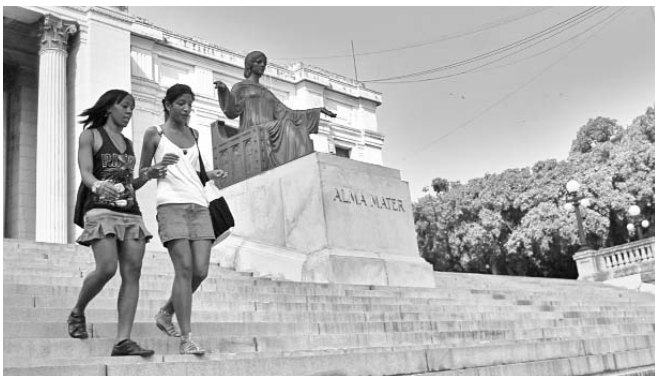
La cita acogerá a más de 2 300 delegados extranjeros y alrededor de 800 cubanos.