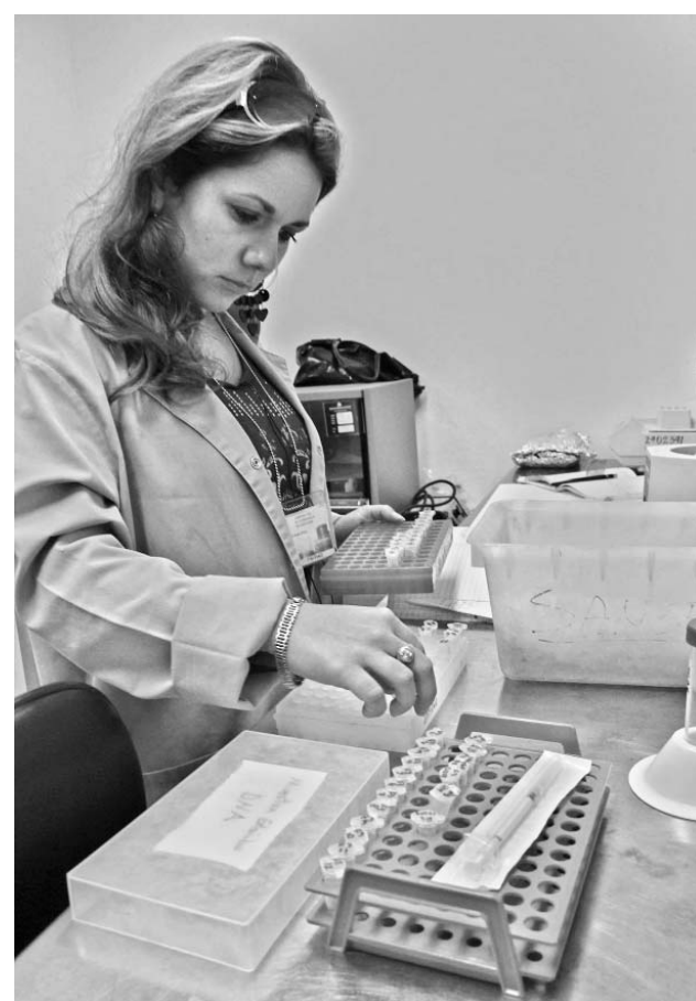
El sentido de compromiso con la sociedad explica la consagración del colectivo de trabajadores, cuya edad promedio es de 35 años.

De lograr los resultados esperados, enfatizó, podríamos obtener su registro en el transcurso del 2012 y Cuba dispondría así de dos vacunas, que junto al anticuerpo monoclonal NIMOTUZUMAB-R3, y otros productos, propiciaría el diseño de combinaciones terapéuticas más eficaces contra esta enfermedad que ya es la primera causa de muerte en diez provincias del territorio nacional.