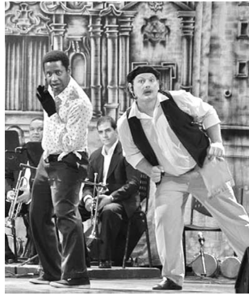
En Reír es cosa muy seria , la crítica reconoció los más altos valores de la escena humorística nacional.