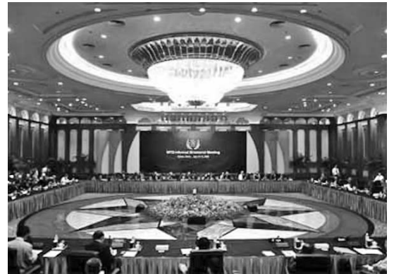
Una vista de la sesión de la OMC.

Ese mecanismo estadounidense crea obstáculos a las inversiones extranjeras en la Isla, asociadas a la comercializa-