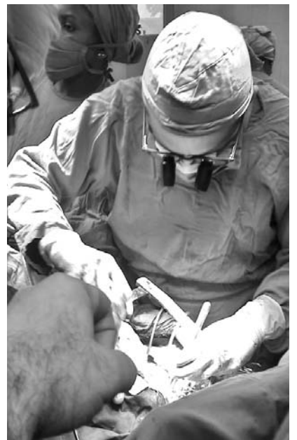
Una valiosa experiencia en operaciones de disección de aorta acumula el centro.

En sentido general asume todo tipo de cirugía en adultos, salvo trasplantes cardiacos, y en la pediátrica las operaciones con cirugía cerrada en niños de 6 meses en adelante, y las de corazón abierto (con circulación extracorpórea), a partir de los 15 kilogramos de peso.