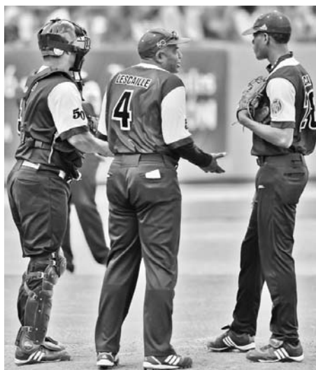
Los Indios están por ajustar la maquinaria.

Desde hace unos días corregimos el tiro y adecuamos el entrenamiento a las características de nuestros hombres. Ya en la subserie con Ciego de Ávila (excepto el choque en que lanzó Vladimir García) la ofensiva se vio mejor, asevera Agustín Lescaille y añade: “Todos los equipos, de cualquier deporte, tienen un mal momento y por ese está pasando el nuestro. Lo mejor es que ha sido al princi-