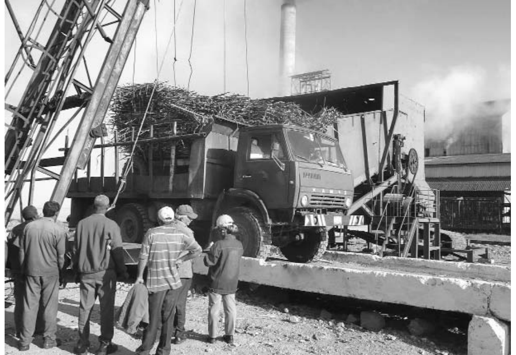
Con la entrega de caña fresca troceada y desfibrada, la mesa alimentadora asegura un 0,5 % adicional de rendimiento.

En su reciente visita, el Primer Vicepresidente de los Consejos de Estado y de Ministros planteó que ahora el problema estaba en la producción cañera, cuyos rendimientos agrícolas de 43 toneladas por hectárea, imponen sembrar más caña y brin-