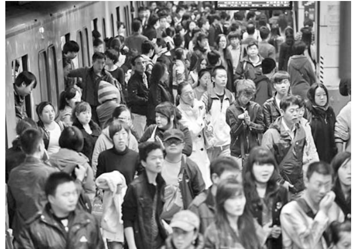
La acelerada urbanización del gigante asiático está relacionada con el desarrollo económico de la nación.

El comisario del Buró de Estadísticas, Ma Jiantang, subrayó al publicarse los datos anuales, que en el 2011, "frente a un ambiente internacional complicado y volátil", China tomó medidas macroeconómicas que "lograron un buen comienzo para el Plan Quinquenal 2011-2015".