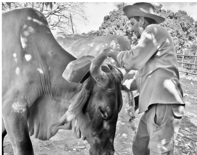
Obdulio considera que debe promoverse entre los jóvenes el oficio de boyero.

Al cerrar el 2011 laboraban en diferentes faenas solo 4 446 animales, con el grueso ubicado en las cooperativas. Estos prepararon 21 029 hectáreas, cultivaron 93 152 y transportaron 337 000 toneladas de productos, resultado que debe incrementarse en los próximos años.