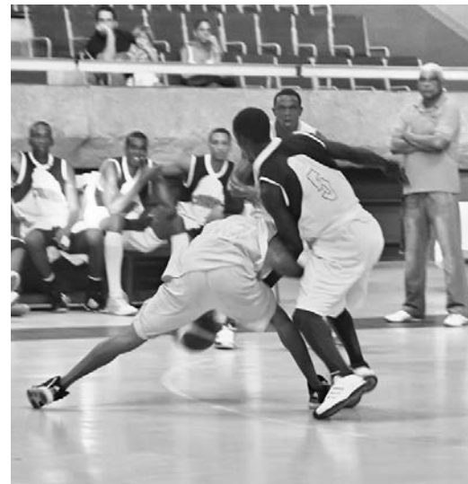
Como visitante, Capitalinos logró un cómodo triunfo.

Recordemos que ambos elencos se enfrentaron en la sala capitalina Ramón Fonst los días 12 y 14 de noviembre durante la