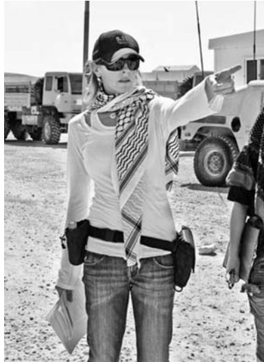
La Bigelow, una directora que simpatiza con los héroes invasores.

La noticia difundida refiere que tal medida responde a una solicitud, en agosto pasado, del republicano Peter King, presidente del Comité de Seguridad Nacional del Congreso, quien preocupado por una supuesta filtración de alto nivel, pidió investigar si el Gobierno de Barack Obama le había soltado prenda bajo el tapete a la Pictures, al periodista y guionista Mark Boal y a la directora Kathryn Bigelow, ganadora del Oscar por Tierra hostil , un drama bélico recreado