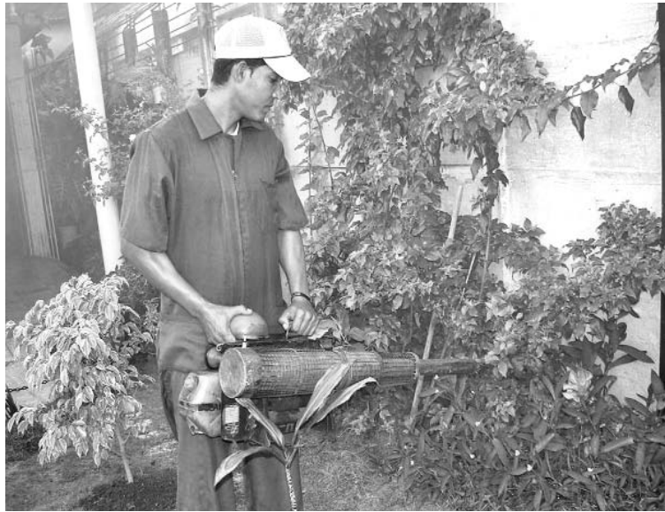
La fumigación se incrementa en las áreas perjudicadas.

Una puerta clausurada entraña posponer o duplicar la radiobatida en la manzana, con el consiguiente gasto de recursos, agrega.