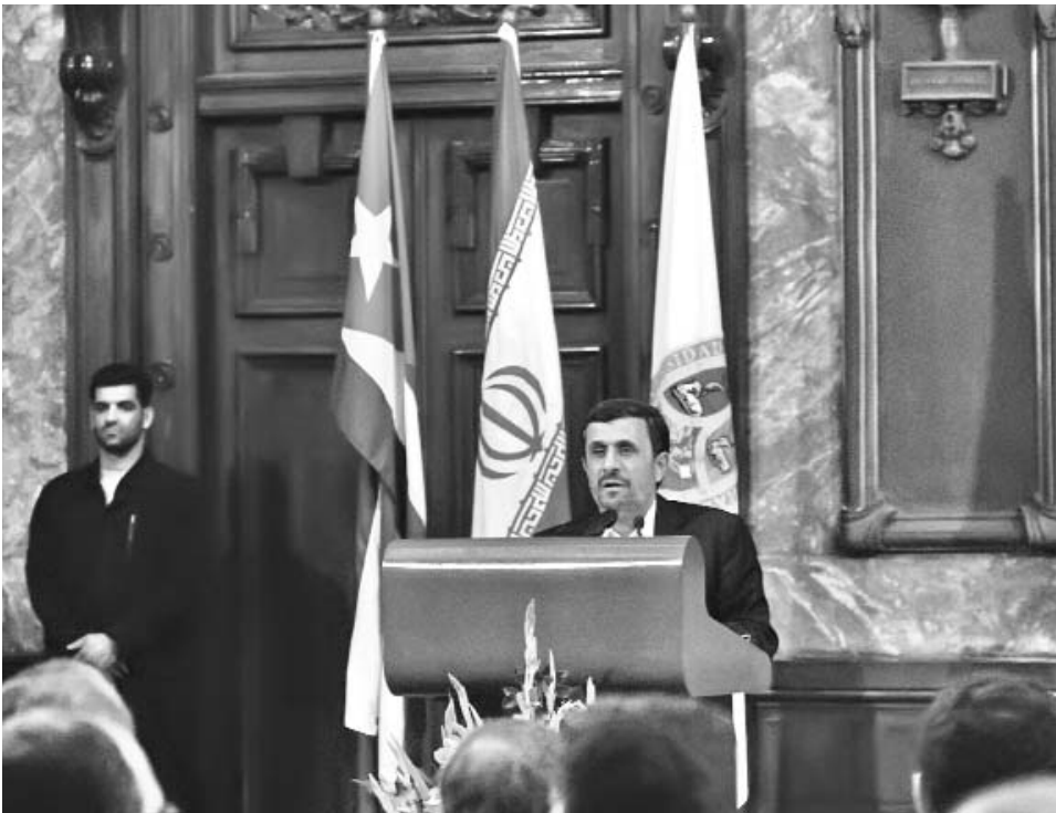
El mandatario iraní condenó al sistema capitalista.