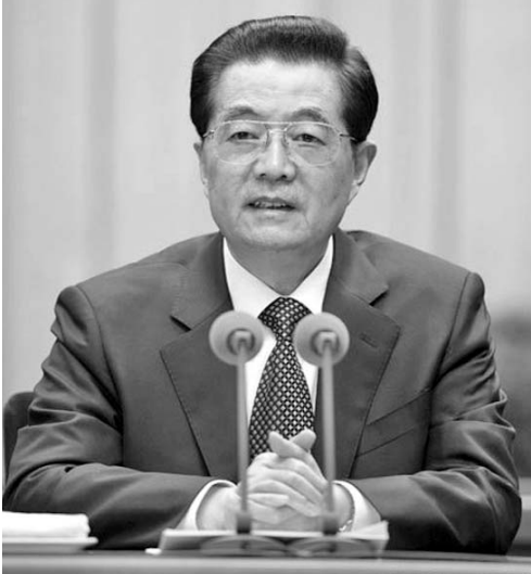
El mandatario llamó a intensificar la lucha contra la corrupción.

de todos los niveles que cumplan bien sus obligaciones y que tengan papeles ejemplares para mantener la pureza del Partido. He Guoqiang, director del CCCC, presidió la reunión. Llamó a todos los miembros del Partido a que aprendan e implementen el discurso que pronunció el Presidente en la sesión y dar la bienvenida a la próxima XVIII Asamblea Nacional del PCCh con nuevos logros en el trabajo contra la corrupción y mejorando el estilo de trabajo e integridad del Partido. A la reunión también asistieron otros líderes del PCCh, incluidos Wu Bangguo, Wen Jiabao, Jia Qinglin, Li Changchun, Xi Jinping, Li Keqiang y Zhou Yongkang. (Diario del Pueblo)