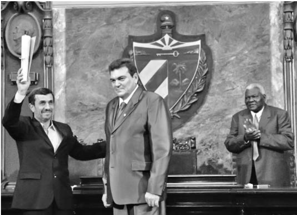
Ahmadinejad recibió el título de Doctor Honoris Causa en Ciencias Políticas que otorga la Universidad de La Habana.