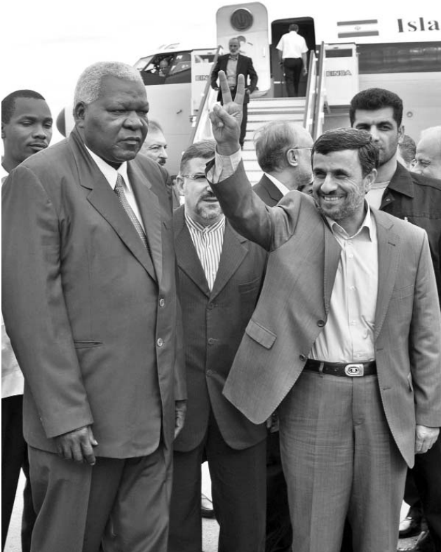
A su llegada a Cuba fue recibido por el vicepresidente del Consejo de Estado Esteban Lazo Hernández.

Por eso, reclamó un nuevo orden mundial basado en la justicia y que respete a todos los seres humanos, y