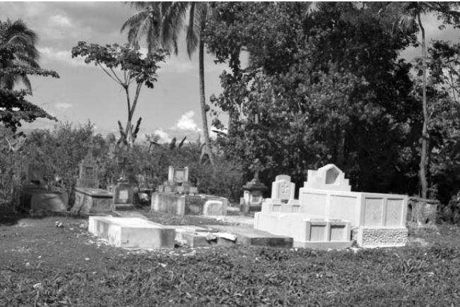
Es una costumbre generalizada ubicar las tumbas al costado de la carretera y al lado de las casas.

EL CULTO a la muerte y las formas de enfrentarla han sido, durante siglos, elementos idiosincráticos de numerosas culturas del mundo. La creencia de una vida después del último suspiro físico ha motivado en el hombre distintas conductas psicológicas y sociológicas que han variado según el contexto, la época y la religión. De ahí que muchos rituales funerarios, estrechamente relacionados con la negación de la muerte y tan antiguos como el ser humano mismo, se preocupen por el destino o la permanencia del espíritu. En Haití, por ejemplo, la muerte no se considera el final de la vida. Para sus habitantes la idea de inmortalidad viene fundamentada mayormente en los preceptos de la religión vudú, que practica alrededor de dos tercios de la población. Conocido como el país de los muertos vivientes debido a las historias de zombies, mito legendario del vudú que Hollywood popularizó y desnaturalizó de su esencia real, el pueblo rinde homenaje y culto a sus muertos de una manera peculiar. A lo largo de toda la nación existen miles de cementerios con similares características constructivas. Fortificados prácticamente al estilo medieval, los camposantos están delimitados por gruesos muros que guardan celosamente los cadáveres que ahí descansan. No obstante, fuera de la capital, es común también encontrar las tumbas a campo abierto y en los patios, a pocos metros de la casa.