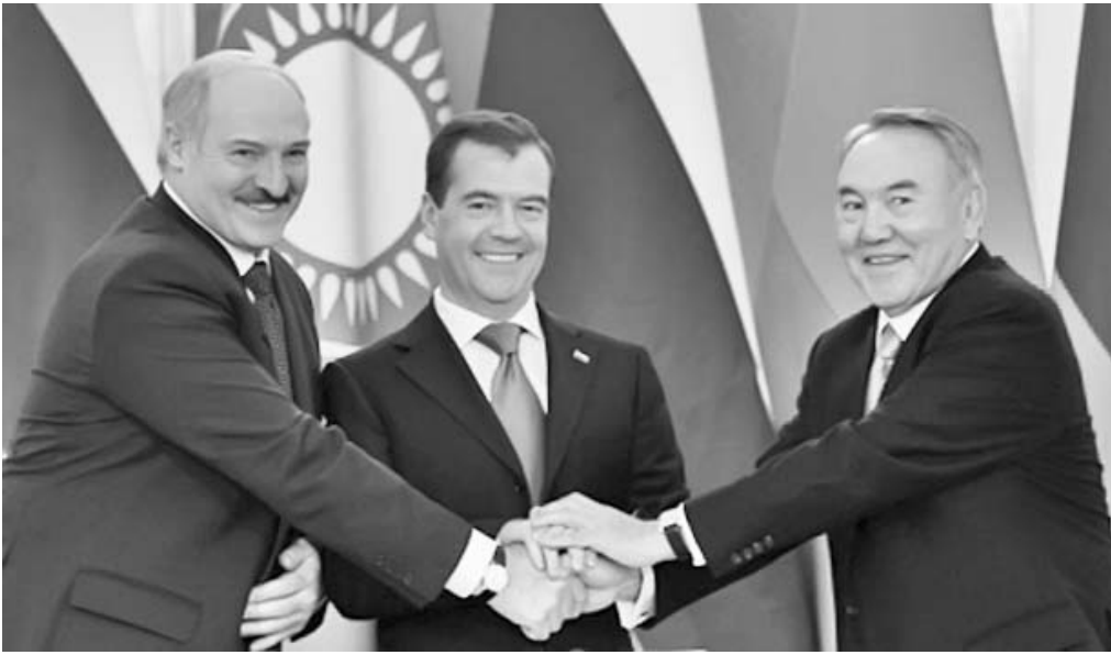
Los presidentes de Belarús, Aleksander Lukashenko, de Rusia, Dimitri Medvedev, y de Kazajstán, Nursultán Nazarbayev, celebran la firma de los tratados de integración.