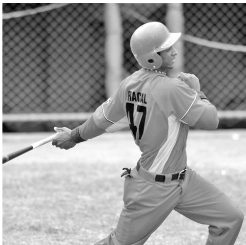
El batazo de Gracial sacó del juego a los Gallos.

Los campeones nacionales emparejaron su récord de victorias y derrotas, 6 y 6, al doblegar a los Alazanes granmenses desde el primer capítulo, cuando fabricaron siete carreras, cuatro de