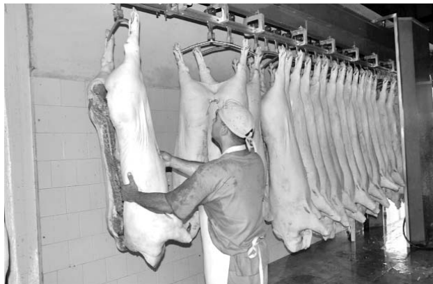
Del total de la producción, más de 8 700 toneladas son entregadas al balance cárnico a través del MINAL.

La mayor parte de esa suma —8 758 toneladas— ha sido comercializada con el Ministerio de la Industria Alimentaria (MINAL), que con la terminación de un nuevo matadero también ha redimensionado sus capacidades en Sancti Spiritus,