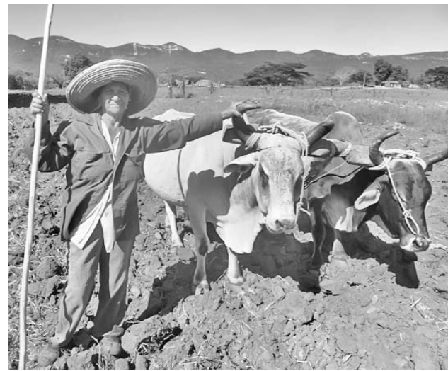
En esta zona agrícola de 1 834 hectáreas las yuntas garantizan más del 80 % de la preparación de tierra.