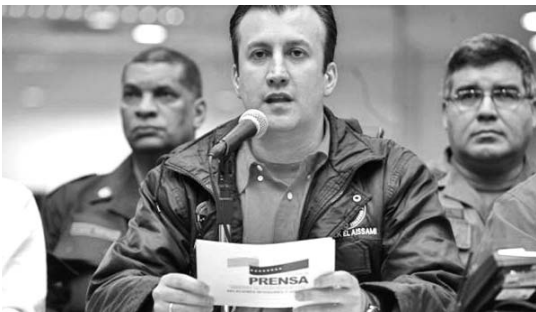
Zulia es la región más afectada, puntualizó el titular.

CARACAS, 9 de diciembre.—El ministro de Relaciones Exteriores y Justicia de Venezuela, Tareck el Aissami, anunció hoy que el Gobierno otorgará asistencia económica a los ciudadanos damnificados de toda la nación debido a las lluvias, refiere PL.