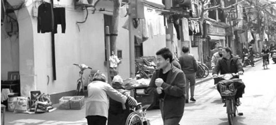
China redujo a la mitad su población rural pobre, según fuente oficial.

Hasta julio del presente año, un total de 52 millones de vecinos en los campos de China se habían beneficiado del sistema estatal de pensiones de subsistencia, que proporciona artículos básicos de uso diario, agua y electricidad. Mientras, el proyecto piloto del nuevo tipo de seguro social de vejez —lanzado en el 2009—, se había ampliado al 60 % de las zonas rurales del país.