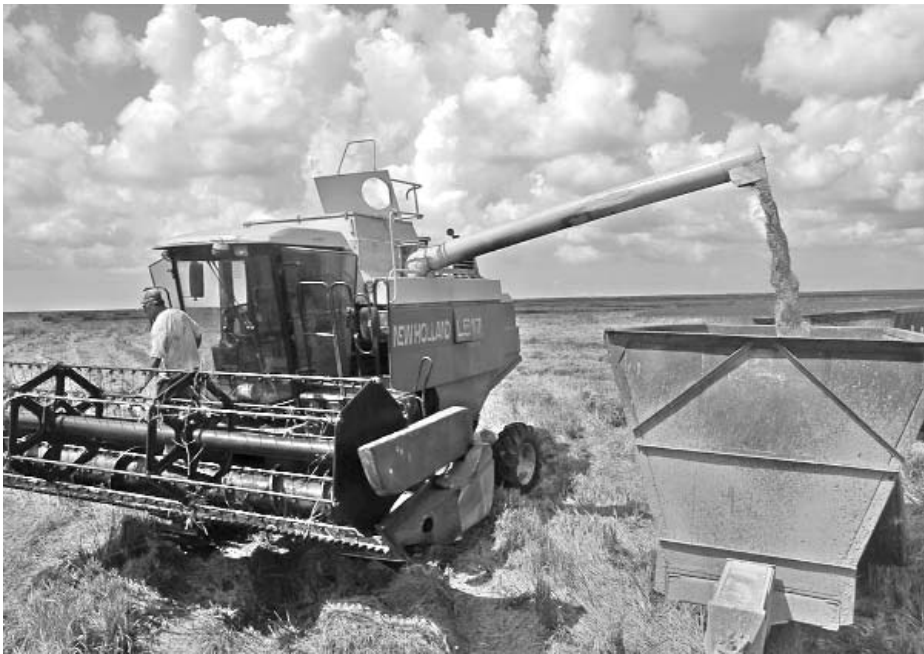
En estos momentos los arrozceros espirituanos mantienen un ritmo diario de cosecha ascendente a 700 toneladas.