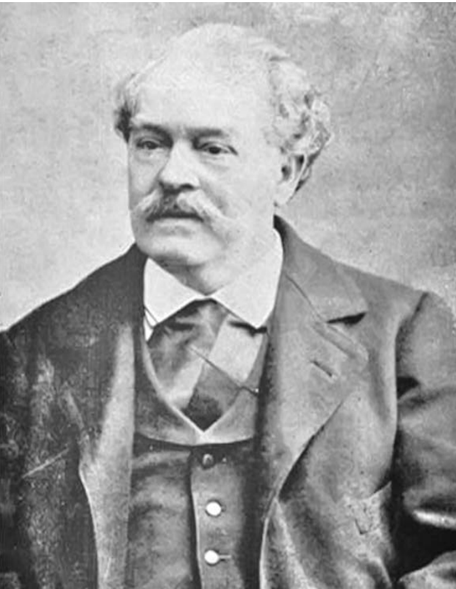
Andrés Poe y Aguirre es considerado el precursor de la meteorología científica en Cuba.

Además de estudiar los ciclones tropicales y otros fenómenos atmosféricos, el centro también incursionó en la astronomía y reportó la ocurrencia de algunos