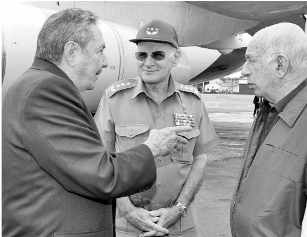
Raúl fue recibido por Machado Ventura y el General de Cuerpo de Ejército Abelardo Colomé Ibarra.

ÓRGANO OFICIAL DEL COMITÉ CENTRAL DEL PARTIDO COMUNISTA DE CUBA