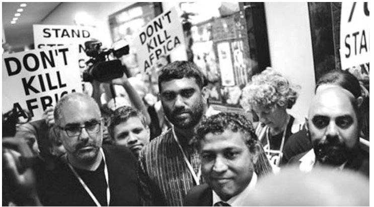
Los manifestantes rechazaron un documento que pondría en peligro la supervivencia del planeta.

El Aissami destacó que la creación de centros de alerta permite monitorear permanentemente quebradas y ríos y atender todos los eventos que se registren.