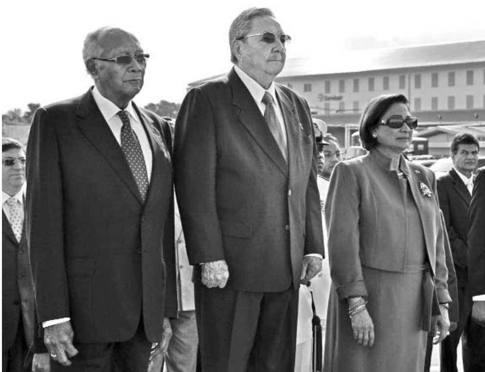
En el aeropuerto internacional Piarco, de la ciudad de Puerto España, acudieron a despedirlo el Presidente trinitario George Maxwell Richards y la Primera Ministra Kamla Persad-Bissessar.