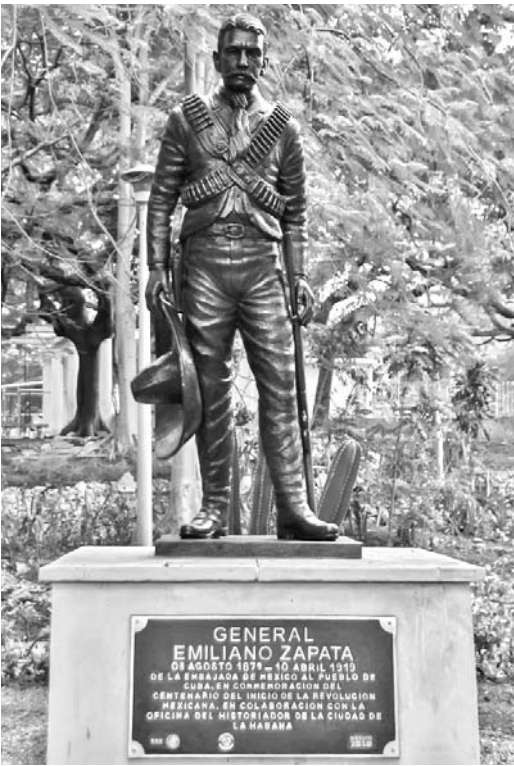
El monumento está ubicado en unos de los principales parques de la céntrica Quinta Avenida.

La obra, del escultor mexicano Germán Leal, fue emplazada en la céntrica Quinta Avenida con la colaboración de la Oficina del Historiador de La Habana. La pieza que existía en su lugar, también dedicada al héroe independentista, fue trasladada a la Casa de México donde acompañará a la imagen de Benito Juárez, también héroe histórico del país azteca.