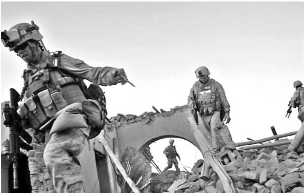
Después de la matanza, las empresas reemplazan a los aviones de combate.

Con ese empeño —y cumpliendo con algunos puntos del XII Plan Quinquenal— Beijing incentiva la educación preescolar y especial en el campo, apoya la construcción de centros docentes bilingües en las zonas étnicas, trabaja en la aplicación de una política de empleo más efectiva, e insiste en la necesidad de poner en práctica programas de ayuda interregional: que el Este auxilie al Oeste, las zonas urbanas asistan a las rurales y las avanzadas a las más atrasadas.