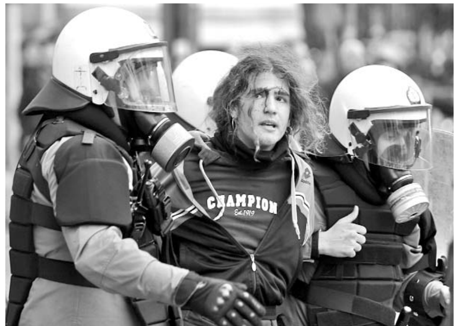
La policía griega reprimió y apresó a varios manifestantes.

En Salónica, la segunda ciudad de Grecia, también tuvo lugar una manifestación que fue cercada por la policía antidisturbios y dispersada tras varios choques entre agentes y manifestantes, reportó EFE.