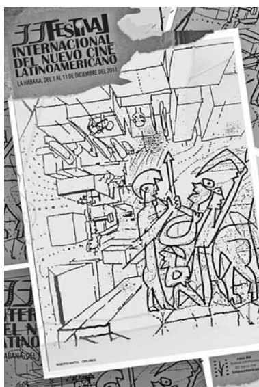
Una obra de Matta en el cartel del 33 Festival del Nuevo Cine Latinoamericano.

El cartel del festival es una prueba fehaciente de ese ofi- cio. Pareciera hecho al des-