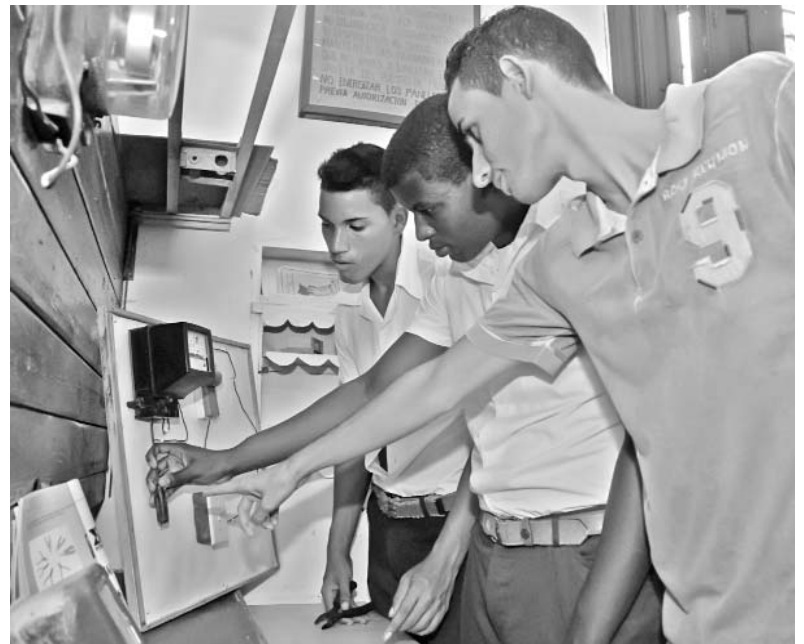
Los jóvenes profesores egresarán preparados para enfrentar la docencia en todos los centros de la ETP.

Para desarrollar sus habilidades, se asegura la base material de estudio a partir de convenios de trabajo con