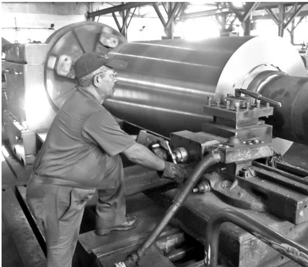
El maquinado de las mazas es la parte más compleja de la fabricación.

"Nos vimos obligados a montar tres turnos de labor (24 horas) en la parte de