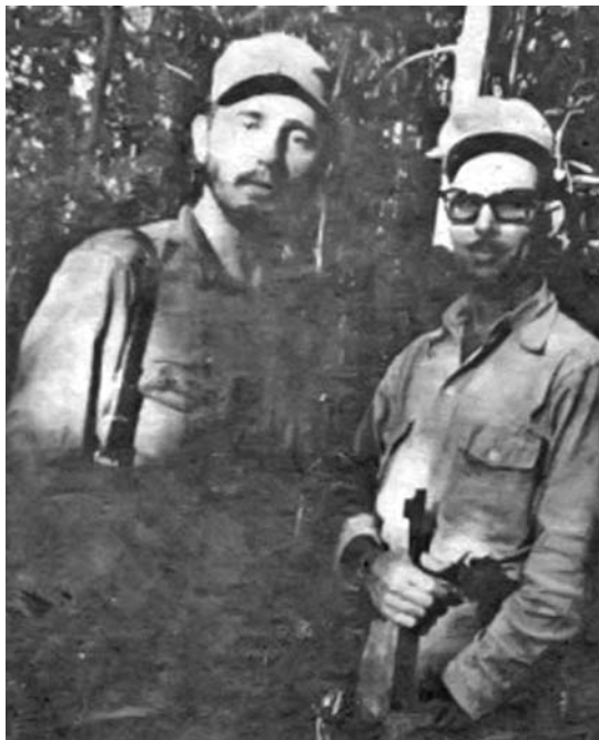
Fidel y Faustino en la Sierra Maestra.

—Tírale cuando esté bien cerca—dice Fidel a Universo. Este apunta su fusil de