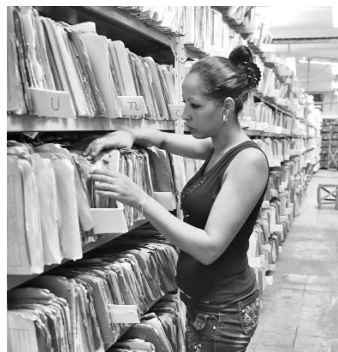
El propietario de un medio de transporte debe dirigirse primero a la sección provincial del Registro de Vehículos de su territorio, pues allí está ubicado el archivo de expedientes de los vehículos.

"Tras formalizar el contrato de compraventa o dona-