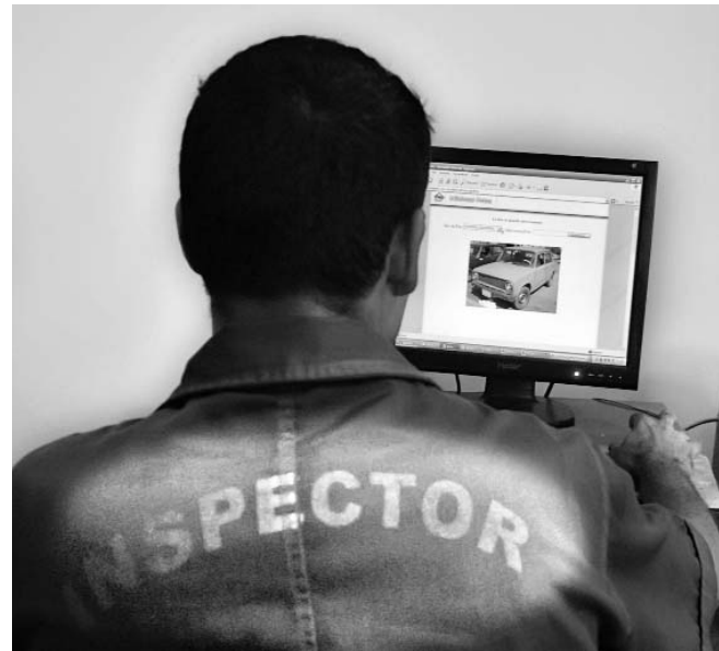
El sistema automatizado facilita el trabajo de los funcionarios y disminuye las posibilidades de error en los trámites.

ción ante el notario, el solicitante debe pagar en el banco un impuesto sobre la transmisión de la propiedad, y luego regresar con esos documentos al Registro de Vehículos para notificar el cambio de propietario. En este paso sí tiene que dirigirse al centro de trámite que le corresponda por su municipio de residencia."