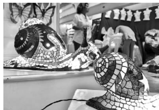
Visitar Pabexpo por estos días es recibir gratas sorpresas artesanales.

En horarios de 11:00 a.m. a 7:00 p.m., los habanero podrán visitar en Pabexpo la Feria, cuyas entradas se venden en la propia sede de