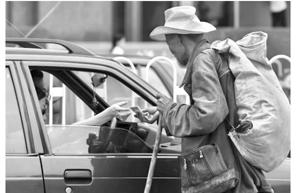
Los ingresos del 10 % más rico son nueve veces mayores que los del 10 % más pobre.

El texto destaca que España y países considerados tradicionalmente iguales, como Alemania, Dinamarca y Suecia, incrementaron la brecha debido a una mayor fractura del mercado laboral.