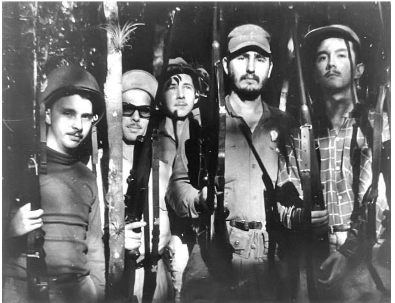
En los primeros días de la Sierra Maestra: Frank País, Faustino Pérez, Raúl y Fidel, y Armando Hart.

Al término de aquella tensa tarde comenzamos a movernos de nuevo, pero las ráfagas y disparos en los alrededores evidenciaban la presencia de tropas enemigas, por lo que decidimos permanecer inmóviles y cubiertos por las hojas secas de la