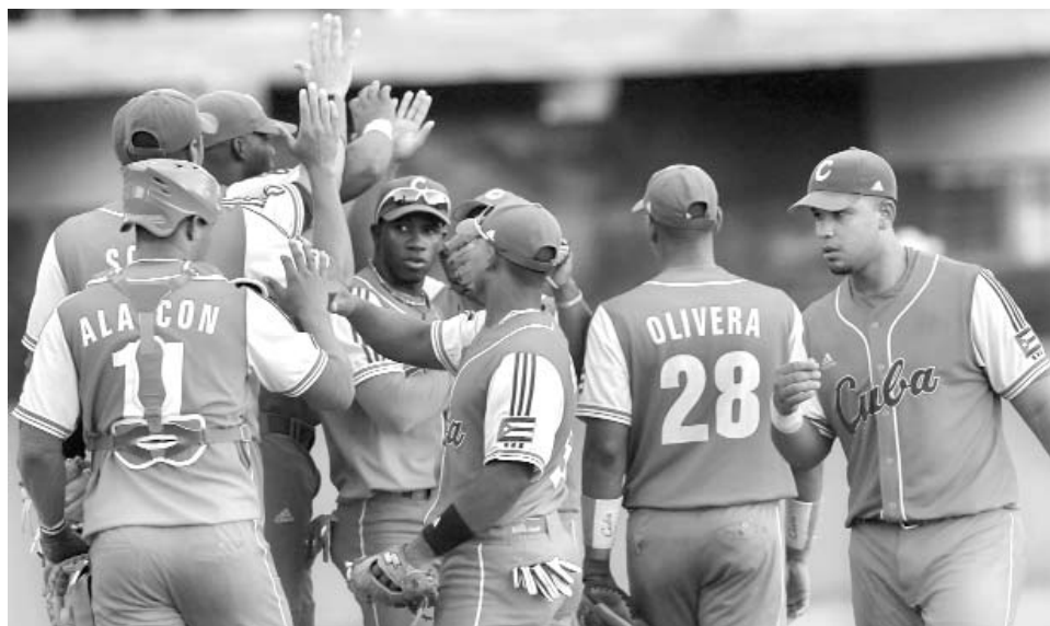
La nómina para el Campeonato del Mundo 2013 tendrá 16 equipos.