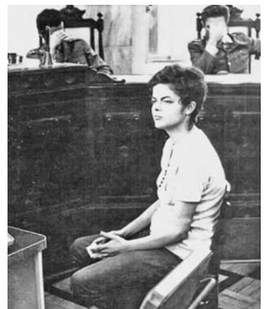
El interrogatorio que refleja la foto tuvo lugar tras 22 días de torturas a la joven revolucionaria.

Durante sus dos años de cárcel se comunicaba con sus compañeras reclusas por medio de mensajes que dejaban en la caja de arena donde hacía sus necesidades un gato que ellas cuidaban en la cárcel. (Tomado de Cubadebate)