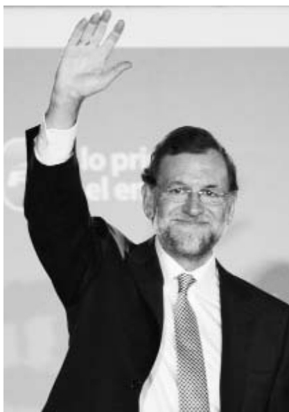
Rajoy gobernará a una España en crisis a partir del 20 de diciembre de este año.

En tanto, Rajoy declaró hoy tras su victoria que España "dejará de ser un problema" en la Unión Eu-