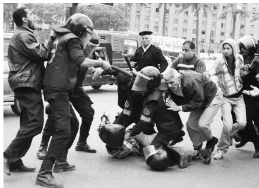
Policías en Egipto reprimen a manifestantes.