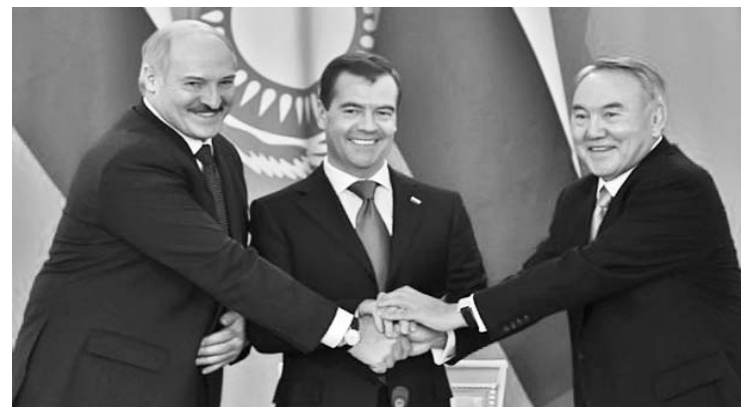
Los mandatarios firmaron un documento para la creación de la Comisión Económica Euroasiática.

Además, funcionará el Consejo Supremo Euroasiático que se reúne a nivel de jefes de Estado y de Gobierno para aprobar documentos como los acuerdos internacionales y la creación de filiales en terceros países y en órganos internacionales.