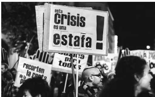
La reflexión y la crítica caracterizarán las jornadas en la Puerta del Sol.

que un edificio ocupado por un grupo de activistas del 15-M fue desalojado por los Mossos de Escuadra. Tras la acción policial varios manifestantes se concentraron a las puertas del edificio ocupado para expresar su rechazo a la operación policial de desalojo.