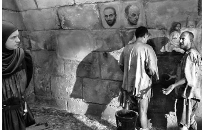
Vinci, de Eduardo del Llano.

Almirante, quien funge como coordinador de la serie, precisó cómo los diez filmes que integran la serie implicaron, no solo un registro documental en los países donde actuaron esas prominentes figuras protagonistas de las gestas libertarias americanas, sino también una reconstrucción ficcional como complemento audiovisual.