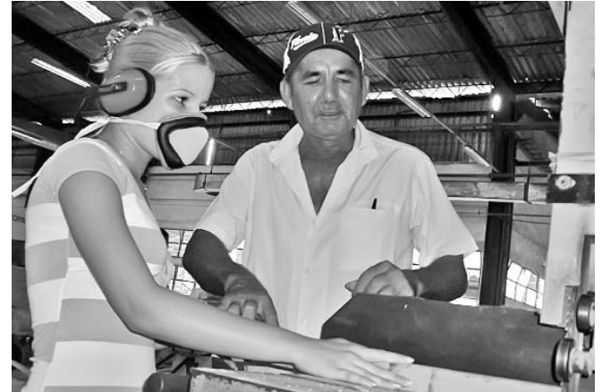
Muchachas se inclinan por oficios como este, relacionado con la elaboración de muebles.