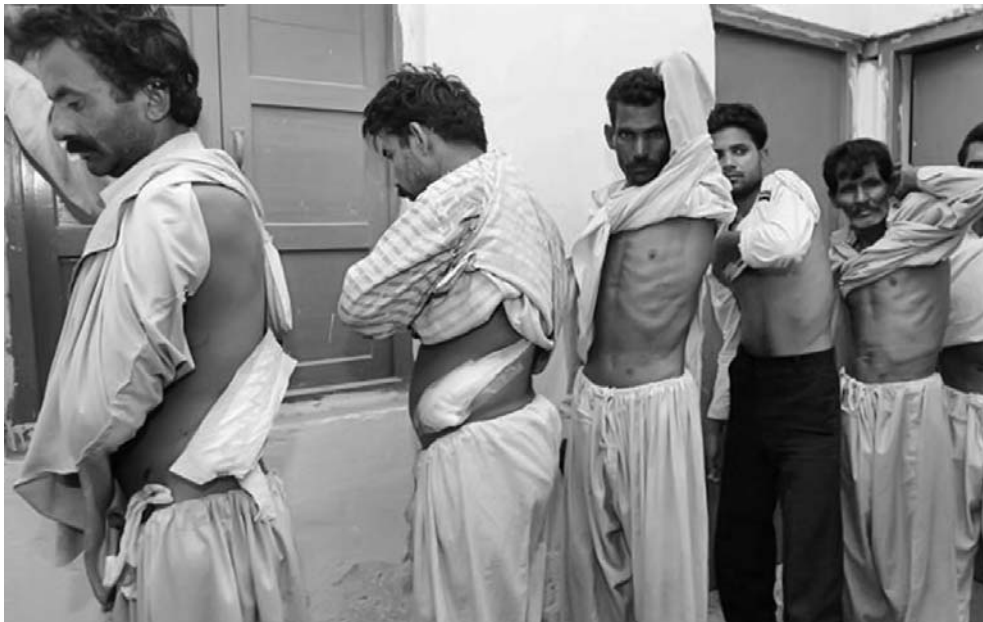
Las personas se convierten en “donantes”, ya sea por necesidad económica o al ser víctimas del crimen organizado.

En los últimos años en el país se ha registrado una creciente demanda de órganos para trasplante, la cual, según Danovitch, es consecuencia de “un tsunami de enfermedades renales causadas por hipertensión, obesidad y diabetes, resultado de nuestros hábitos ali-