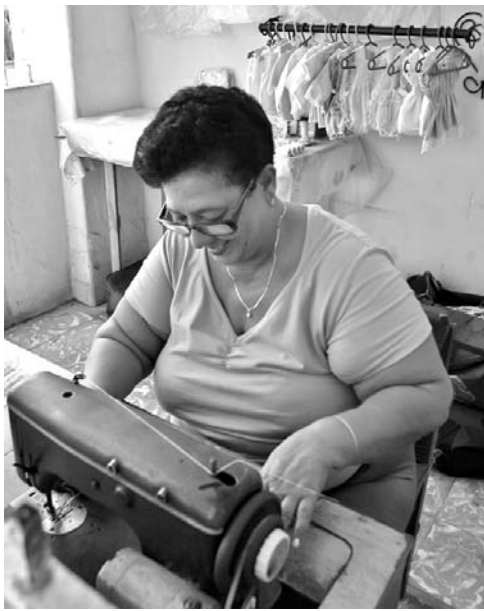
Tras la flexibilización del trabajo por cuenta propia se puede optar por más de una modalidad.

Sin embargo, la reciente inclusión de la figura del organizador de servicios integrales para fiestas de quince, bodas y otras, permitió, a quien brindara esta oferta, prescindir de solicitar las modalidades de alquiler de trajes, maquillista y fotógrafo, independientemente.