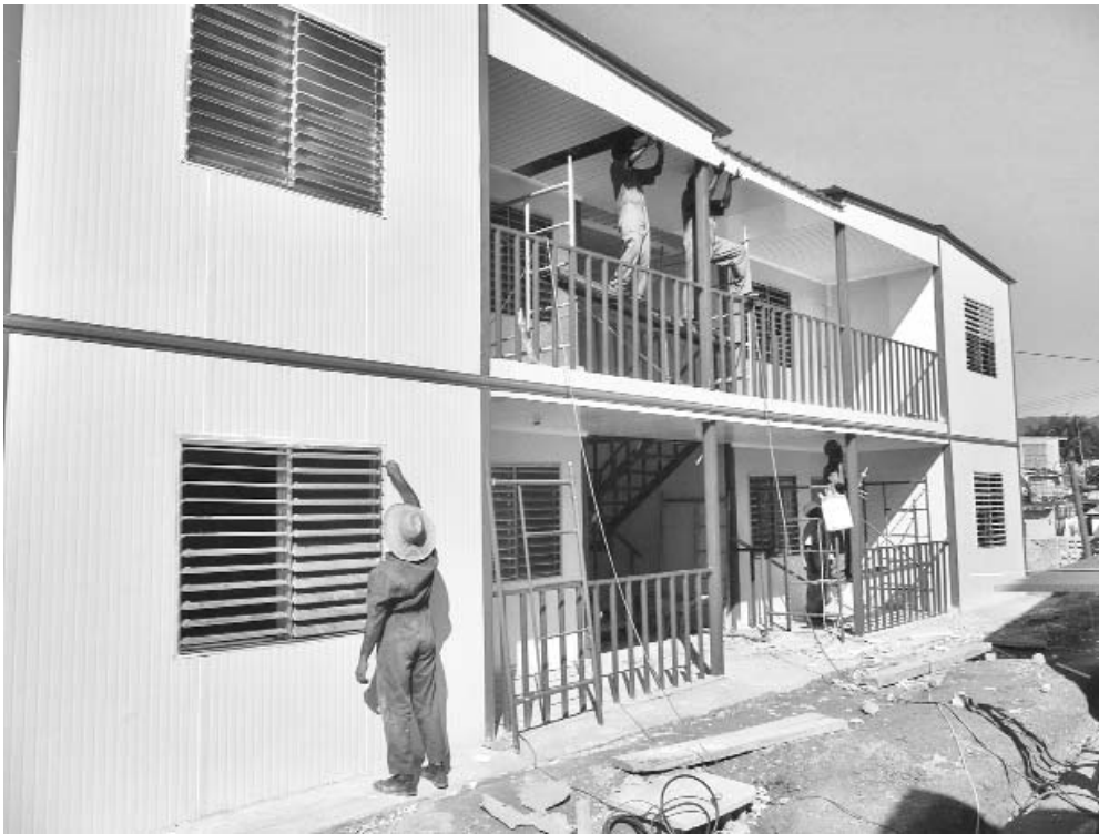
A punto de ser entregados se encuentran los bloques de dos apartamentos edificadas mediante la tecnología Cometal.