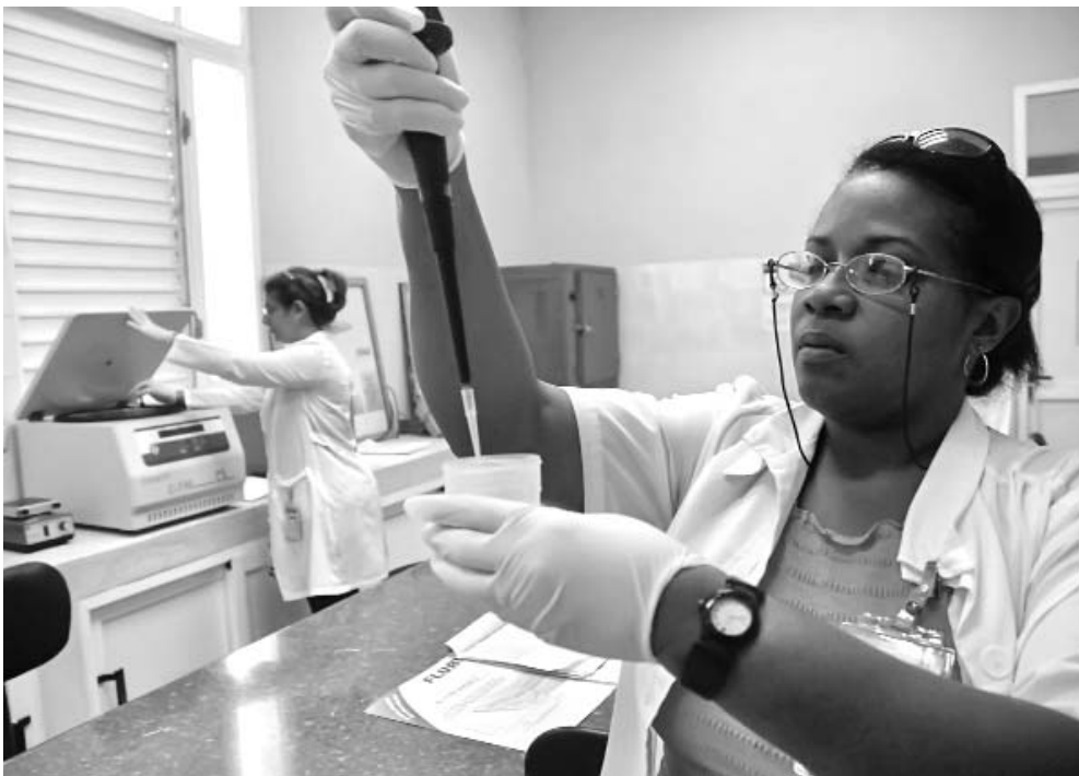
El CENATOX brinda información médica especializada a profesionales de la salud y a la población en general, de manera ininterrumpida las 24 horas del día, todo el año, por los teléfonos 274 3008, 260 1230 y 260 8751.

Este servicio de información nos permite mantener intercambios con los médicos de los centros asistenciales, en cuanto al diagnóstico, tratamiento y evolución del paciente intoxicado, agrega. Igualmente, resulta válido resaltar que en los últimos años ha disminuido la mortalidad por intoxicaciones y ello se debe funda-