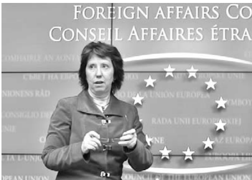
La jefa de la diplomacia de la UE ratificó las presiones contra Teherán.

Desde el 2007, Washington y la UE han impulsado cuatro rondas de sanciones econó-