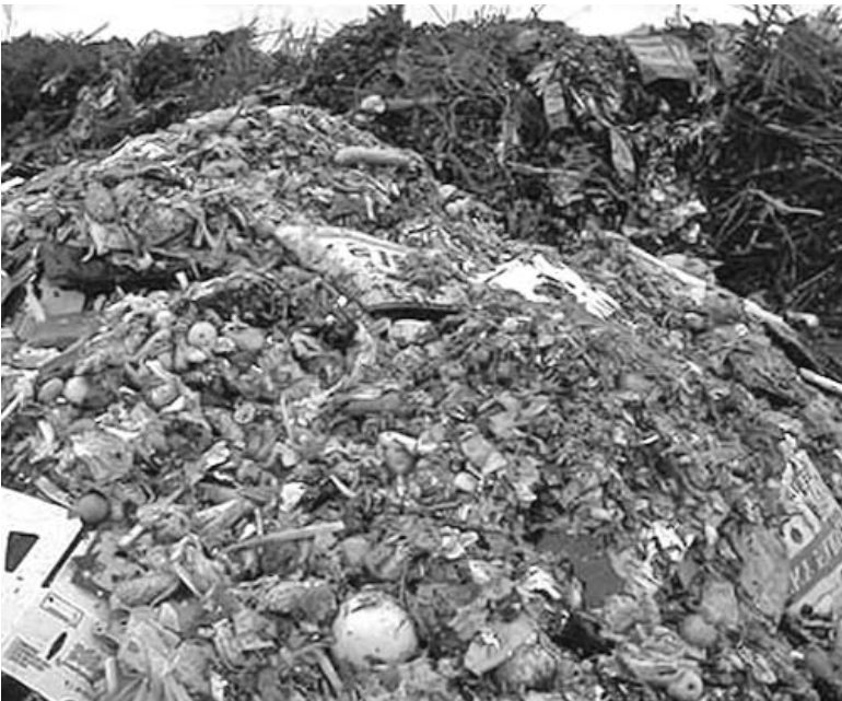
Más de un tercio de la comida que se produce en el planeta acaba en la basura.

El libro también señala que el mercado de materias primas alimentarias pasó de unos 35 000 millones de dólares en el 2004 a acumular 350 000 millones en el 2009.