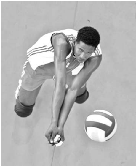
Wilfredo León, al frente como capitán del equipo.

En cuanto a la Copa femenina, este miércoles chocarán China-Estados Unidos, Italia-Alemania, Japón-Kenya, en el grupo A, y en el B lo harán Serbia-R. Dominicana, Argelia-Sudcorea y Argentina-Brasil.