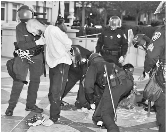
La ola de desalojos dejó al menos 63 arrestados durante el fin de semana.

En el operativo la Policía alegó que los activistas no tienen derecho a permanecer en la zona, por lo que las fuerzas de seguridad procedieron como en los últimos días en Salt Lake City (Utah), Portland (Oregón), Denver (Colorado) y San Luis (Misuri). Estas acciones dejaron al menos 63 arrestados durante el fin de semana, agrega EFE.