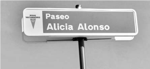
Indicador del paseo madrileño que lleva el nombre de la gran artista cubana.