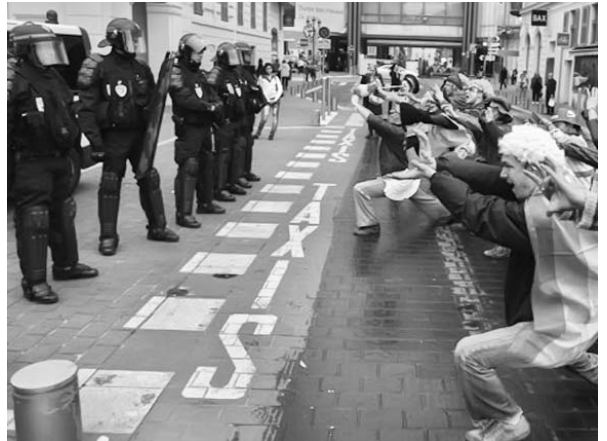
Más de 12 000 agentes rodearon a los manifestantes.

Mientras, en Cannes la sexta cumbre del G-20 comenzó marcada por la crisis de la deuda griega, el posible con-