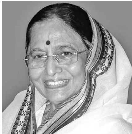
La presidenta india, Pratibha Patil, envió un saludo especial a Fidel y Raúl.

Cueto agradeció a Patil las muestras de amistad y solidaridad de su país hacia la Mayor de las Antillas y evocó el