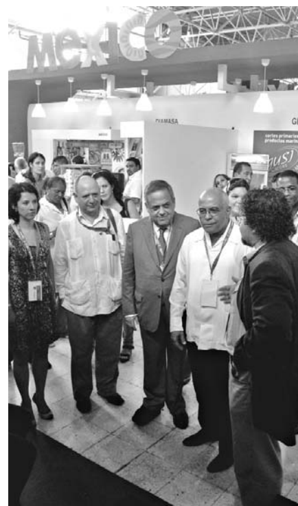
Orlando Hernández, viceministro de Comercio Exterior e Inversión Extranjera visita el Pabellón de México en FIHAV 2011.

A la Feria Internacional de La Habana, en su edición 29, asisten más de 50 empresas mexicanas, "las que llegan con el objetivo de fortalecer los lazos comerciales entre ambas naciones", precisó el