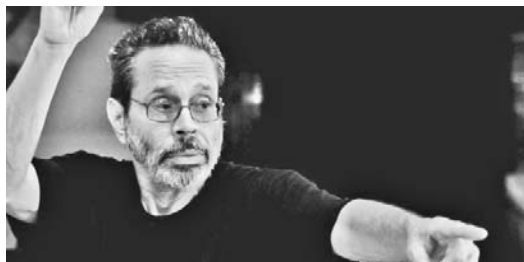
El maestro Leo Brouwer durante uno de los ensayos en el Teatro Municipal de Sao Paulo.

Leo Brouwer, principal protagonista del III Festival Internacional de Guitarra de Sao Paulo