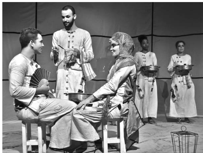
Teatro de la Luna en El dragón de oro.