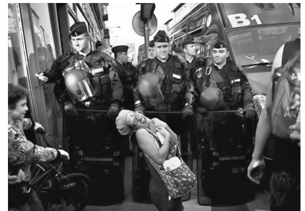
Miles de policías fueron desplegados ante la marcha pacífica.

El Foro de los Pueblos se efectúa aquí debido a que las autoridades francesas prohibieron el acceso a Cannes, sede de la cumbre del G-20, agrega