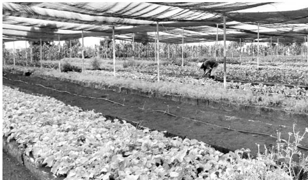
El cultivo semiprotegido fue uno de los elementos evaluados.

Rodríguez Nodals consideró como lamentable que Sancti Spiritus perdiera la condición de provincia de referencia