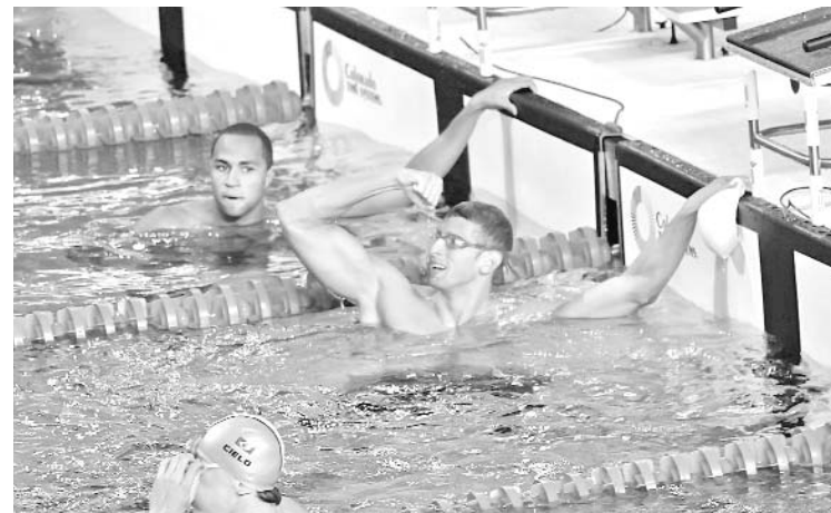
El cubano observa la pizarra y celebra al concluir la prueba.

“Sobre todo esta última etapa ha sido de grandes progresos: en Shanghai bajó de los 49