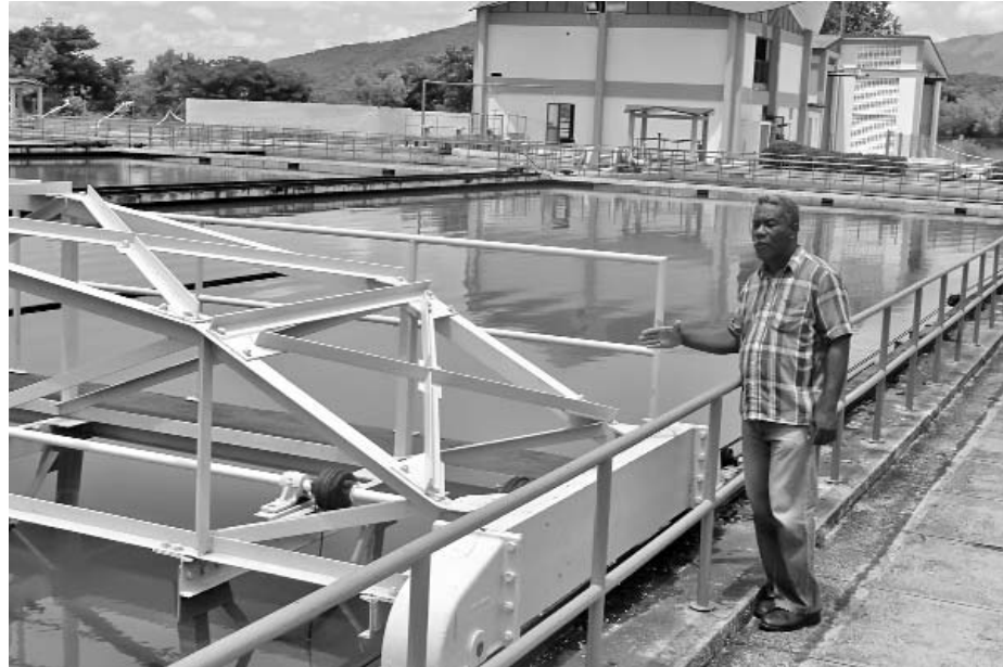
Bien terminada, capaz de entregar con sus dos plantas 2 400 litros de agua por segundo, la remodelación convirtió a Quintero en el mayor sistema potabilizador.

Considerando las exigencias reiteradas por la trascendencia de esta obra, era de suponer que no habría margen para la improvisación, pero como posteriormente corroboraron los