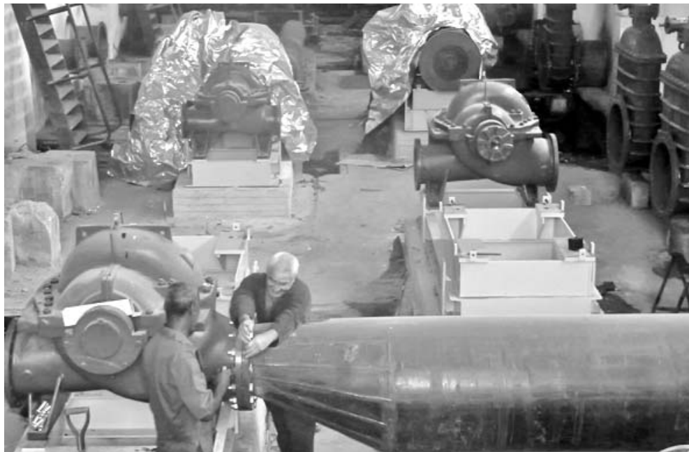
Montaje de las primeras electrobombas en la estación de bombeo La Yaya.

No obstante, la provincia continúa siendo una de las que cuenta con menor área bajo riego. Fuentes de la Agricultura aseguran que con esa categoría existen 7 mil 255 hectáreas, de las que solo se explotan 4 mil 914 (68 %) por deterioro de los sistemas.