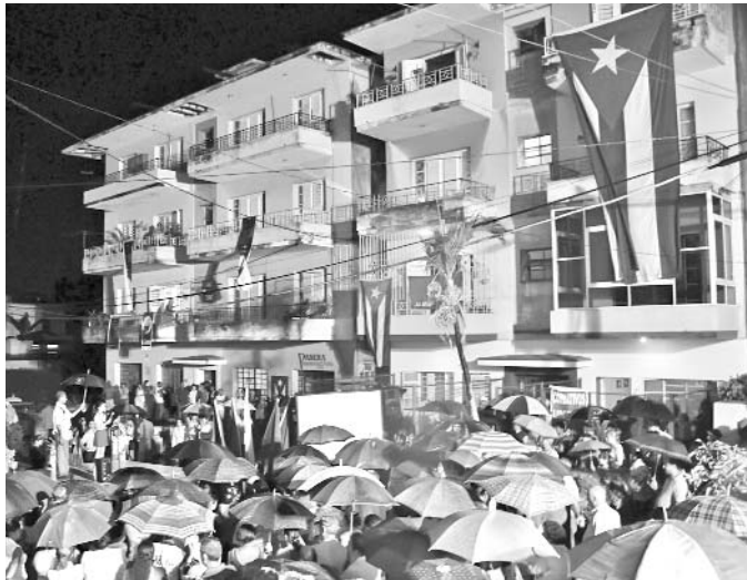
Tampoco la lluvia puede contra un pueblo que clama justicia.

lluvia, jóvenes, niños, ancianos... dieron fe de su solidaridad en la batalla por hacer triunfar la justicia, reiterando la voluntad de que ante la negativa de los Estados Unidos de hacer lo justo y respetar a nuestro pueblo, solo queda una opción: continuar luchando desde nuestras trincheras de ideas, con la clara convicción de que ¡volverán!