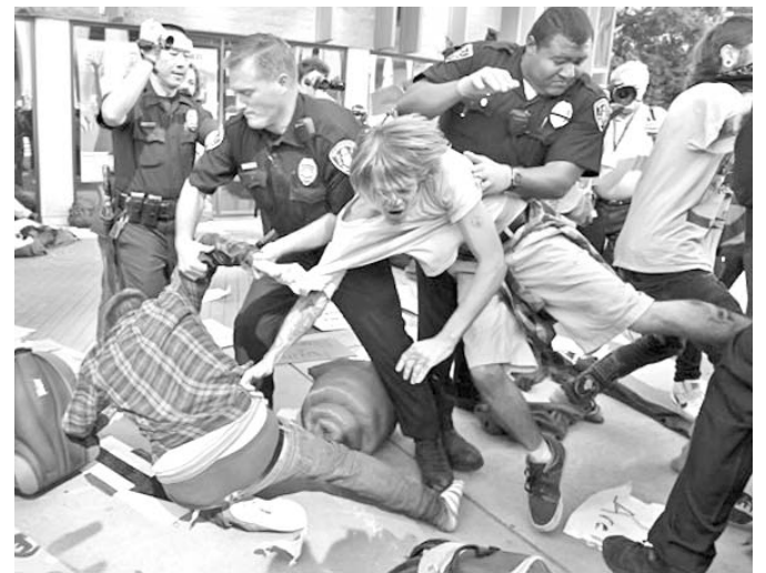
Los indignados en varias ciudades estadounidenses fueron desalojados y arrestados.

Este sábado el presidente sirio, Bashar al Assad, emitió un decreto donde anuncia la for-