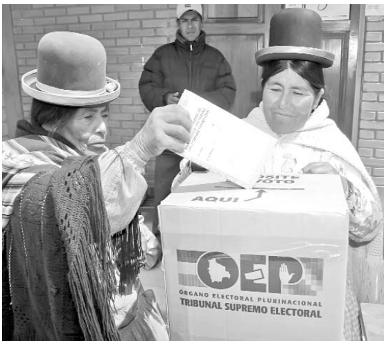
Más de cinco millones de bolivianos eligieron a los magistrados titulares y suplentes del sistema judicial.

El presidente del Tribunal Supremo Electoral boliviano, Wilfredo