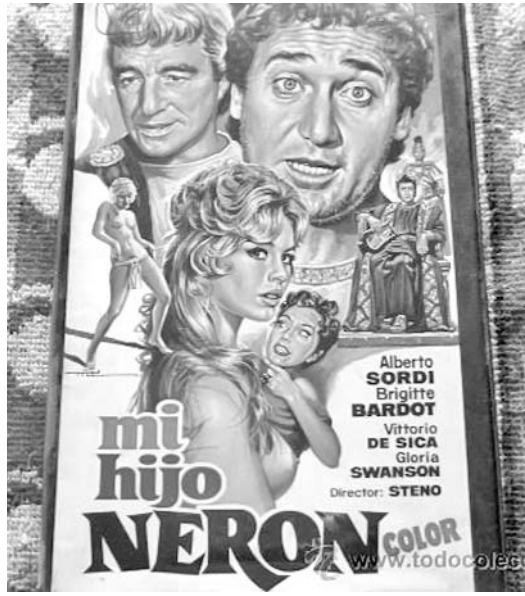
Aquí se anuncia como Mi hijo Nerón , pero es la misma Los fines de semana de Nerón , con Brigitte Bardot

Los más serios en la escuela se ocuparon de buscar referencias librescas acerca de la tal Popea Sabina y fue así que nos enteramos que había estado casada dos veces antes de llegar a los brazos de Nerón. También que había sido la responsable—intriga mediante—, de que el emperador enviara al último hueco a su madre, Agripina, a su amantísima esposa y hasta al venerado Séneca. Abierto el camino al tálamo, Popea se convertiría