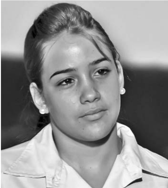
Desde los ocho años Karime mantiene correspondencia con los Cinco.