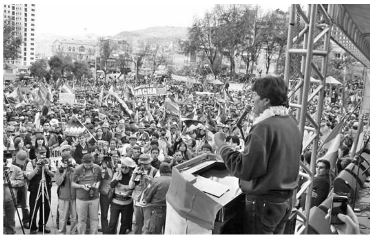
Miles de bolivianos respaldaron al Presidente en la plaza Villarruel.

Más de una veintena de personas murieron y decenas resultaron heridas en una serie de ataques en Bagdad, capital de Iraq. Un atacante suicida embistió un vehículo cargado de explosivos contra una estación policial de Karrada en el sector oeste de la ciudad. Otro suicida detonó sus explosivos en una estación policial en un vecindario chiíta de Hurriya en el norte capitalino, y en el oeste de la ciudad, un coche bomba estacionado hizo explosión junto a un patrullero policial. Los ataques estuvieron dirigidos a la policía, a la que por lo general se le considera el segmento más débil de las fuerzas de seguridad del país. (AP)