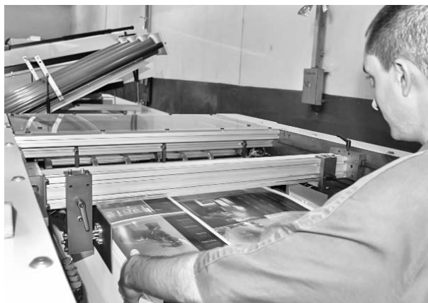
El perfeccionamiento tecnológico de la Fábrica Litográfica de La Habana ha atravesado por numerosas dificultades.

Las sanciones comerciales y financieras impuestas a Cuba de forma unilateral por el gobierno norteamericano limitan, además, los vínculos de la industria gráfica cubana con centros y eventos científicos de la región, dificultando así el acceso a la transferencia de tecnología y la adquisición de piezas y maquinarias de repuesto de alta calidad.