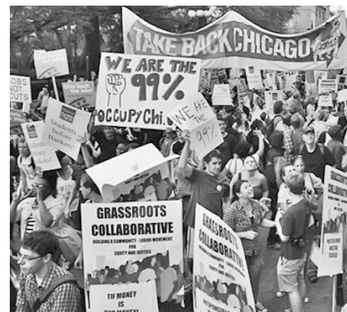
Los manifestantes denunciaron las desigualdades sociales.

ron frente a la sede del Banco de Italia y fueron repelidos por los agentes cuando intentaban entrar en el edificio. Durante la intervención policial, una joven resultó golpeada y herida, reseña la prensa local, según PL.