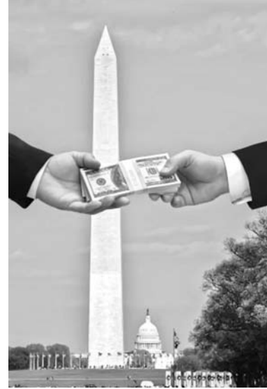
Millones de dólares inundan las salas del poder de Washington aportados por remunerados lobistas de las corporaciones.

Esta colusión corporativa-gubernamental, que a menudo opera a los más altos niveles del poder, ha logrado crear un procedimiento operativo que propicia que los funcionarios del gobierno tengan lo que puede considerarse un segundo empleo como servidores de las corporaciones que, en el caso de los diplomáticos, equivale a un trabajo como agentes virtuales