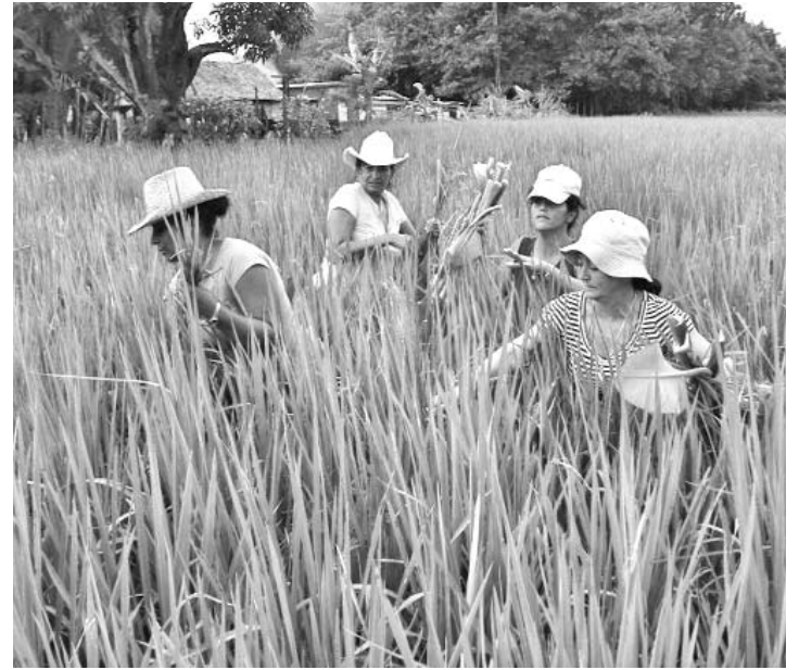
Campesinas y directivas de la Pedro Filgueiras en una plantación de arroz.

Parece que “el librito” de las compañeras funciona bien pues, según refieren ellas y los especialistas aquí, obtuvieron resultados inéditos a escala nacional en una entidad de su tipo, al