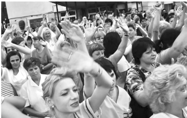
Los médicos denuncian la precaria situación del sistema sanitario.