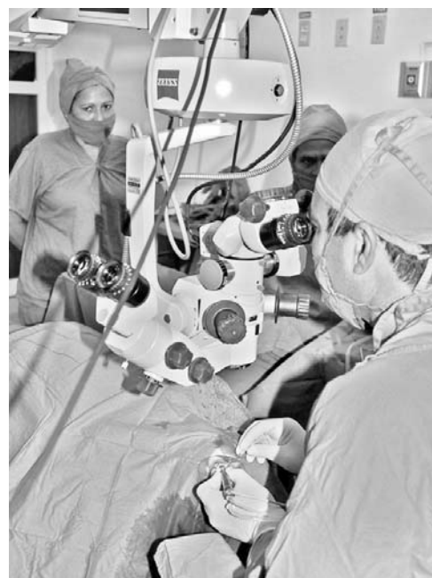
El centro tunero es de los que más cirugía realiza en Cuba mediante la técnica de facoemulsificación.

Tales avances armonizan con el tema central del Día mundial de la visión (hoy)