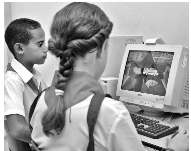
En el trabajo de equipo, todos y cada uno de los miembros son importantes.

Las instituciones educativas deben funcionar como una comunidad educativa y como tal, demandan el trabajo en equipo. Es en este marco donde la enseñanza puede alcanzar éxitos rotun-