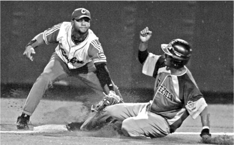
La defensa cubana no ha cometido errores.

bateo, 141, sin poder anotar una carrera en tres partidos. El reverso de la medalla han sido los holandeses, victimarios de dos de los planteles considerados entre los favoritos para seguir avanzando, Taipei de China y Japón. Organizadores de torneos ya tradicionales en Haarlem y Rotterdam, son la nación europea que más ha adelantado en el mundo beisbolero, al extremo de que están empatados con Cuba en fildeo —cero error—, y sus serpentineros promedian 1,17, además de ser punteros en bases robadas, 6. Decepciones hay, como en todo torneo. En este capítulo marchan al frente taipeianos y japoneses, quienes no han podido saborear las mieles de la victoria en cinco desafíos, los primeros lanzando para más de 10 carreras limpias y los nipones exhibiendo un anémico promedio al bate de 210, representados aquí por jugadores de la Liga Industrial. Volviendo a nuestro equipo, constituye toda una satisfacción observar el desempeño de las nuevas figuras. Con dos años en el colectivo, metido en su segundo Mundial, José Dariel Abreu está madurando como pelotero y es el tercero en average con 600, todos sus jits sencillos, sin desesperarse ni tratar de halar lo que le tiren. Eriasbel Arruebaruena arranca exclamaciones de la afición por sus fildeos espectaculares, jugando como si llevara años de