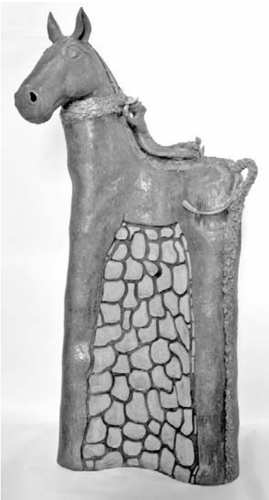
La orientación escultórica se evidencia en la obra de David Velázquez.

Su orientación es eminentemente escultórica, mediante series en las que transfigura imágenes equinas y humanas con gran fuerza expresiva.