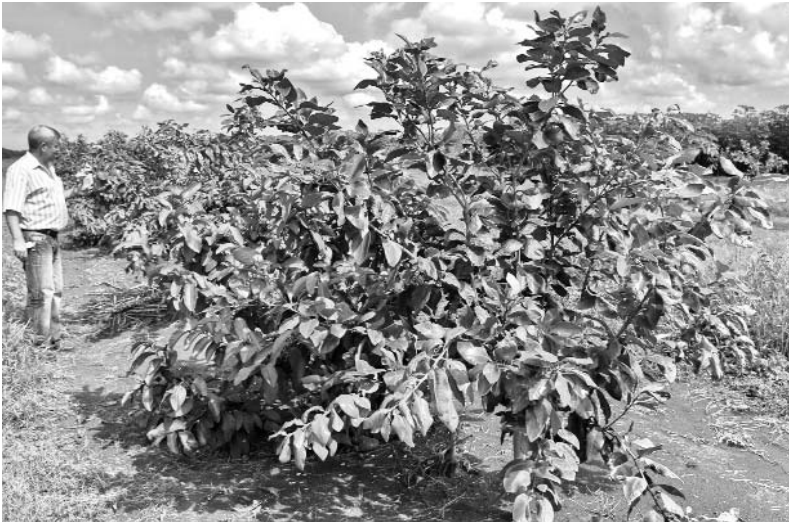
Este es el campo donde deben cosecharse las primeras toronjas de la actual etapa.

Con vistas a abaratar su proceso productivo, la Sergio Soto, única refinería que se dedica exclusivamente al procesamiento del petróleo nacional, adecuó en fecha reciente su sistema de recepción, lo que le permite desde el segundo trimestre del año recibir por ferrocarril parte del crudo procedente de Matanzas.