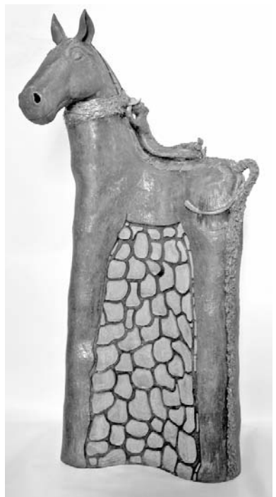
La orientación escultórica se evidencia en la obra de David Velázquez.

Su orientación es eminentemente escultórica, mediante series en las que transfigura imágenes equinas y humanas con gran fuerza expresiva.