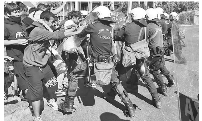
Los estudiantes criticaban los recortes educacionales, cuando la policía cargó contra ellos.

Cubavisión, Cubavisión Internacional, Radio Rebelde y Radio Habana Cuba transmitirán este programa a las 6:30 p.m., y el Canal Educativo lo retransmitirá al final de su emisión del día.