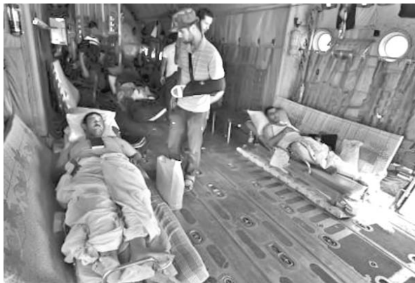
La población en Sirte vive en la zozobra producto de las agresiones.

Las tropas del CNT arreciaron el fin de semana el sitio a esta ciudad, a la par que aviones de la alianza atlántica dispararon contra instalaciones civiles, según constataron empleados