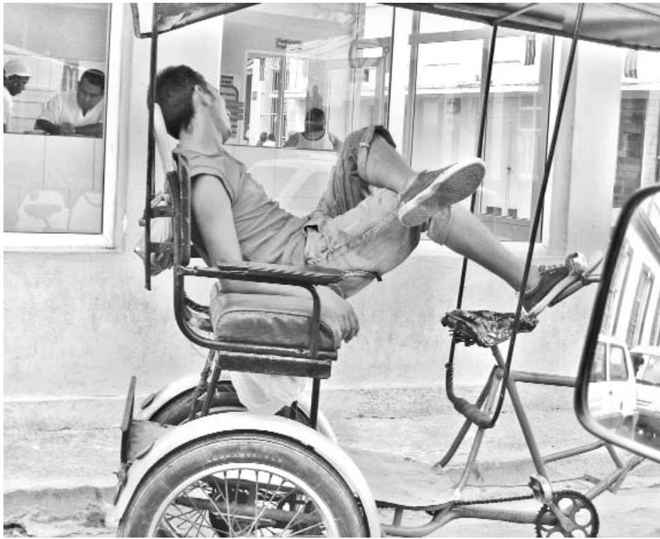
Mientras algunos cumplen con lo establecido, otros le viran la cara al aporte.

Por ilegalidades y violaciones asociadas al trabajo por cuenta propia, en Las Tunas fueron impuestas 2 356 multas entre enero y agosto, con un monto de 546 550 pesos.