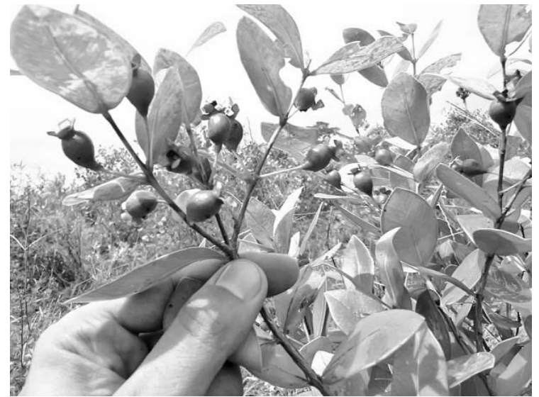
A diferencia del resto de los cultivos, las cosechas de guayabita del pinar se miden en libras y no en quintales o toneladas.

“El objetivo de la cosecha —que todos los años arranca en el mes de junio, y según el comportamiento del clima puede prolongarse hasta octubre— es aportar materia prima para la elaboración de la