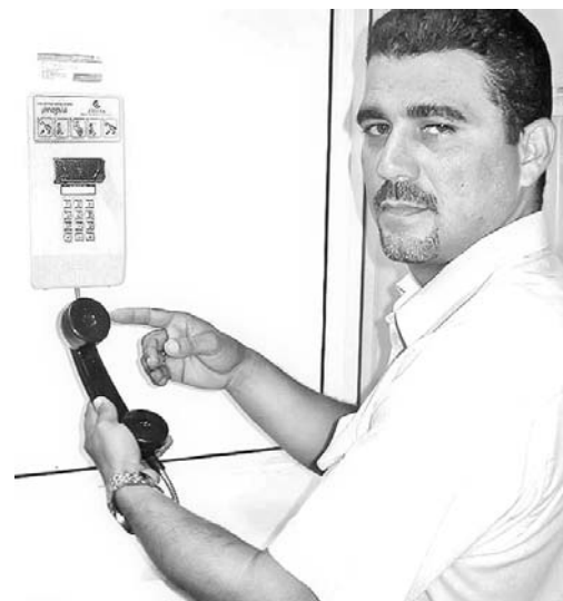
En caso de que alguien intente forzar o dañar el manófono, los interruptores colocados en su interior activarán la alarma, explica Lamas.

Con la instauración de las primeras alarmas, los hechos vandálicos se contuvieron, y ello los estimuló a presentarlas en el fórum de ETECSA, donde la propuesta tuvo una buena acogida, e incluso se está