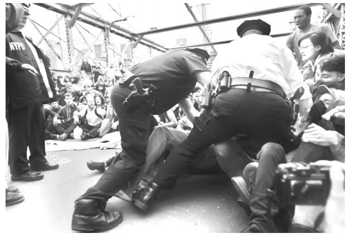
Los participantes en la marcha denunciaron la contundencia de la policía.

El portavoz del sindicato del Ejército húngaro, Peter Konia, dijo a Reuters que "el objetivo es luchar por la democracia y la seguridad social. La errática política económica en el periodo más reciente, la supresión de los impuestos, entre otras iniciativas gubernamentales, han provocado descontento social".