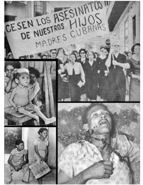
El telón de fondo que tenían los crímenes de la tiranía y la lucha armada insurreccional contra ella, era la desesperanza ante la miseria cotidiana.

Cuba no era en la época inmediata anterior a la victoria sobre el tirano, ni un paraíso ni una excepción respecto a los demás países de América Latina.