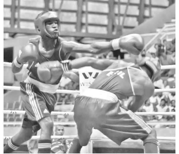
El camagüeyano Toledo (60) quien ganó el sábado regresará hoy al ring.

Fue otra sorpresa, claro, pero no la única, después de que el multilaureado ruso Alber Selimov (60) se viera descalificado ante el venezolano Héctor Manzanilla y de que al