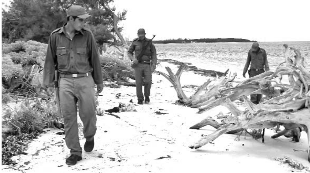
Ante cada aviso de recalo, se despliegan de inmediato las patrullas de revisión del litoral.

“Este año ha sido bastante movido en hechos de drogas, cuya cuantía está en dependencia no solo de las operaciones