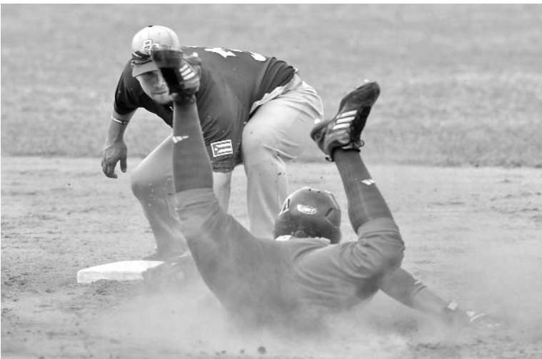
El robo de bases, una asignatura pendiente.