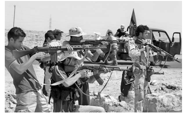
Los sublevados realizan infructuosas escaramuzas en Sirte y Bani Walid.

El portavoz, Moussa Ibrahim, elogió la entereza de sus combatientes, y aseveró que tienen capacidad para seguir luchando "por meses", además de que confirmó la captura en Bani