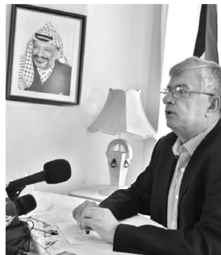
El embajador palestino en Cuba junto a una imagen de Yasser Arafat, líder histórico de su pueblo.

El diplomático aseguró que en la Asamblea General cuentan con el virtual apoyo de más de las dos terceras partes, requerido para convertirse en el miembro número 194.