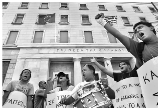
El plan de reformas volverá a esquilmar a la población griega.

El ministro de Finanzas griego, Evangelos Venizelos, confirmó la implementación