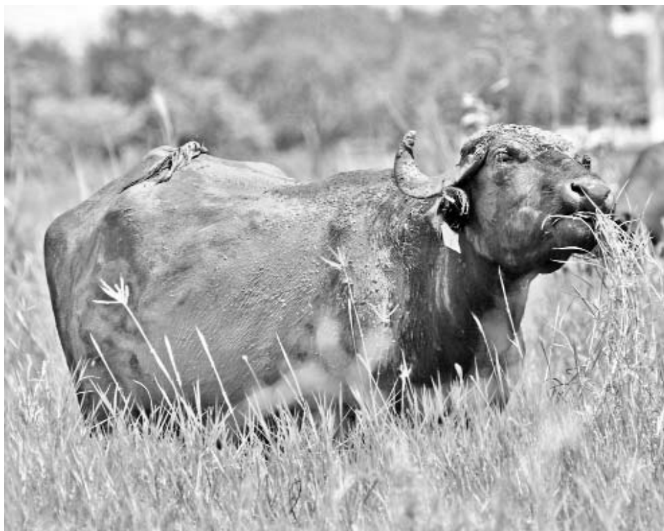
El rebaño de El Cangre tiene lo que necesita para asegurar el futuro de esos animales.

to y necesidad, cuando al búfalo le falta agua y comida, sale a buscarla. Por eso, garantizarles la alimentación es primordial.