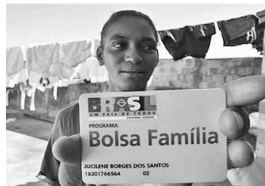
El Bolsa Familia otorga recursos a los núcleos pobres con la condición de que sus hijos asistan a la escuela.

BRASILIA, 19 de septiembre.—El Gobierno brasileño anunció hoy que en los próximos dos años se propone incluir a 800 000