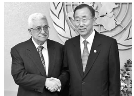
Washington, la Unión Europea y Ban Ki-moon, pretenden evitar la acción de Abbas.

El día 22, en la Casa de la Amistad, tendrá lugar un acto solidario convocado por el Instituto Cubano de Amistad con los Pueblos; y el 23, jóvenes palestinos