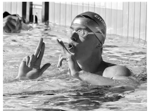
El brasileño César Cielo, tres oros y una plata en Río'07, será el mayor escollo para Hansel.

En el caso de la lid continental, nuestros representantes se clasificaron al hacer la marca mínima, aunque sus registros distan de lo mejor del continente. Por ahora y hasta que se tiren a la piscina del Centro Acuático Scotiabank, a partir del próximo 15 de octubre, serán siete cubanos en pos de mejorar cronos y alcanzar una quimera.