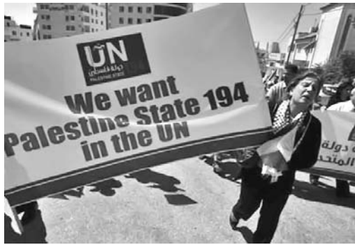
Los palestinos iniciaron la denominada Campaña nacional por el Estado 194.

Mediante una carta entregada este jueves en la Oficina de Ban Ki-moon en la ciudad cisjordana de Ramala, la Autoridad Nacional Palestina (ANP) informó sobre el inicio de la denominada Campaña nacional por Palestina, Estado 194. Reclaman los territorios de