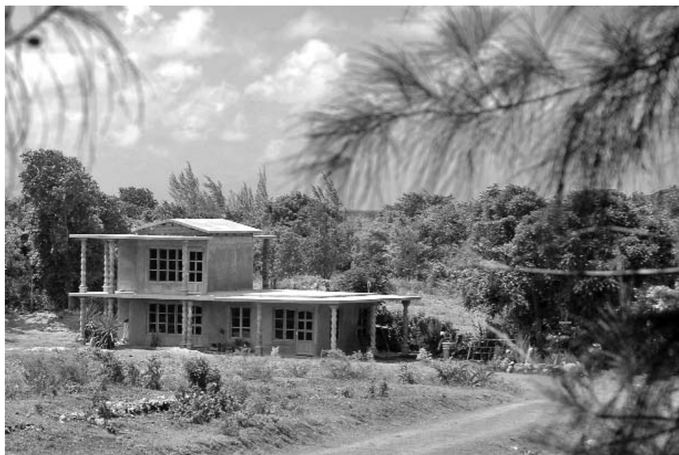
Al otro día de otorgarles autorización por concepto de facilidad temporal, los ocupantes lograron la licencia de construcción. ¿Eficiencia de los funcionarios de la UMIV, de Banes?