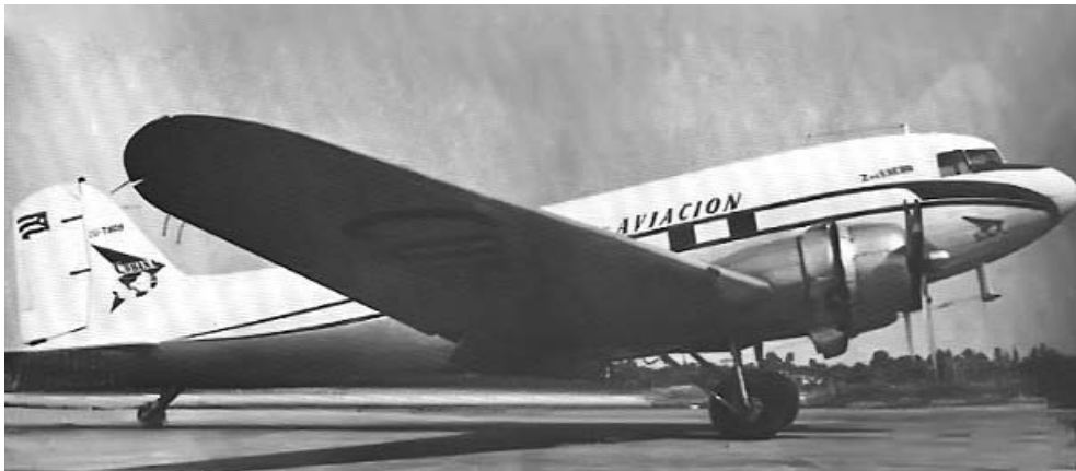
El DC-3 era un avión pequeño, y un tiroteo de más de 20 minutos en pleno vuelo fue como vivir una pesadilla.