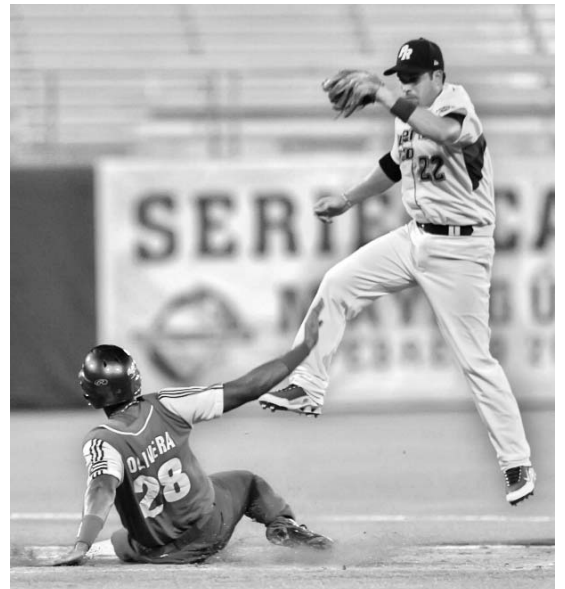
Cubanos y boricuas brindarán espectáculo en el coloso del Cerro.