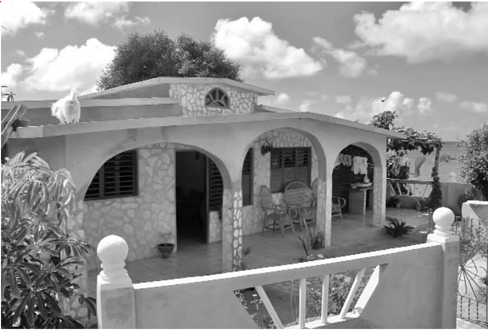
Tras el huracán Ike, sin licencia de construcción, construyeron paredes, cubierta de hormigón y muro perimetral.