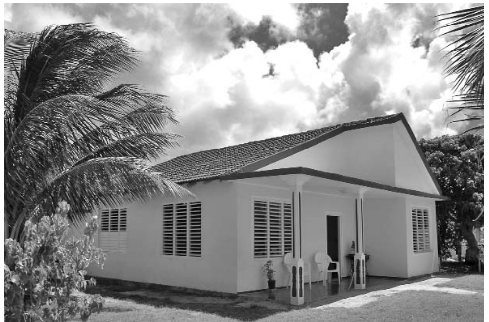
También sin autorización, tras el paso del huracán Ike, reconstruyeron el inmueble con tejas francesas y placa.