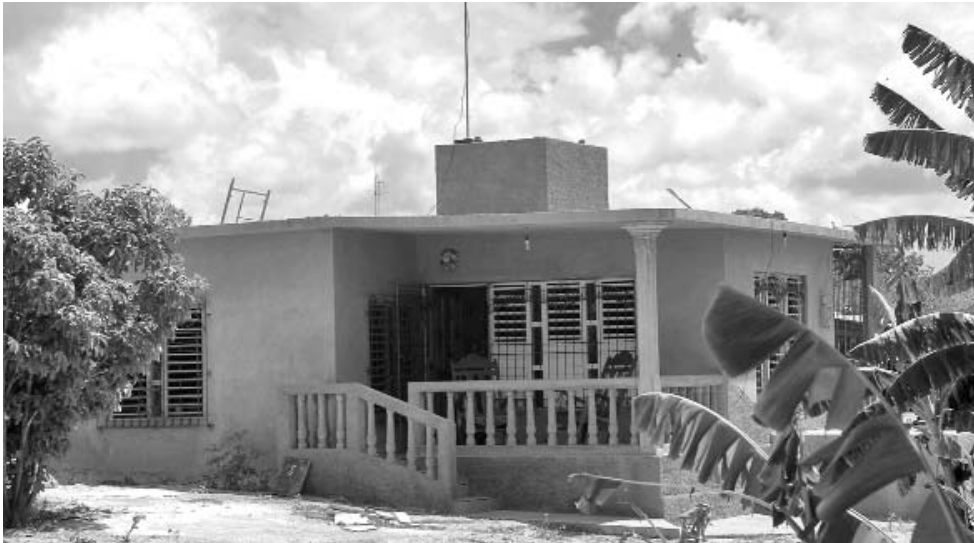
Un "escrito" sin valor legal amparó la construcción en un área ocupada arbitrariamente que luego no fue visitada por inspectores.