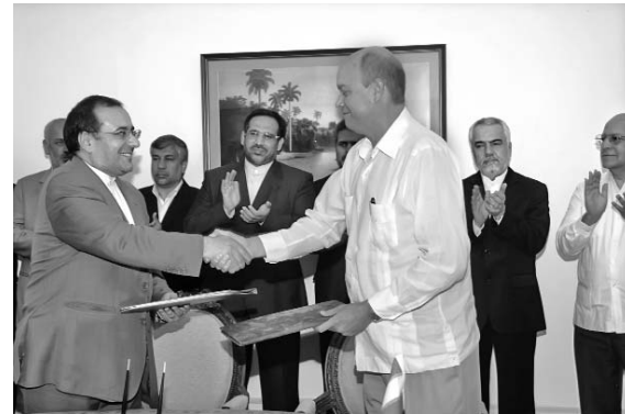
La cita intergubernamental fue calificada de provechosa por ambas delegaciones.

memorando de entendimiento entre la Empresa Cubahidráulica y la empresa iraní Arman Abb, para mejorar la eficiencia de los sistemas de suministro de agua en ciudades cubanas, y el acuerdo entre el Ministerio de Salud y Educación de Irán y nuestro Ministerio de Ciencia, Tecnología y Medio Ambiente.