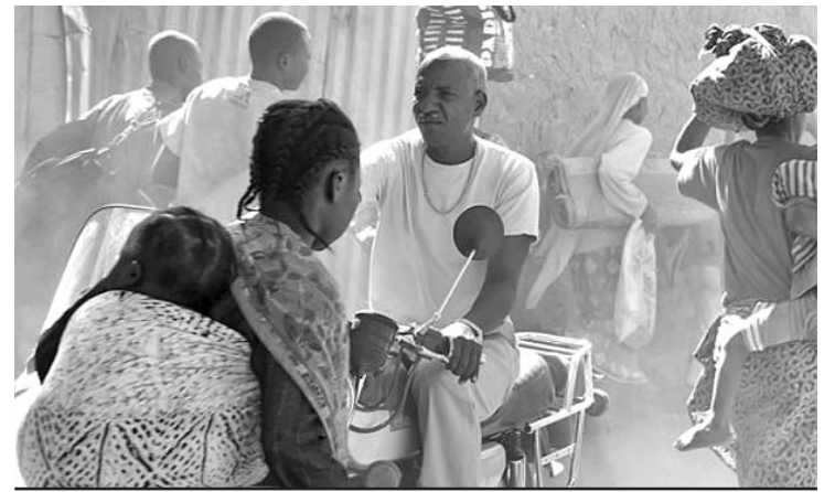
El hombre que grita, del chadiano Mahamat Saleh Haroun, abrirá la semana de cine africano.