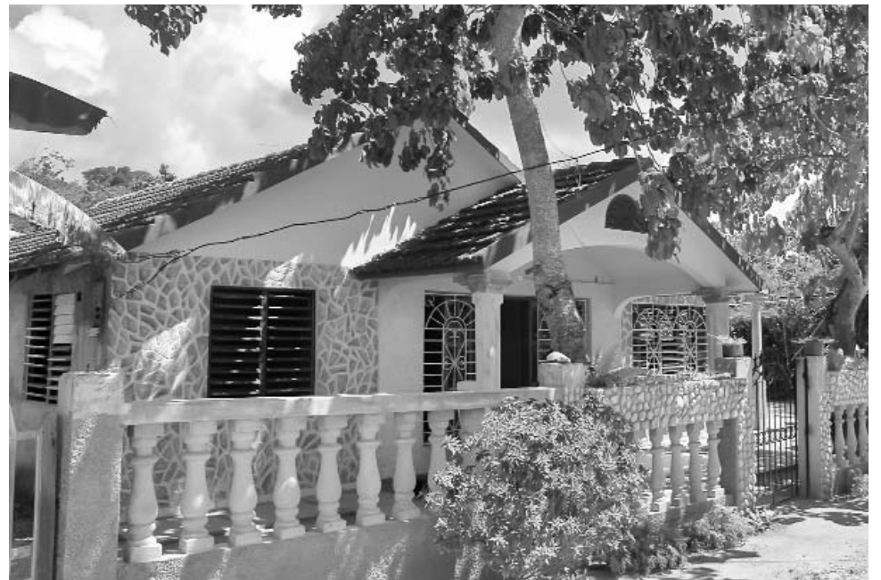
Sin autorización sustituyeron las tejas por placa de hormigón.

La conclusión resulta recurrente: si los responsables de sostener la institucionalidad la infringen, imposible imponer la disciplina y el orden que el país requiere para avanzar.