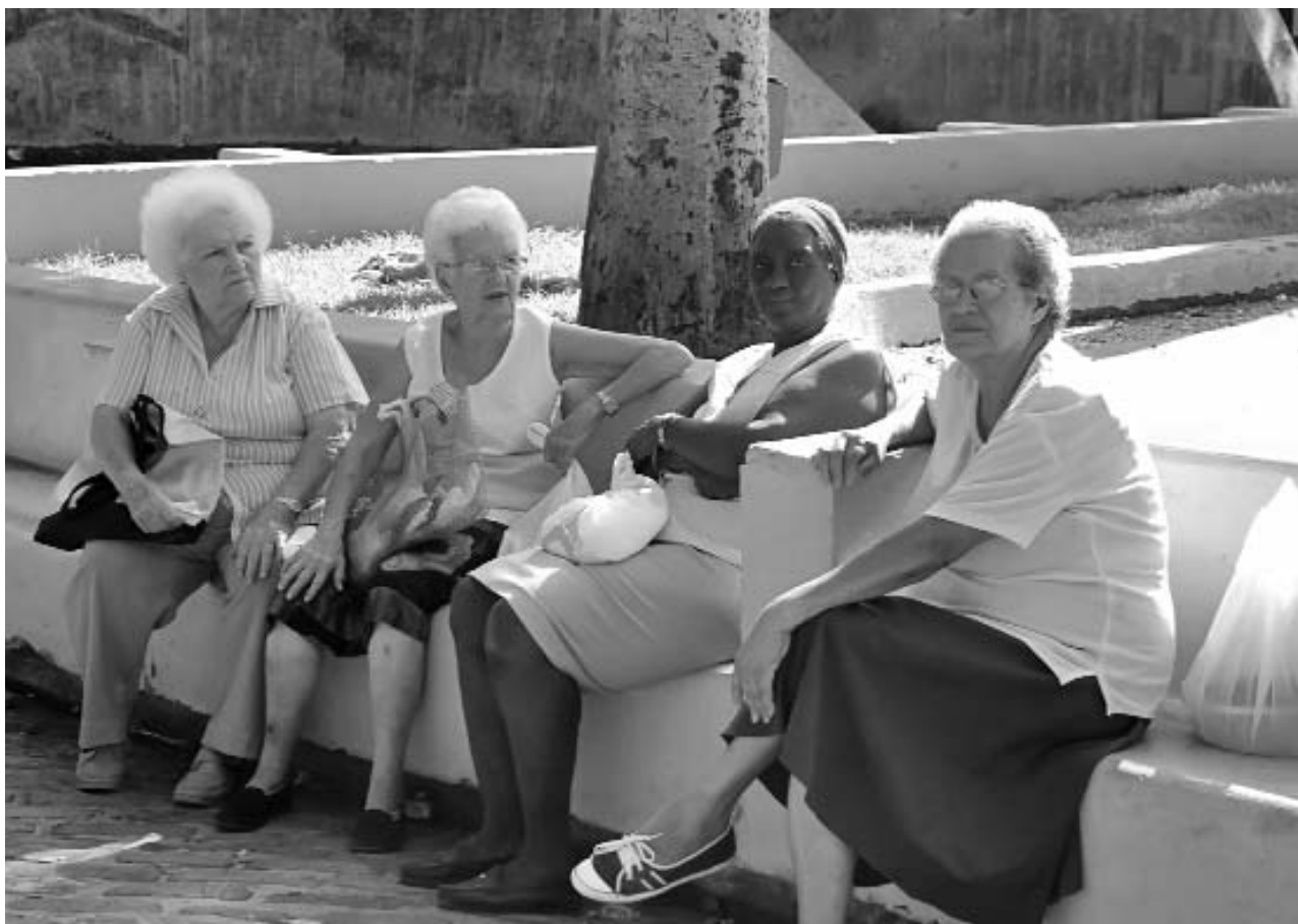
Las mujeres cubanas tienen mayor esperanza de vida que los hombres.

Asimismo, el número de personas en edades activas (15-59 años) que en este año será de 7,3 millones, disminuirá en más de un millón y medio hacia el 2035. Lo anterior fundamenta la modificación establecida en la legislación laboral referida al aumento de la edad de jubilación, pues de no haberse prolongado el momento del