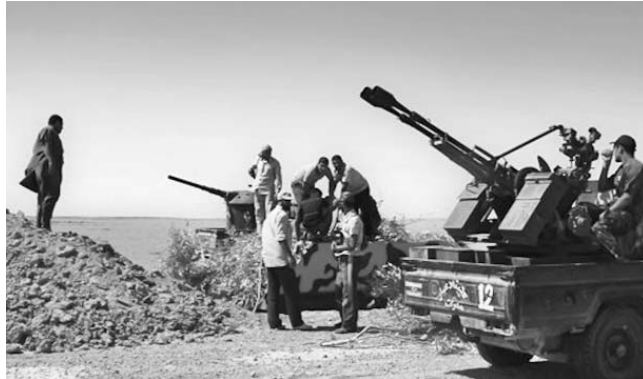
Los opositores tratan desde hace días de tomar Sirte y Bani Walid, sin resultados.

En tanto, el fiscal jefe del Tribunal Penal Internacional (TPI), Luis Moreno-Ocampo, solicitó a Interpol que emita un "aviso rojo" para la detención del líder libio Muammar al