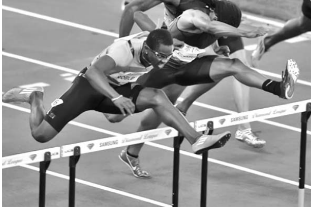
Harold Iglesias Manresa

Sólido, limpio en el cruce de las vallas, potente en el remate e imponente desde la largada, así se mostró el campeón olímpico y recordista mundial de los 110 metros con vallas, Dayron Robles (12.87), exhibiendo su clase para estampar un excelente 13.01 para llevarse el máximo honor del Memorial Weltklasse en Zurich, primera de las dos etapas finales de la II Liga de Diamante.