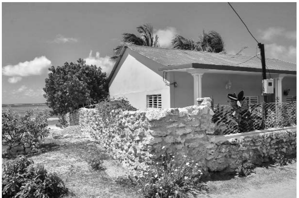
Dos violaciones: Está encima de la duna de playa y construida sin autorización.