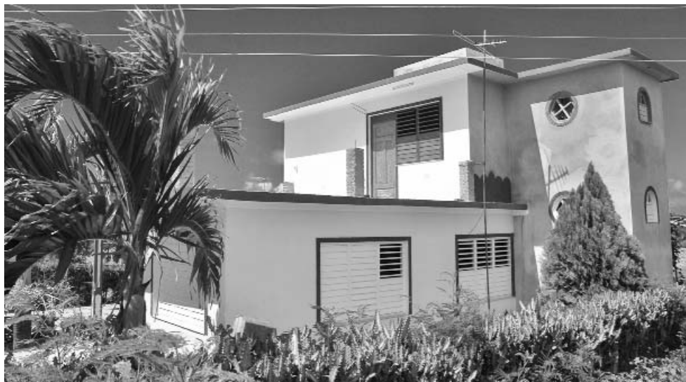
A finales del 2008 realizaron modificaciones y se construyó un cuarto en el segundo nivel sin el permiso correspondiente.

versionista de la Vivienda (UMIV) del municipio de Banes y de la Jefa del Departamento de Control Territorial del mismo establecimiento. Además de ignorar las restricciones, pasaron por alto que los solicitantes no tenían necesidad del inmueble, porque disponían de un apartamento que luego permutaron por una casa en la ciudad de Holguín.