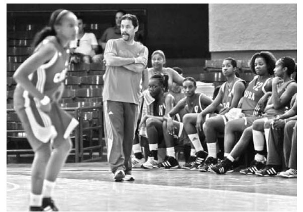
Zabala cuenta con un equipo joven, disciplinado y de gran química entre sus integrantes.

"En lo disparos de larga distancia hemos bajado un poco y al unísono la cantidad de intentos, producto de que la línea la alargaron de 6,25 a 6,75 m.