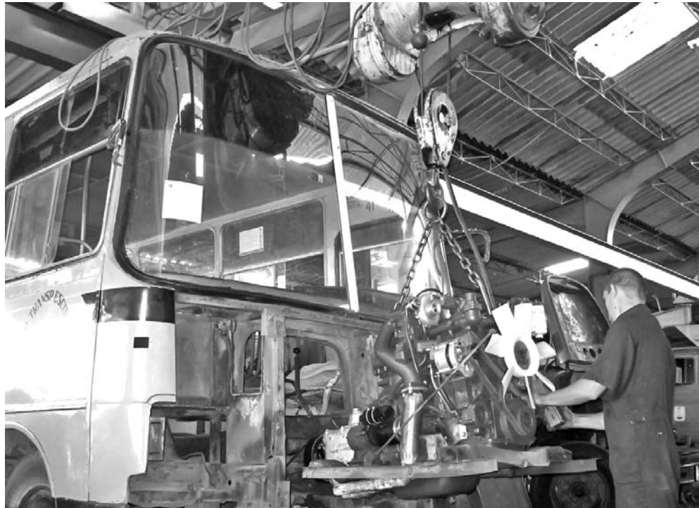
El cambio por motores más eficientes trae consigo un ahorro considerable de combustible.

Refiere el director general que, en favor de la productividad, está próximo a aprobarse también el pago a destajo, según el aporte individual, un sistema que cuenta con el total respaldo de los trabajadores.