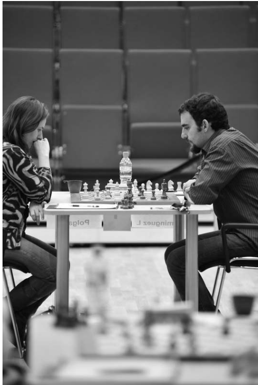
Con asegurar tablas hoy, el ídolo de Güines se incluiría entre los ocho mejores de la lid.

Victoria de Leinier Domínguez y tablas de Lázaro Bruzón conformaron un muy positivo saldo para Cuba en el inicio de la cuarta ronda de la Copa Mundial de ajedrez, en Khanty-Mansiysk, Rusia.