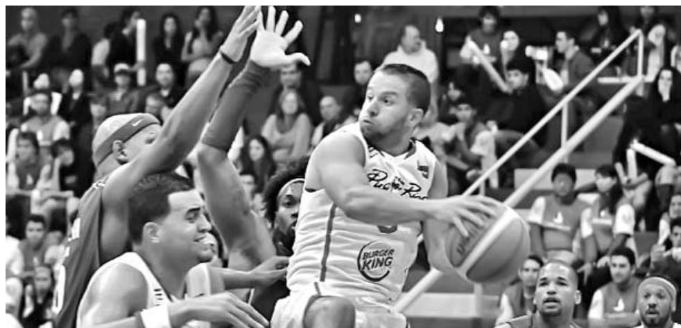
Boricuas y quisqueyanos, esperanza olímpica caribeña.

fue un partido muy duro emocionalmente, pues recién estamos superando lo