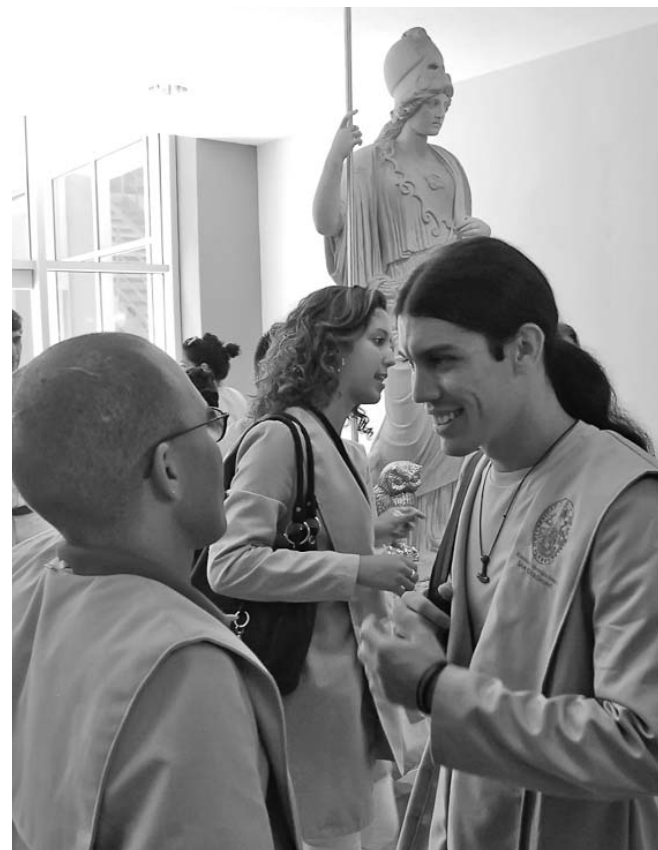
Ataviados con el vestuario de antaño de la Universidad, estudiantes y profesores dieron inicio al curso escolar 2011-2012.