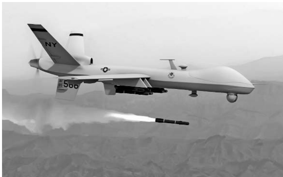
El programa de aviones no tripulados ha matado a más de 2 000 combatientes y civiles desde el 2001.

El cambio ha sido gradual, suficiente como para que su magnitud pueda ser difícil de entender. Los ataques con drones, que habrían parecido antes un imposible futurista, son tan rutinarios que raramente atraen la atención del público a menos que una figura de alto rango de Al-Qaeda sea asesinada.