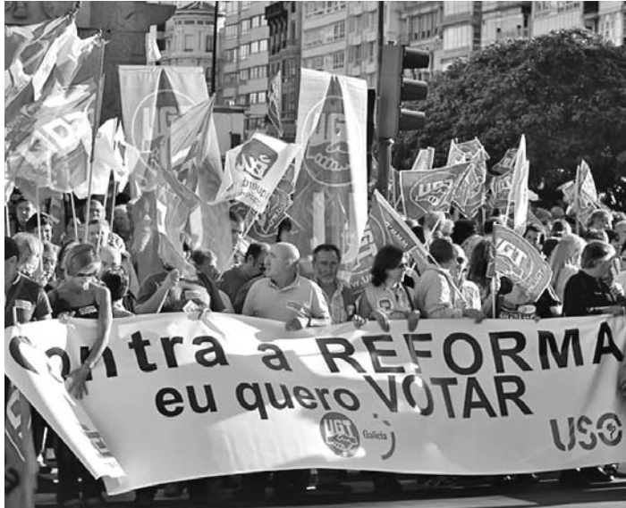
Los manifestantes exigieron un referéndum sobre la reforma constitucional.

MADRID, 6 de septiembre.—Miles de personas salieron una vez más a las calles en diferentes ciudades españolas para pedir un referéndum sobre la reforma de la Constitución, un día antes de que el Senado español apruebe el proyecto definitivo, según AFP.