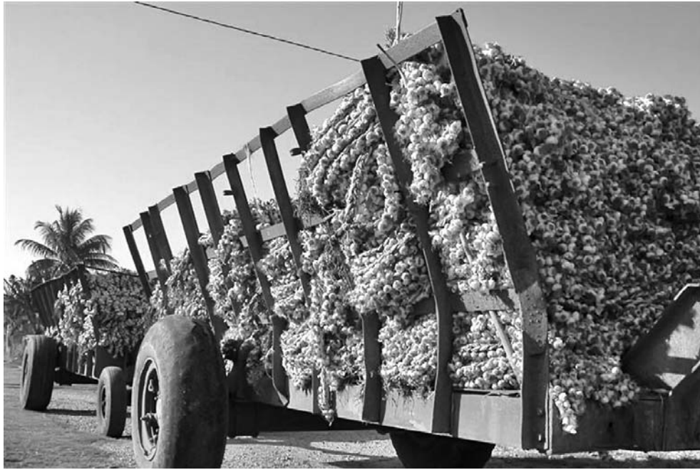
Gran parte del ajo permanece almacenada en espera de mejores precios.

En desleal competencia, rastras y camiones de diferentes lugares, en lo fundamental de la región oriental y la capital, han invadido la zona para ofrecer impor-