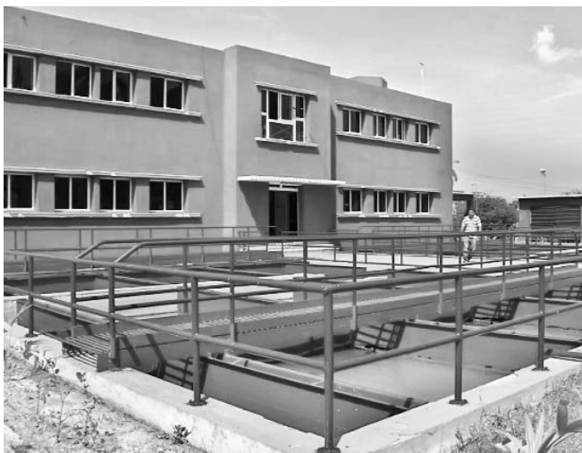
Planta de Caunao.

Estos últimos sitios la reciben de la planta Damují, la cual fue objeto de reposición de filtros y tratamiento de canales. Ello determinó una mejor calidad del producto proveniente de allí: motivo reiterado de inconformidad popular hasta entonces.