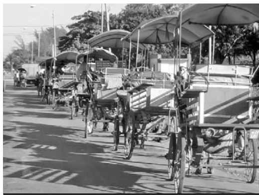
La higiene es vital en la transportación por coches.