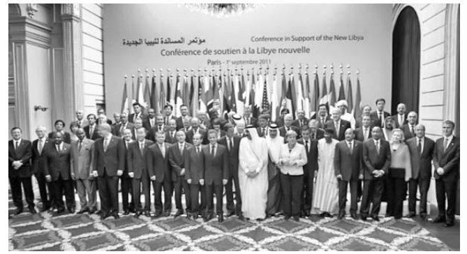
Los "amigos" de Libia se reunieron en París para hablar de un futuro sin Gaddafi.

Por su parte, el portavoz de la coalición Izquierda Unida (IU) en el Congreso de los Diputados (Cámara baja), Gaspar Llamazares, manifestó que la reforma de la Constitución es un procedimiento fraudulento, al tramitar con carácter urgente y en lectura única el proyectado cambio en la Ley Fundamental, informa PL.