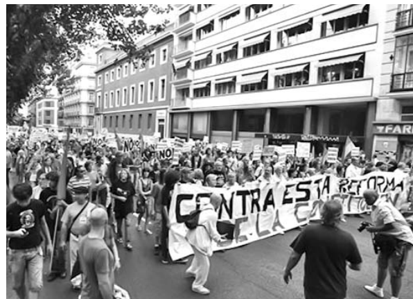
Los manifestantes criticaron además los recortes en la salud y la educación.

Association France Cuba : http://www.francecuba.org