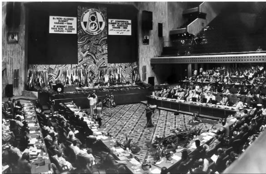
Momento de la intervención de Fidel durante la octava Cumbre del MNOAL.

Un poco distinto es el caso de freír , en el que pueden usarse las formas freído y frito como verbo (también es más frecuente frito ); pero como adjetivo solo se usa frito (Me gustan las papas fritas ).