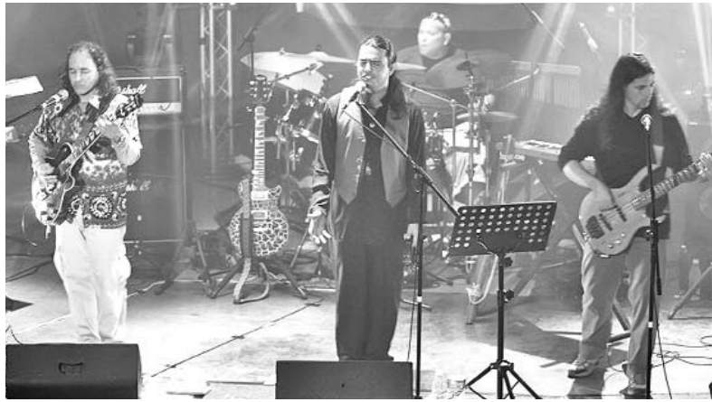
Anima Mundi durante su gira europea.

De hecho, sus apreciables virtudes conquistaron a los espectadores durante sus actuaciones en el Prog Sud, donde tocaron junto a