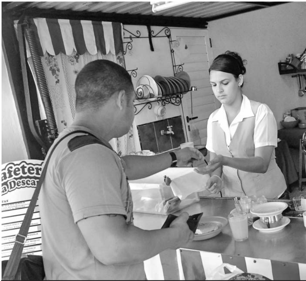
El sector de la gastronomía es uno de los que más pudiera beneficiarse con la extensión de la fórmula cooperativa.

La cooperativa, sin descuidar la rentabilidad, pone en el centro de su diana la satisfacción de necesidades de sus miembros, sus familias y la comunidad. El impacto social está tan imbricado a su razón de ser como la actividad económica. Por ello también son reconocidas mundialmente como “formas de la economía solidaria”.