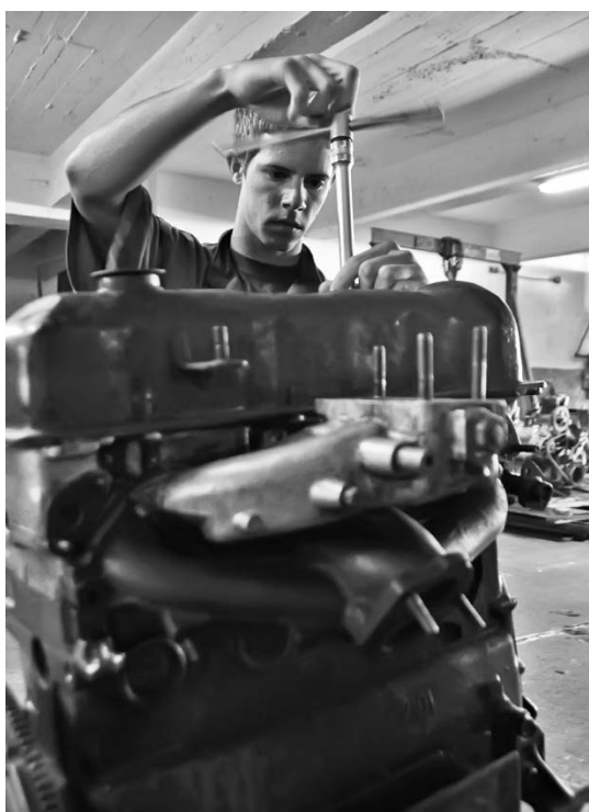
Se continuará fortaleciendo el trabajo con los organismos de la producción y los servicios para asegurar la fuerza calificada que mandan la economía y la sociedad.