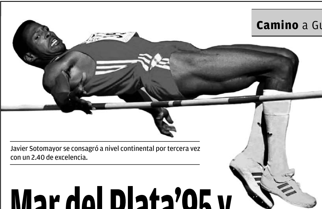
Javier Sotomayor se consagró a nivel continental por tercera vez con un 2.40 de excelencia.