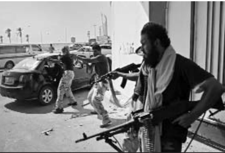
Los opositores libios combaten contra las tropas del Gobierno para lograr controlar Trípoli.

TRÍPOLI, 22 de agosto.—El avance hacia el centro de esta capital de los opositores y combates con los partidarios de Muammar al Gaddafi caracterizan la situación hoy en Libia, que muchas agencias calificaron de confusa.