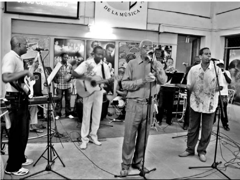
El conjunto Arsenio Rodríguez en el homenaje tributado.

Así, en cada una de sus transmisiones —viernes a las 7:00 p.m y los sábados a las 6:30 p.m— la serie nos ha mostrado imágenes reveladoras sobre el Melocactus guitarti