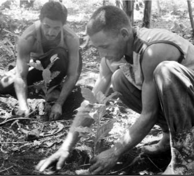
La UBPC Iraelda Marzo ya sembró las seis hectáreas previstas para el año.

Explica que en la siembra lograda mucho ha tenido que ver el incremento del precio del café hasta 50 pesos la lata,