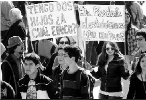
El paro de la CUT también apoyará las demandas estudiantiles por una educación de calidad.

El diplomático propuso a los participantes de la reunión considerar las bárbaras acciones de la OTAN y Estados Unidos en Libia, Iraq y Afganistán, o las de Israel en los territorios palestinos ocupados si tanto les preocupa la vida humana.