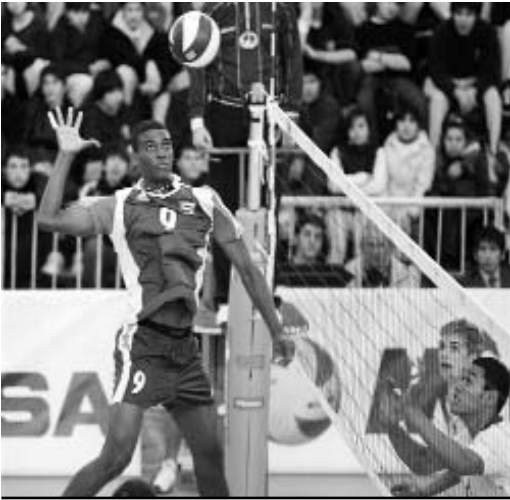
La ofensiva, punto cardinal de los cubanos.

Los cubanos, más allá de los méritos sumados por Bisset, no poseen a ninguno de sus voleibolistas entre los primeros 25 en la defen-