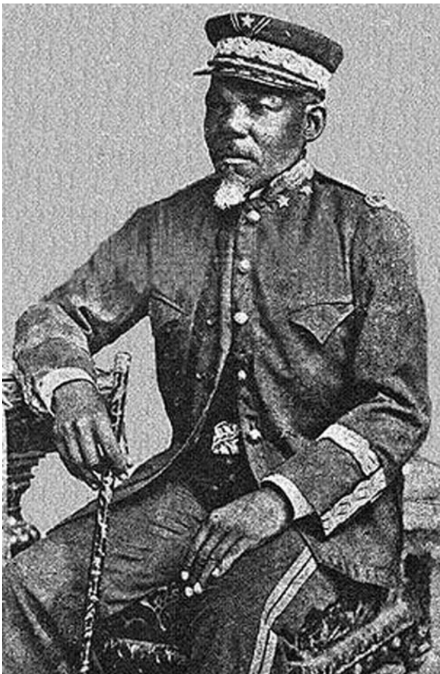
General de División Quintín Bandera Betancourt, nació de una familia libre en Santiago de Cuba, en el barrio Los Hoyos el 30 de octubre de 1834. Bautizado en la Iglesia La Santísima Trinidad con el nombre de Quintino.

Sus actos no son tolerados y los españoles interceptan, el vapor que tanto a él como a José Maceo y Guillermón los conduciría al exilio en Puerto Rico. Y la armada española los encierra en un castillo-