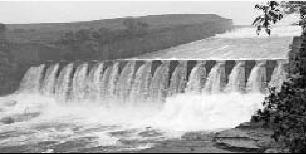
Las precipitaciones provocaron el llenado de la presa La Yaya que mantiene su vertimiento.