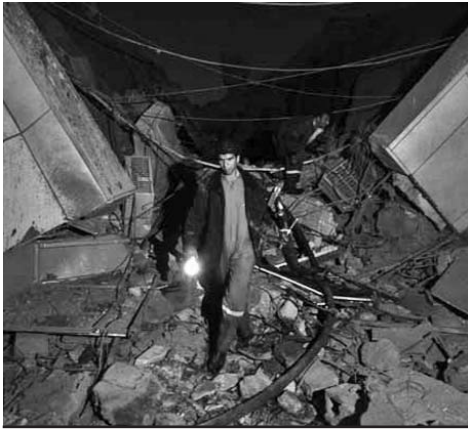
El complejo de Gaddafi fue unos de los puntos atacados por la OTAN durante la madrugada de este domingo.

Asimismo, en una conferencia de prensa desde Trípoli el vocero aseguró que en 24 horas y tras intensos combates y explosiones,