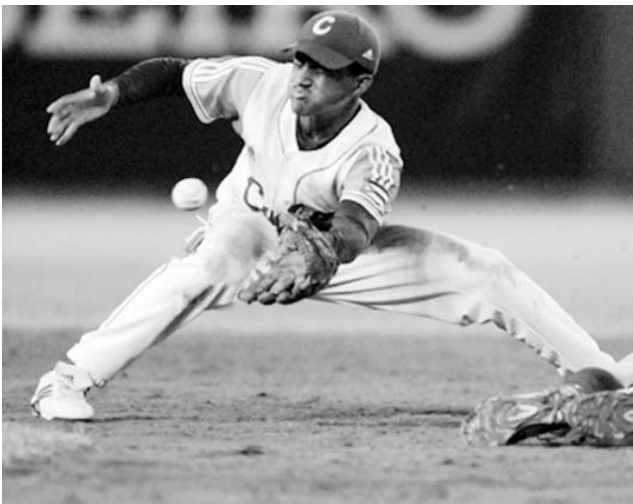
Mejorar la defensa se impone de cara a los próximos partidos.

El despertar del sábado fue algo turbulento para los aficionados del béisbol en Cuba. Desde Aguascalientes, México, llegaba la noticia de la derrota de nuestro elenco 15-16 años ante Holanda, en la apertura del Campeonato Mundial de la categoría. El tropiezo se produjo por ¡forfeit!, suerte que también corrió República Dominicana contra Indonesia. Los organizadores no tuvieron reparos en decretar la victoria de los tulipanes, pues la tardanza resulta tan inexplicable como injustificada (salieron el mismo viernes a las 7:00 a.m.). Baste decir que la distancia entre Cuba y México ronda los 2 000 kilómetros, mientras Holanda está a más de 9 000. No creo que existan justificaciones, pero sí es un hecho que con este descalabro inicialmente podría comprometerse la clasificación de los cubanitos a la siguiente fase, aunque después parece no será tal el drama, porque los quisqueyanos no habían dado señales de vida al cierre de esta edición. Los nuestros no se amilanaron y el sábado doblegaron por la mínima a la escuadra de Japón, pese a cometer tres errores, con des-