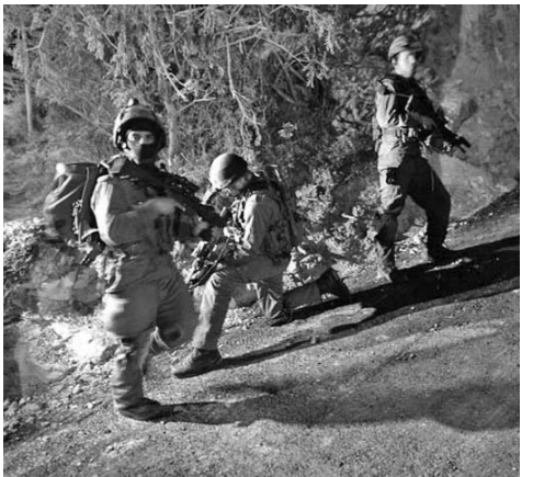
La jornada fue considerada como la mayor redada en los últimos ocho años.

RAMALÁ, 21 de agosto.—Más de medio centenar de personas fueron arrestadas hoy por el ejército israelí en la mayor redada en Hebrón en los últimos ocho años, informaron fuentes palestinas.