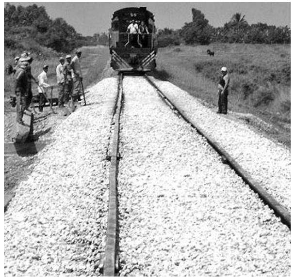
Tras recibir una reparación capital, el puente de Los Pinos vuelve a dar paso a la circulación de trenes.

La alternativa conllevó un esfuerzo enorme de los ferroviarios pinareños, al