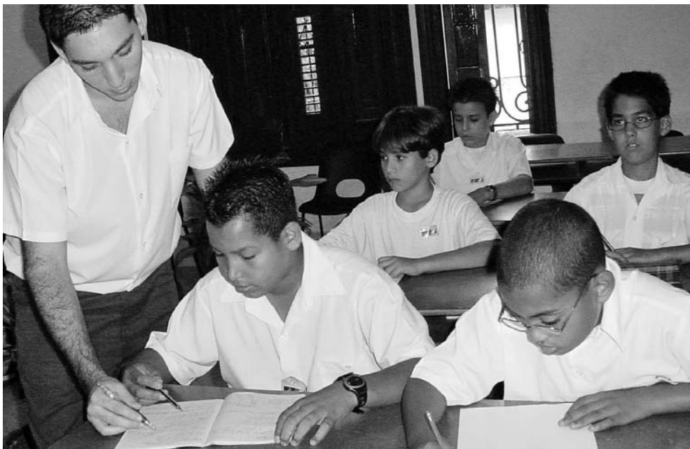
El déficit en estos momentos es de aproximadamente 100 profesores en el nivel de Secundaria Básica.

“Actualmente contamos con más de 14 000 docentes en ejercicio y 6 800 de personal no docente para garantizar a partir del próximo 5 de septiembre, el calendario escolar en 529 instituciones con más de 120 470 alumnos. El déficit en estos