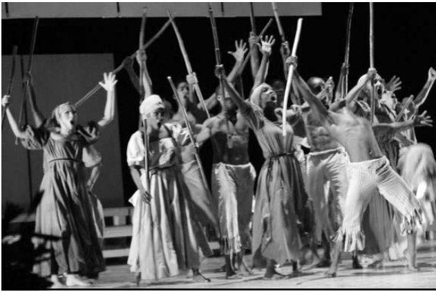
La velada conmemorativa reflejó la diversidad del patrimonio artístico de la Nación.