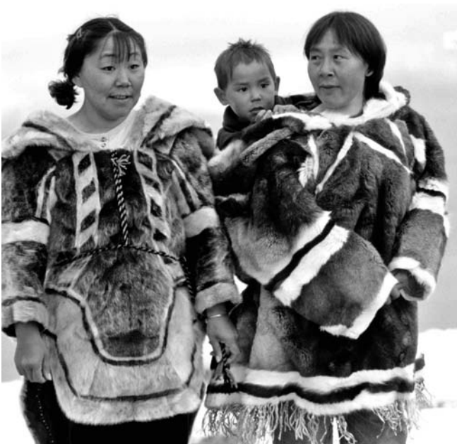
La mayoría de las lenguas indígenas no se encuentra en los libros, ya se ha transmitido de manera oral.

Entre los indígenas pies negros de las llanuras del