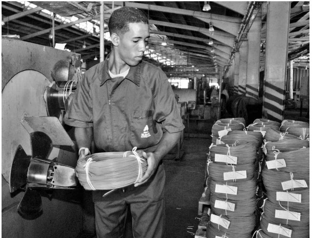
En la planta de telecomunicaciones se producen diariamente cerca de 100 kilómetros de bajantes telefónicos.

so inversionista, se duplicaron las capacidades existentes. Sin embargo, el plan del 2011 apenas contempla el procesamiento del 65 % de esa capacidad.