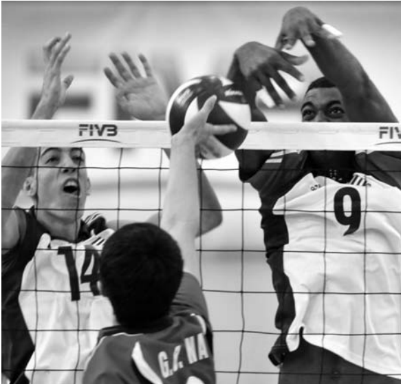
Dos buenas victorias a costa de Brasil y Sudcorea.