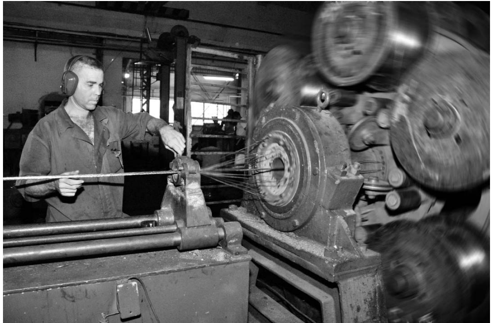
Con una amplia gama de surtidos, la UEB de energía fabrica conductores con potencia hasta un Kv.

Con posibilidades para procesar hasta 10 000 toneladas de cobre y aluminio, ELEKA puede entregar una amplia gama de surtidos de cables eléctricos y telefónicos. Precisamente en el 2005, gracias a un intenso proce-