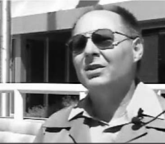
Para Loren, la inmigración ilegal es una ofensa que justifica la pena más alta.

No obstante, el candidato con esa retórica rancia e intolerante avanzó a la elección general con casi 400 votos en su distrito, aproximadamente uno de cada cuatro posibles, y obtuvo lo suficiente para disputarle el cargo al actual concejal en las próximas elecciones generales de la ciudad... (Aida Calviac Mora)