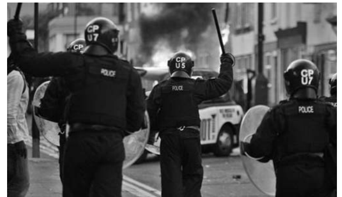
El Gobierno británico anunció toques de queda y redadas nocturnas.