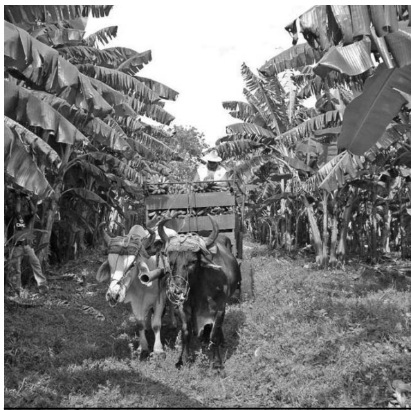
Favorable producción platanera en la granja Belmonte.

Un ejemplo notable es la granja estatal Belmonte, de la UBPC Pepito Tey, con excelentes rendimientos en el cultivo del plátano, desde el inicio