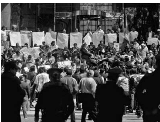
Los manifestantes tomaron la escalinata del recinto en protesta por la injerencia de Estados Unidos.

Durante el acto, los organizadores convocaron al pueblo mexicano a frenar esa guerra, la cual suma 50 000 muertos, 10 000