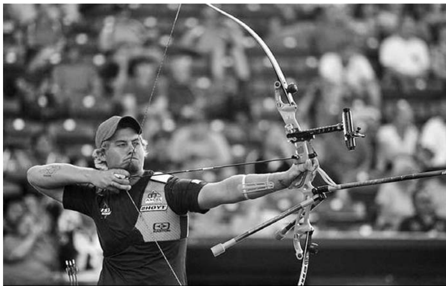
El norteamericano Brady Ellison será uno de los rivales a vencer.

De comportarse con un rendimiento estable, el tiro con arco masculino puede escribir otra historia con letras doradas en Guadalajara, escenario que pondrá a prueba todo el talento de nuestros exponentes.