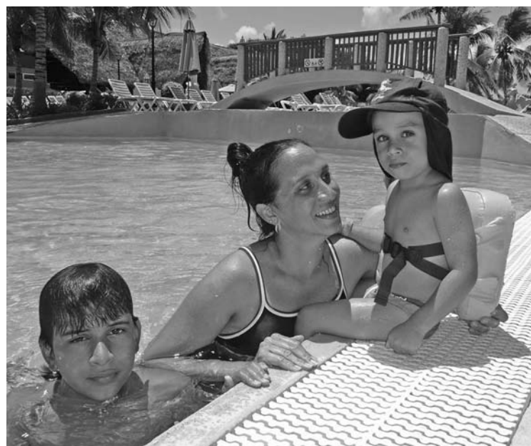
El turismo de familia predomina en el Blau Colonial.

A ese encanto se suman dos restaurantes tipo bufet, otros cuatro especializados, doce bares, tres piscinas y la conocida discoteca Salsa Café, todo lo cual conforma una infraestructura ideal para el turismo de familia que promocionan sus patrocinadores.