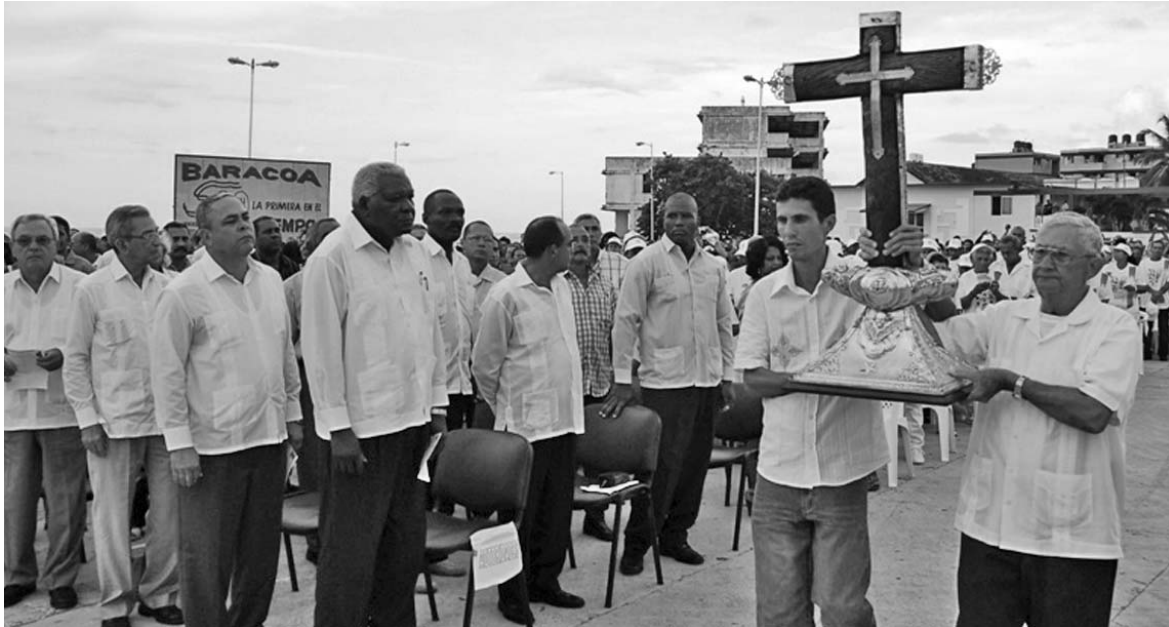
La Santa Cruz de la Parra fue proclamada como Monumento Nacional y Tesoro de la Nación Cubana durante el jubileo de Baracoa.

ÓRGANO OFICIAL DEL COMITÉ CENTRAL DEL PARTIDO COMUNISTA DE CUBA