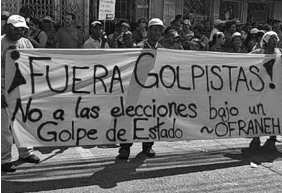
La Organización Fraternal Negra de Honduras (OFRANEH) ha desempeñado un papel activo en la resistencia popular luego de la asonada del 2009.

Pero sucede que tanto el lema como la agenda están viciados desde el mismo punto de partida. El reconocimiento de las contribuciones de la diáspora forzada de las poblaciones africanas tiene que pasar por la admisión de la deuda histórica contraída por las antiguas potencias coloniales con los esclavos y la consecuente reparación de los daños físicos y morales infligidos por la infamante trata. La valoración de las culturas originarias y las que nacieron de complejos procesos de transculturación y mestizaje deben trascender las márgenes espurias de