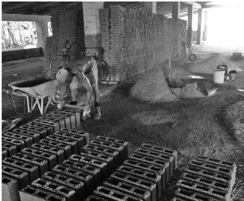
Cada hombre produce manualmente 130 bloques de hormigón en medio día.

Solo un par de consecuencias: primero, la fábrica no accede a la moneda nacional aprobada por el Gobierno para hacer inversiones inmediatas, amén de las sobradas garantías de amortización, porque el banco argumenta, con razón, la gran deuda de la Empresa; segundo, son obligados a parar la producción varios días cada mes por falta de cemento y áridos, debidamente asigna-