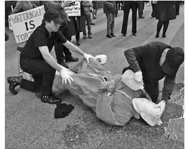
Demostración de la técnica de tortura conocida como submarino, que aparecía en los manuales de instrucción de la Escuela de las Américas.

Los promotores de la misiva, los representantes demócratas James