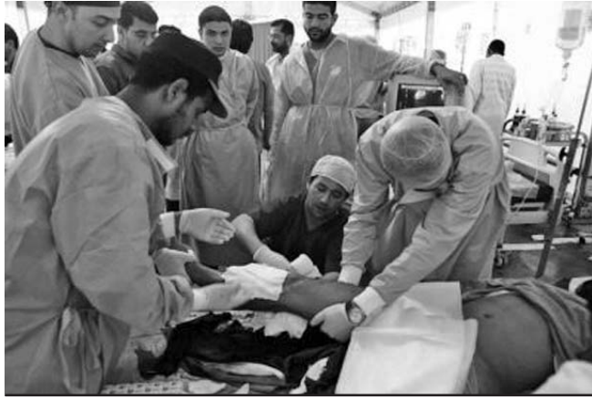
La escasez de medicinas y vacunas aumenta el riesgo de que se desaten graves epidemias.

Astrónomos del Centro Harvard-Smithsonian de Astrofísica (CfA) de EE.UU. descubrieron el exoplaneta más oscuro. Se trata de un gigante gaseoso del tamaño de Júpiter bautizado como TrES-2b, que refleja menos del 1 % de la luz del Sol que cae sobre él, haciéndolo más negro que el carbón o que cualquier otro planeta o luna conocidos de nuestro Sistema Solar. Los expertos explicaron que en nuestro Sistema Solar, Júpiter está envuelto en brillantes nubes de amoníaco que reflejan más de un tercio de la luz del Sol. En contraste, TrES-2b carece de nubes reflexivas debido a su alta temperatura, y orbita su estrella a una distancia de solo tres millones de kilómetros. (La Tercera)