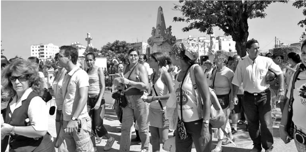
Los visitantes a la Necrópolis de Colón conocen las valiosas obras arquitectónicas que atesora.

Para Senén de la Caridad Iglesias y su familia no es una limitante vivir en el