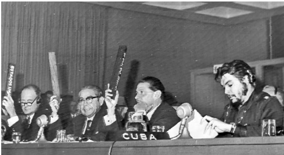
Cuba no votó a favor de la Declaración Final porque esta no atacaba la raíz fundamental de los males de América Latina.

Carrasco, de Montevideo, fue una impresionante demostración. A las consignas ya mundiales como “Cuba sí, yankis no”, se unían las del humor uruguayo: “Llegó Guevara, la cosa se pone brava”. En la ruta a Punta del Este un gigantesco cartel enunciaba el apoyo a la Isla. Minutos antes había llegado Dillon, la multitud se viró ostensiblemente de espaldas mientras cantaba la Marcha del 26 de Julio.