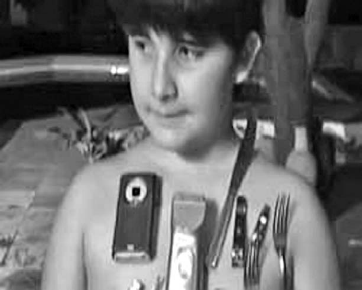
La salud del niño brasileño no corre peligro, aseguran los médicos.

Así que si los niños fueran “magnéticos”, las demostraciones podrían repetirse con ropa puesta o en diferentes posiciones para comprobar si los objetos siguen adheridos al cuerpo. (Tomado de BBC Mundo)