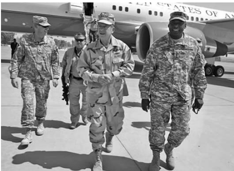
Mullen exigió inmunidad judicial para los 50 000 militares estadounidenses en Iraq.

Ante el recorte presupuestario, el Pentágono afirmó recientemente que no ejercería reducciones en sus gastos de manera apresurada o no planificada que desmejoraran las capacidades militares de su país en otras naciones. (Telesur)