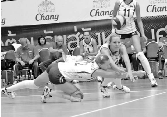
Además del ataque, Rusia mostró su defensa del balón.

Después del esperado revés ante las campeonas del orbe en el debut del Grand Prix (GP) de voleibol, en Tailandia, al amanecer de hoy las cubanas no hallarán mangos bajitos frente a una formación anfitriona que desactivó a las peruanas en un dos por tres. No sorprende el resultado adverso 1-3, aun cuando Rusia jugó con el 50 % de la selección que superó 3-2 a Brasil en la disputa del oro durante el Campeonato Mundial de Japón’10, el pasado mes de noviembre. Y si en la cita nipona la gigante Ekaterina Gamova (2,02m) les anotó 34 puntos a las auriverdes, en la apertura del GP lideró el ataque contra las antillanas, con 24. La capitana Maria Borisenko (8 puntos) y Eugenia Startseva (6) fueron las otras dos mundialistas que ocuparon la cancha, mientras Liubov Shashkova, Tatiana Kosheleva y Maria Perepelkina, quienes también sobresalen a la ofensiva, aunque están entre las 12 del Grand Prix, se tomaron un asueto. El cuadro dirigido por Juan Carlos Gala comenzó intrépido y ganó 26-24, pero el empuje y la experiencia de sus oponentes colmó el rectángulo para dominar 25-18, 25-23, 25-20. La buena noticia, a diferencia de lo realizado por Cuba en el Mundial, es que Wilma Salas se comportó fuerte en el ataque (15 puntos), y debe continuar cerrando filas junto a Kenia Carcacés (14). Nada mal anduvieron las centrales Lianny Castañeda (10) y Rosanna