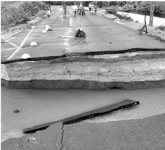
Las afectaciones a los viales fueron de las más significativas.

Actualmente, la provincia supera los 647 millones de metros cúbicos acumulados, lo que representa el 94 % de