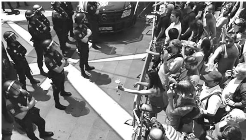
Recuperaron la emblemática plaza, luego de tres días consecutivos de protestas.

MADRID, 5 de agosto.—Miles de indignados entraron la noche del viernes en la Puerta del Sol de Madrid sin que la policía se lo impidiera esta vez, luego de tres días consecutivos de protestas y represión como respuesta de los agentes, reportó DPA.