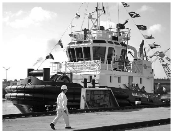
El navío posee una propulsión azimutal (gira 360 grados sobre su eje), una capacidad de empuje de 57 toneladas y una potencia de 4 700 caballos de fuerza.