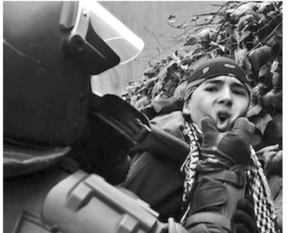
El Gobierno justificó la violencia de Carabineros diciendo que las protestas no estaban autorizadas.

Un año se cumple este viernes del derrumbe en la mina San José en Copiapó, norte de Chile, donde 33 trabajadores quedaron atrapados por 69 días a más de 600 metros de profundidad. A pesar de ese accidente, y las 45 muertes que se produjeron en el 2010, no se concretan cambios en la legislación de uno de los mayores productores de minerales en el mundo.