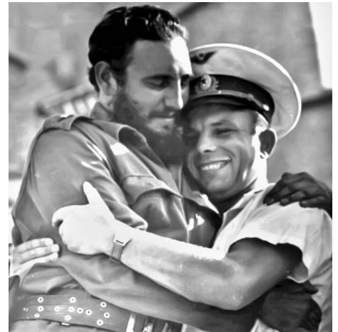
El cariño que Gagarin sentía por Cuba y por Fidel lo expresa este abrazo en el acto del 26 de Julio en la Plaza de la Revolución.

La visita del cosmonauta coincidió con los festejos por el 26 de Julio. Ese día en el multitudinario acto, el doctor Osvaldo Dorticós, al hacer uso de la palabra, dio a conocer el acuerdo del Gobierno Revolucionario de otorgarle a Yuri Gagarin la Orden Nacional Playa Girón, creada días antes por el Consejo de Ministros.